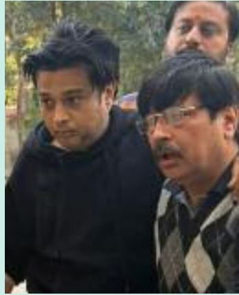
ਸੀ, ਪਰ ਉਨ੍ਹਾਂ ਦਾਅਵਾ ਕੀਤਾ ਕਿ ਰਿਮਾਂਡ ਦੇ ਕਾਗਜ਼ਾਂ ਵਿੱਚ