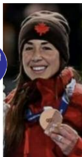
ਮਿਲਾਨੋ-ਕੋਰਟੀਨਾ ਸਰਦੀਨ ਓਲੰਪਿਕਸ ਵਿੱਚ ਕਾਂਸੀ ਦਾ ਤਮਗਾ ਜਿੱਤਣ ਤੋਂ ਬਾਅਦ ਕੈਨੇਡਾ ਦੀ ਸਪੀਡ ਸਕੇਟਰ ਵੈਲੇਰੀ ਮਾਲਟੇਸ।