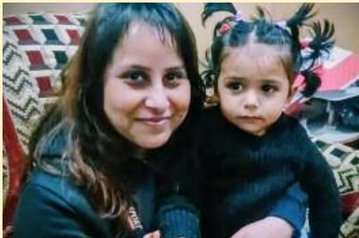
ਇੱਕ ਮਹੀਨੇ ਦੀ ਪੈਨਸ਼ਨ ਭੇਜ ਰਿਹਾ ਹਾਂ।" ਮੈਂ ਫੁਕਰੀ ਜਿਹੀ "ਪਾਪਾ ਇੰਨੇ ਨਾ ਭੇਜਿਓ।"

ਬਣਾਉਣ ਦਾ ਇਸ਼ਾਰਾ ਕਰ ਦਿੱਤਾ। ਕੇਕ ਨਾਲੋਂ ਕੜਾਹ ਵਧੀਆ ਹੁੰਦਾ ਹੈ। ਇਹ ਸਾਨੂੰ ਧਾਰਮਿਕ ਜਿਹੀ ਫੀਲਿੰਗ ਦਿੰਦਾ ਹੈ। ਇਸ ਬਹਾਨੇ ਅਰਦਾਸ ਵੀ ਹੋ ਜਾਂਦੀ ਹੈ ਤੇ ਲੰਮੀ ਉਮਰ ਦੀ ਦੁਆ ਵੀ ਮੰਗੀ ਜਾਂਦੀ ਹੈ। ਮੇਰੇ ਨਾਲਦੀ ਨੂੰ ਸ਼ਗਨ ਭੇਜਣ ਦੀ ਕਾਹਲੀ ਸੀ ਇਸ ਲਈ ਉਹ ਬਾਰ ਬਾਰ ਆਪਣਾ ਫੋਨ ਮੇਰੇ ਮੁਹਰੇ ਕਰ ਰਹੀ ਸੀ। "ਬੇਟਾ ਤੇਰੇ ਜਨਮਦਿਨ ਤੇ ਮੈਂ