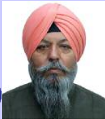
ਸਮਾਜ ਵੀਕਲੀ ਨਿਊਜ਼