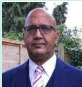
Bal Ram Sampla Geopolitics