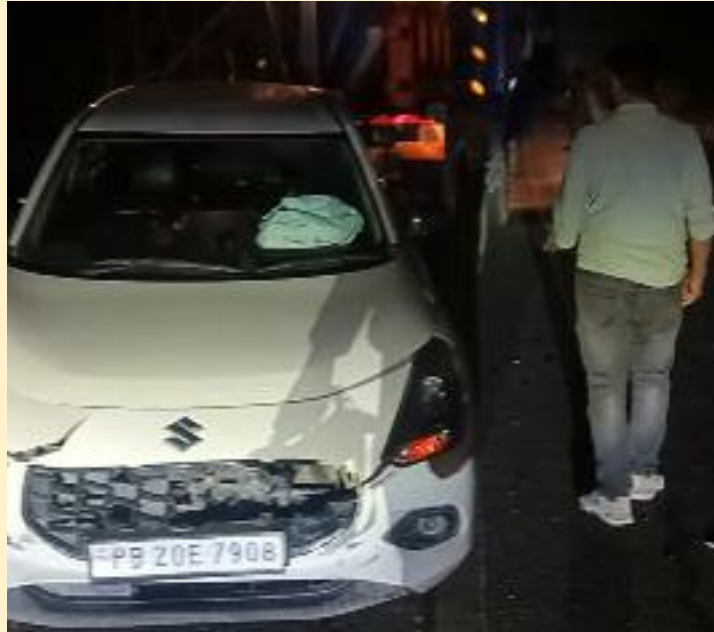
ਸਾਇਡ ਤੇ ਕਰਵਾਇਆ ਅਤੇ ਹਾਦਸੇ ਦੀ ਜਾਣਕਾਰੀ ਕੰਟ੍ਰੋਲ ਆਵਾਜਾਈ ਸੰਚਾਰ ਢੰਗ ਨਾਲ ਰੂਮ ਨਵਾਂਸ਼ਹਿਰ ਅਤੇ ਥਾਣਾ ਬਹਾਲ ਕਰਵਾਈਆਂ ਅਤੇ ਇਸ ਕਾਠਗੜ੍ਹ ਨੂੰ ਦੇ ਦਿੱਤੀ ਗਈ ਹੈ ।

ਪਰਾਗਪੁਰ ਥਾਣਾ ਕਾਠਗੜ੍ਹ ਚਲਾ ਰਿਹਾ ਸੀ । ਜੋ ਕਿ ਰੋਪੜੂ ਸਾਇਡ ਤੋਂ ਬਲਾਚੋਰ ਜਾ ਰਿਹਾ ਸੀ । ਜਦੋਂ ਇਹ ਪਿੰਡ ਸੁੱਧਾਮਾਜਰਾ ਦੇ ਕੋਲ ਪਹੁੰਚਿਆਂ ਤਾਂ ਪਿੱਛੋਂ ਆ ਰਹੀ ਅਣਪਛਾਤੀ ਤੇਜ਼ ਰਫ਼ਤਾਰ ਕਾਰ ਨੇ ਇਸ ਸਵਿਫਟ ਕਾਰ ਨੂੰ ਜ਼ੋਰਦਾਰ ਟੱਕਰ ਮਾਰ ਕੇ ਅਣਪਛਾਤੀ ਕਾਰ ਦਾ ਡਰਾਈਵਰ ਕਾਰ ਸਮੇਤ ਮੌਕੇ ਤੋਂ ਫਰਾਰ ਹੋ ਗਿਆ । ਜਦਕਿ ਸਵਿਫਟ ਕਾਰ ਚਾਲਕ ਗੰਭੀਰ ਰੂਪ ਨਾਲ ਜਖਮੀ ਹੋ ਗਿਆ । ਕਾਰ ਬੁਰੀ ਤਰ੍ਹਾਂ ਨਾਲ ਨੁਕਸਾਨੀ ਗਈ ਜਦਕਿ ਜਾਨੀ ਨੁਕਸਾਨ ਦਾ ਬਚਾਅ ਹੋ ਗਿਆ । ਐਸ ਐਸ ਐਫ ਟੀਮ ਨੈਸ਼ਨਲ ਹਾਈਵੇ ਅਥਾਰਟੀ ਦੀ ਰਿਕਵਰੀ ਵੈਨ ਨਾਲ ਕਾਰ ਨੂੰ