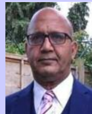
Bal Ram Sampla Geopolitics

The poor implementation of welfare programs for Dalits is not a technical problem of administration. It is a political problem of power. Those who control the system benefit from keeping Dalits marginalized. Until this changes—until Dalits have real power to demand accountability—programs will continue to exist on paper while discrimination continues on the ground. Money and policies are necessary, but they are not enough. What is needed is the political will to challenge centuries of injustice, and the courage to redistribute power to those who have been denied it for so long.