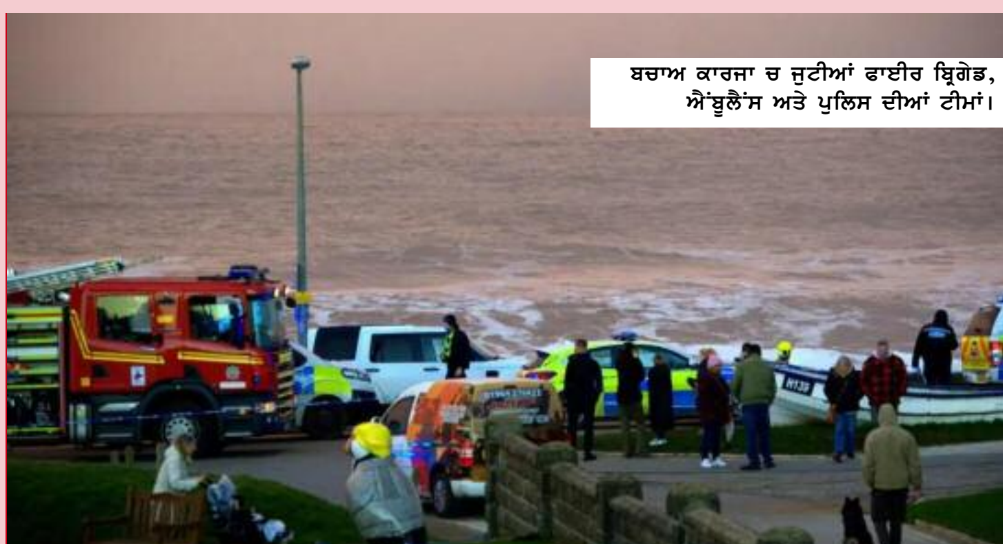
ਬਚਾਅ ਕਾਰਜਾਂ ਦੌਰਾਨ ਫਾਈਰ ਬ੍ਰਿਗੇਡ, ਐਂਬੂਲੈਂਸ ਅਤੇ ਪੁਲਿਸ ਦੀਆਂ ਟੀਮਾਂ।

ਅਤੇ ਸੈਲਾਨੀ ਇਕੱਠੇ ਹੋ ਗਏ। ਹਾਦਸੇ ਦੀ ਭਿਆਨਕਤਾ ਨੂੰ ਦੇਖਦਿਆਂ ਮੌਕੇ 'ਤੇ ਮੌਜੂਦ ਲੋਕਾਂ ਵਿੱਚ ਕਾਫੀ ਸਮੇਂ ਤੱਕ ਦਹਿਸ਼ਤ ਅਤੇ ਸੋਗ ਦਾ ਮਾਹੌਲ ਬਣਿਆ ਰਿਹਾ। ਪੁਲਿਸ ਅਧਿਕਾਰੀਆਂ ਨੇ