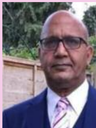
Bal Ram Sampla Geopolitics

of human personality” means taking back what