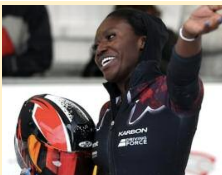
ਜੇਤੂ ਅੰਦਾਜ਼ ਵਿੱਚ ਸਿੰਥੀਆ ਅਪੀਆਹ ਦੀ ਇੱਕ ਤਸਵੀਰ

ਚ ਕਾਮਯਾਬੀ ਹਾਸਿਲ ਕੀਤੀ ਹੈ ਇਹ ਨਤੀਜਾ ਉਸ ਦੇ ਕੈਰੀਅਰ ਦਾ ਸਭ ਤੋਂ ਵਧੀਆ ਪ੍ਰਦਰਸ਼ਨ ਮੰਨਿਆ ਜਾ ਰਿਹਾ ਹੈ। ਖਿਡਾਰਨ ਕੈਨੇਡਾ ਦੇ ਮਹਾਨਗਰ ਟੋਰਾਂਟੋ ਨਾਲ ਸਬੰਧਤ 35 ਸਾਲਾ ਸਿੰਥੀਆ ਅਪੀਆਹ ਨੇ ਦੋ ਗੇਟਾਂ ਵਿੱਚ ਕੁੱਲ 1 ਮਿੰਟ 58.53