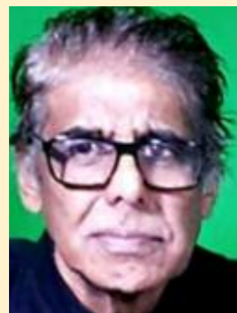
Jai Bharat. Mite Teji.

destroyed Christmas decorations. Church services were disturbed and the Pastors were threatened. The Christmas in good spirit has been celebrated worldwide but, in the manner, some have misbehaved and destroyed Christmas spirit of many in India has not been taken lightly in the West. The National Papers in the West have covered this incident and it is quite likely that it may start hatred towards the Indians in the West. The media in the West has