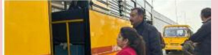
ਵੀ ਕੀਤੇ ਗਏ। ਇਸ ਮੌਕੇ ਟੀਮ ਵੱਲੋਂ ਸਕੂਲੀ ਵਾਹਨਾਂ ਦੇ ਡਰਾਈਵਰਾਂ ਨੂੰ ਇਹ ਗੱਲ ਸਪੱਸ਼ਟ ਕੀਤੀ ਗਈ ਕਿ ਜਿਲ੍ਹਾ ਬਾਲ ਸੁਰੱਖਿਆ ਦਫਤਰ ਅਤੇ ਜ਼ਿਲ੍ਹਾ ਟਰਾਂਸਪੋਰਟ ਦਫਤਰ ਵੱਲੋਂ ਸਮੇਂ-ਸਮੇਂ ਤੇ ਸਕੂਲ ਦੇ ਪ੍ਰਿੰਸੀਪਲਾਂ ਅਤੇ ਸਕੂਲ ਵਾਹਨਾਂ ਦੇ