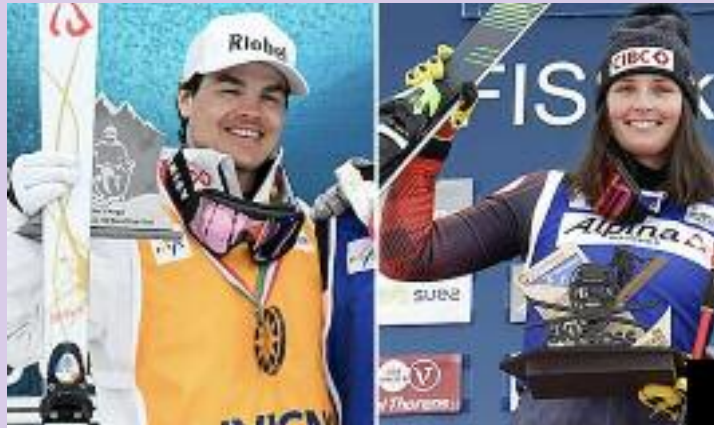
ਮਿਲਾਨ-ਕੋਰਟੀਨਾ ਸਰਦੀ ਓਲੰਪਿਕ ਲਈ ਕੈਨੇਡਾ ਦੇ ਝੰਡਾਬਰਦਾਰ ਚੁਣੇ ਗਏ ਮਿਕਾਈਲ ਕਿੰਗਜ਼ਬਰੀ ਅਤੇ ਮੈਰੀਅਲ ਥਾਮਪਸਨ।

ਕਾਮਯਾਬ ਖਿਡਾਰੀਆਂ ਵਿੱਚ ਗਿਣਿਆ ਜਾਂਦਾ ਹੈ ਅਤੇ ਉਹ ਪਹਿਲਾਂ ਵੀ ਕਈ ਵਾਰ ਓਲੰਪਿਕ ਤੇ ਵਿਸ਼ਵ ਪੱਧਰੀ ਤਗਮੇ ਜਿੱਤ ਚੁੱਕਾ ਹੈ। ਦੂਜੇ ਪਾਸੇ, ਮੈਰੀਅਲ ਥਾਮਪਸਨ ਐਲਪਾਈਨ ਸਕੀ ਵਿੱਚ ਕੈਨੇਡਾ ਦੀ ਮਜ਼ਬੂਤ ਖਿਡਾਰਨ ਵਜੋਂ ਜਾਣੀ ਜਾਂਦੀ ਰਹੀ ਹੈ ਕੈਨੇਡਾ ਦੀ ਓਲੰਪਿਕ ਕਮੇਟੀ ਦਾ ਕਹਿਣਾ ਹੈ ਕਿ ਦੋਵੇਂ ਖਿਡਾਰੀ ਸਿਰਫ ਆਪਣੇ ਖੇਡ ਪ੍ਰਦਰਸ਼ਨ ਲਈ ਹੀ ਨਹੀਂ, ਟੀਮ ਵਧੀਆ ਭਾਵਨਾ ਲਈ ਵੀ ਜਾਣੇ ਜਾਂਦੇ ਹਨ। ਕੈਨੇਡਾ ਭਰ ਦੇ ਖੇਡ ਪ੍ਰੇਮੀਆਂ ਨੇ ਇਸ ਐਲਾਨ ਦਾ ਸਵਾਗਤ ਕਰਦੇ ਹੋਏ ਦੋਹਾਂ ਖਿਡਾਰੀਆਂ ਲਈ ਸ਼ੁਭਕਾਮਨਾਵਾਂ ਦਿੱਤੀਆਂ ਹਨ ਅਤੇ ਉਮੀਦ ਜਤਾਈ ਹੈ ਕਿ ਮਿਲਾਨ-ਕੋਰਟੀਨਾ ਦੀਆਂ ਖੇਡਾਂ ਵਿੱਚ ਕੈਨੇਡਾ ਸ਼ਾਨਦਾਰ ਪ੍ਰਦਰਸ਼ਨ ਕਰੇਗਾ।