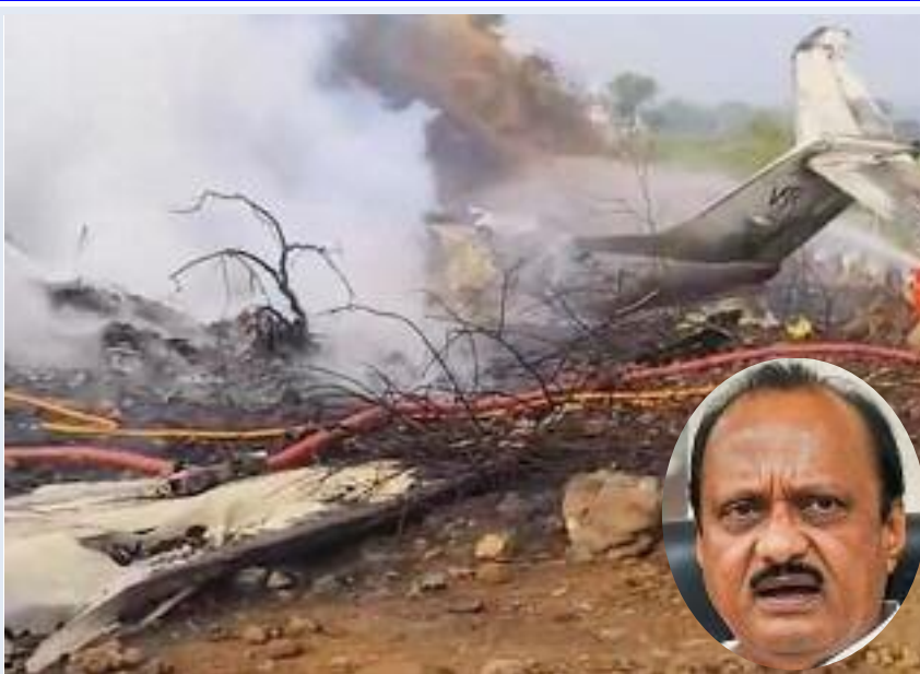
ਅਧਿਕਾਰੀਆਂ ਦੀ ਇੱਕ ਟੀਮ ਹਾਦਸੇ ਵਾਲੀ ਥਾਂ ਵੱਲ ਰਵਾਨਾ ਹੋ ਗਈ ਹੈ। ਪਵਾਰ ਦਾ ਜਹਾਜ਼ ਹਾਦਸਾਗ੍ਰਸਤ ਹੋਣ ਤੋਂ ਬਾਅਦ ਹੋਏ ਜ਼ਬਰਦਸਤ ਧਮਾਕੇ: ਚਸ਼ਮਦੀਦ ਚਸ਼ਮਦੀਦਾਂ ਅਨੁਸਾਰ, ਜਹਾਜ਼ ਹਵਾ

ਬਾਰਾਮਤੀ ਹਵਾਈ ਅੱਡੇ ਦਿਸਣ ਹੱਦ ਘੱਟ ਸੀ। ਉਨ੍ਹਾਂ ਕਿਹਾ ਕਿ ਡੀਜੀਸੀਏ ਅਤੇ ਏਏਆਈਵੀ ਦੀਆਂ ਟੀਮਾਂ ਜਾਂਚ ਲਈ ਮੌਕੇ ਉੱਤੇ ਪਹੁੰਚ ਗਈਆਂ ਹਨ। ਉਨ੍ਹਾਂ ਕਿਹਾ, “ਮੁੱਢਲੀ ਜਾਂਚ ਦੌਰਾਨ ਸਾਹਮਣੇ ਆਇਆ ਹੈ ਕਿ ਹਵਾਈ ਜਹਾਜ਼ ਵਲੋਂ ਲੈਂਡਿੰਗ ਦੀ ਕੋਸ਼ਿਸ਼ ਮੌਕੇ ਦਿਸਣਹੱਦ ਘੱਟ ਸੀ। ਡੀ ਜੀ ਸੀ ਏ (ਡਾਇਰੈਕਟੋਰੇਟ ਜਨਰਲ ਆਫ ਸਿਵਲ ਐਵੀਏਸ਼ਨ) ਦੇ ਇੱਕ ਸੀਨੀਅਰ ਅਧਿਕਾਰੀ ਨੇ ਬੁੱਧਵਾਰ ਨੂੰ ਦੱਸਿਆ ਕਿ ਲੀਅਰਜੈੱਟ 45 (ਲਏਓਰਜੈਟ 45) ਜਹਾਜ਼ ਵਿੱਚ ਹਾਦਸੇ ਸਮੇਂ ਪੰਜ ਲੋਕ ਸਵਾਰ ਸਨ— ਜਿਨ੍ਹਾਂ ਵਿੱਚ ਉਪ ਮੁੱਖ ਮੰਤਰੀ ਅਜੀਤ ਪਵਾਰ, ਦੋ ਹੋਰ ਕਰਮਚਾਰੀ (ਇੱਕ ਪੀ.ਐਸ.ਓ. ਅਤੇ ਇੱਕ ਸਹਾਇਕ) ਅਤੇ ਦੋ ਚਾਲਕ ਦਲ ਦੇ ਮੈਂਬਰ (ਪਾਇਲਟ ਇਨ-ਕਮਾਂਡ ਅਤੇ ਫਸਟ ਅਫਸਰ) ਸ਼ਾਮਲ ਸਨ। ਅਧਿਕਾਰੀ ਮੁਤਾਬਕ ਜਹਾਜ਼ ਵਿੱਚ ਸਵਾਰ ਕਿਸੇ ਵੀ ਵਿਅਕਤੀ ਦੀ ਜਾਨ ਨਹੀਂ ਬਚ ਸਕੀ ਹੈ ਅਤੇ ਡੀ.ਜੀ.ਸੀ.ਏ. ਦੇ