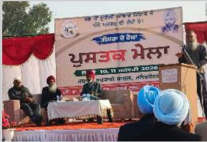
ਮੇਲੇ ਦੇ ਵਾਤਾਵਰਣ ਨੂੰ ਹੋਰ ਵੀ ਕਾਲਜਾਂ ਦੇ ਵਿਦਿਆਰਥੀਆਂ ਦੀ ਲਾਹੇਵੰਦ ਬਣਾਇਆ। ਸਕੂਲਾਂ ਅਤੇ ਸਰਗਰਮ ਭਾਗੀਦਾਰੀ ਨੇ ਇਹ

ਬਣਿਆ। ਮੇਲੇ ਵਿੱਚ ਪੰਜਾਬੀ ਸਾਹਿਤ, ਕਵਿਤਾ, ਕਹਾਣੀ, ਇਤਿਹਾਸ, ਸਿੱਖਿਆ, ਧਰਮ ਅਤੇ ਆਧੁਨਿਕ ਵਿਚਾਰਧਾਰਾ ਨਾਲ ਸੰਬੰਧਿਤ ਕਿਤਾਬਾਂ ਦੀ ਵਿਸ਼ਾਲ ਪ੍ਰਦਰਸ਼ਨੀ ਲਗਾਈ ਗਈ। ਵੱਖ-ਵੱਖ ਪ੍ਰਕਾਰਾਂ ਅਤੇ ਪੁਸਤਕ ਵਿਕਰੇਤਾਵਾਂ ਨੇ ਆਪਣੇ ਸਟਾਲ ਲਗਾਏ। ਕਿਤਾਬ ਮੇਲੇ ਦੌਰਾਨ ਸਾਹਿਤਕ ਚਰਚਾਵਾਂ, ਕਵੀ ਦਰਬਾਰ, ਪੁਸਤਕਾਂ ਦਾ ਲੋਕ-ਅਰਪਣ ਅਤੇ ਪਾਠਕਾਂ-ਲੇਖਕਾਂ ਦਰਮਿਆਨ ਰੁਬਰੂ ਵਰਗੇ ਪ੍ਰੋਗਰਾਮ ਆਯੋਜਿਤ ਕੀਤੇ ਗਏ, ਜਿਨ੍ਹਾਂ ਨੇ