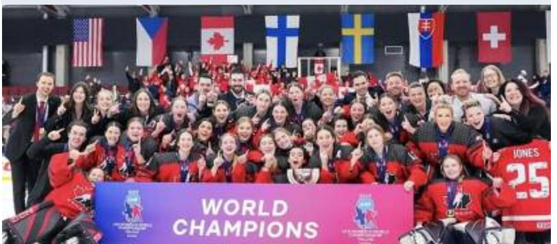
ਜੇਤੂ ਟੀਮ ਵੀ ਇੱਕ ਤਸਵੀਰ

ਵੈਨਕੂਵਰ, (ਮਲਕੀਤ ਸਿੰਘ) ਅੰਡਰ-18 ਵਿਸ਼ਵ ਮਹਿਲਾ ਹਾਕੀ ਚੈਂਪੀਅਨਸ਼ਿਪ ਦੇ ਕੌਮਾਂਤਰੀ ਪੱਧਰ ਦੇ ਮੁਕਾਬਲੇ ਵਿੱਚ ਕੈਨੇਡਾ ਦੀ ਮਹਿਲਾ ਟੀਮ ਨੇ ਸ਼ਾਨਦਾਰ ਪ੍ਰਦਰਸ਼ਨ ਕਰਦਿਆਂ ਹੰਗਰੀ ਦੀ ਟੀਮ ਨੂੰ 14-0 ਨਾਲ ਕਰਾਰੀ ਹਾਰ ਦੇ ਕੇ ਸ਼ਾਨਦਾਰ ਜਿੱਤ ਪ੍ਰਾਪਤ ਕੀਤੀ। ਇਹ ਮੈਚ ਨੇਵਾ ਸਕੋਸ਼ੀਆ ਦੇ ਸਿਡਨੀ ਸ਼ਹਿਰ ਵਿੱਚ ਖੇਡਿਆ ਗਿਆ। ਕੈਨੇਡਾ ਦੀ ਟੀਮ ਦੀ ਅਗਵਾਈ ਕਰ ਰਹੀ ਕਪਤਾਨ