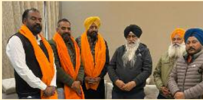
ਹਨਲ ਉਹਨਾਂ ਇਸ ਮੌਕੇ ਅਪੀਲ ਕੀਤੀ ਕੇ ਆਪਣੇ ਬੱਚਿਆਂ ਦੇ ਮਾਪਿਆਂ ਨੂੰ ਵੀ ਬੱਚਿਆਂ ਨੂੰ ਖੇਡਾਂ ਵੱਲ ਪ੍ਰੇਰਿਤ

ਸ਼ਿਕਾਰ ਹੋ ਕੇ ਨਸ਼ਿਆਂ ਦੀ ਦਲ-ਦਲ ਵਿੱਚ ਫਸ ਕੇ ਆਪਣੀ ਜਵਾਨੀ ਦਾ ਘਾਣ ਕਰ ਰਹੇ ਹਨ ਉਹਨਾਂ ਨੌਜਵਾਨਾਂ ਨੂੰ ਨਸ਼ਿਆਂ ਦਾ ਤਿਆਗ ਕਰ ਕੇ ਖੇਡਾਂ ਵੱਲ ਧਿਆਨ ਦੇਣਾ ਚਾਹੀਦਾ ਹੈ। ਉਹਨਾਂ ਕਿਹਾ ਕਿ ਇਲਾਕੇ ਵਿੱਚ ਬਹੁਤ ਸਾਰੀਆਂ ਸਮਾਜ ਸੇਵੀ ਸੰਸਥਾਵਾਂ ਨੌਜਵਾਨਾਂ ਨੂੰ ਸਹੀ ਸੇਧ ਦੇ ਕੇ ਖੇਡਾਂ ਵੱਲ ਰੁਝਾਨ ਪੈਦਾ ਕਰ ਰਹੀਆਂ