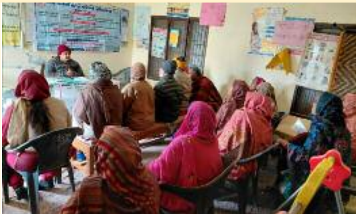
ਨਸ਼ੇ ਤਿਆਗ ਕੇ ਚੰਗੇ ਕੰਮ ਕਰਨ ਲਈ ਪ੍ਰੇਰਿਤ ਕੀਤਾ ਗਿਆ ਤਾਂ ਜੋ ਨਸ਼ਾ ਮੁਕਤ ਤੇ ਤੰਦਰੁਸਤ ਸਮਾਜ ਦੀ ਸਿਰਜਣਾ ਹੋ ਸਕੇ। ਇਸ ਦੌਰਾਨ ਨਾਲਸਾ (ਡਰੱਗ ਜਾਗਰੂਕਤਾ ਅਤੇ ਤੰਦਰੁਸਤੀ

ਨੌਜਵਾਨਾਂ ਨੂੰ ਨਸ਼ਿਆਂ ਤੋਂ ਦੂਰ ਰੱਖਣ ਅਤੇ ਹੋਰਨਾਂ ਸਕੀਮਾਂ ਸਬੰਧੀ ਜਾਗਰੂਕ ਕਰਨ ਲਈ ਵੱਖ-ਵੱਖ ਪਿੰਡਾਂ ਅਤੇ ਸਕੂਲਾਂ, ਜਿਵੇਂ ਕਿ ਗ੍ਰਾਮ ਪੰਚਾਇਤ ਸਹੋਤਾ, ਗ੍ਰਾਮ ਪੰਚਾਇਤ ਰਵਿਦਾਸ ਨਗਰ ਆਦਮਵਾਲ, ਗ੍ਰਾਮ ਪੰਚਾਇਤ ਰਹੀਸੀਵਾਲ, ਗ੍ਰਾਮ ਪੰਚਾਇਤ ਗਾਂਦੀਵਾਲ, ਗ੍ਰਾਮ ਪੰਚਾਇਤ ਮੰਝਪੁਰ, ਗ੍ਰਾਮ ਪੰਚਾਇਤ ਮੀਰਪੁਰ ਅਤੇ ਓਟ ਕਲੀਨਿਕ ਸ਼ਾਮ ਚੁਰਾਸੀ ਵਿਖੇ ਜਾਗਰੂਕਤਾ ਪ੍ਰੋਗਰਾਮਾਂ ਦਾ ਆਯੋਜਨ ਕੀਤਾ ਗਿਆ। ਇਸ ਮੌਕੇ ਪੈਨਲ ਐਡਵੋਕੇਟਾਂ ਵੱਲੋਂ ਨੌਜਵਾਨ ਪੀੜ੍ਹੀ ਨੂੰ