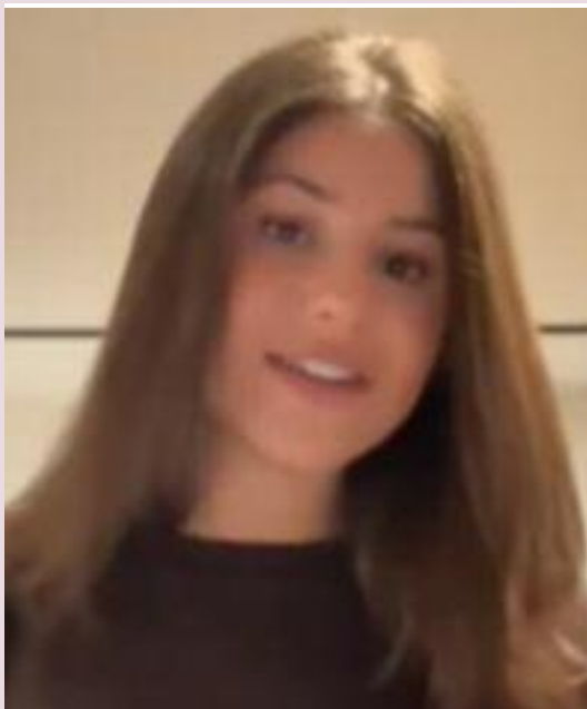
ਮ੍ਰਿਤਕ ਲੜਕੀ ਦੀ ਫਾਈਲ ਫੋਟੋ।

ਸਵਿਸ ਅਧਿਕਾਰੀਆਂ ਮੁਤਾਬਕ ਇਸ ਅੱਗ ਕਾਂਡ ਵਿੱਚ ਹੋਰ ਵੀ ਕਈ ਲੋਕਾਂ ਦੀ ਜਾਨ ਜਾਣ ਦੀ