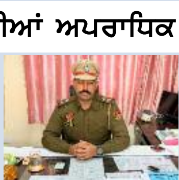
ਗਿਣਤੀ ਵਿੱਚ ਪ੍ਰਵਾਸੀ ਵੱਖ ਵੱਖ ਕੰਮ ਧੰਦੇ ਕਰ ਰਹੇ ਹਨ ਪ੍ਰੰਤੂ ਇਹਨਾਂ ਪ੍ਰਵਾਸੀਆਂ ਵਿੱਚੋਂ ਕਿੰਨਿਆਂ ਦੀ ਵੈਰੀਫਿਕੇਸ਼ਨ ਹੋਈ ਜਾਂ ਫਿਰ ਕਿੰਨਿਆਂ ਦੇ ਘਰੇਲੂ ਪਤੇ ਦੇ ਸਬੂਤ ਪੁਲਿਸ ਕੋਲ ਜਮਾਂ ਹੋਏ ਇਸ ਬਾਰੇ ਕੋਈ ਪੱਕੀ ਜਾਣਕਾਰੀ ਨਹੀਂ ਹੈ। ਬੀਤੇ ਦਿਨਾਂ ਤੋਂ ਵੱਖ ਵੱਖ ਥਾਈਂ ਵਾਪਰ ਰਹੀਆਂ ਚੋਰੀ

ਵੱਲੋਂ ਜ਼ਿਲ੍ਹੇ ਭਰ ਵਿੱਚ ਕਿਰਾਏਦਾਰਾਂ, ਨੌਕਰਾਂ, ਪੌਇੰਗ ਗੈਸਟਾਂ, ਨੇਪਾਲੀ ਲਾਂਗਰੀਆਂ ਆਦਿ ਦੇ ਵੇਰਵੇ ਪੁਲਿਸ ਨੂੰ ਦੇਣ ਅਤੇ ਸੜਕਾਂ ਦੇ ਕੰਢਿਆਂ ਤੇ ਸ਼ਹਿਰਾਂ ਵਿੱਚ ਪਸ਼ੂਆਂ ਨੂੰ ਚਰਾਉਣ 'ਤੇ ਰੋਕ ਲਗਾਉਣ ਦੀ ਪਾਬੰਦੀ ਦੇ ਹੁਕਮ ਜਾਰੀ ਕੀਤੇ ਗਏ ਸਨ ਪ੍ਰੰਤੂ ਆਮ ਦੇਖਣ ਵਿੱਚ ਆਇਆ ਹੈ ਕਿ ਜ਼ਿਲ੍ਹਾ ਮੈਜਿਸਟਰੇਟ ਦੇ ਇਹਨਾਂ ਹੁਕਮਾਂ ਦਾ ਕੋਈ ਬਹੁਤਾ ਅਸਰ ਦੇਖਣ ਨੂੰ ਨਹੀਂ ਮਿਲਦਾ। ਭਰੋਸੇਯੋਗ ਸੂਤਰਾਂ ਮੁਤਾਬਿਕ ਕਸਬਾ ਕਾਠਗੜ੍ਹ ਤੇ ਨਾਲ ਲੱਗਦੇ ਪਿੰਡਾਂ ਵਿੱਚ ਵੱਡੀ