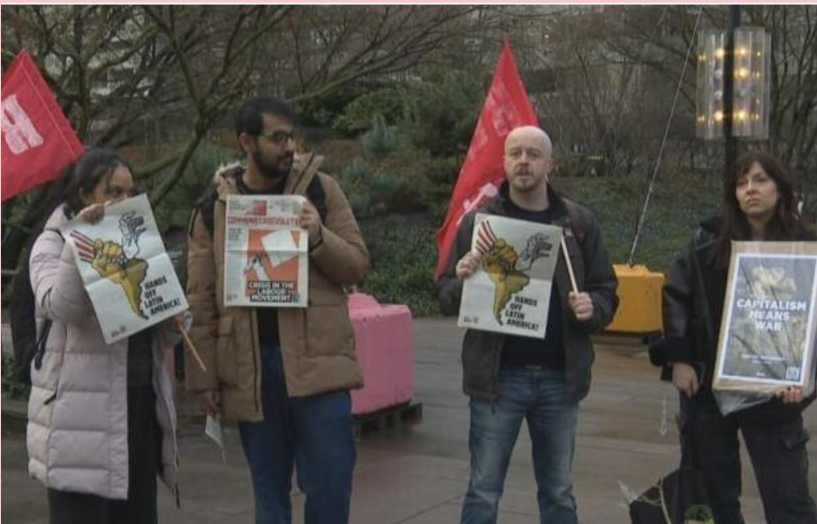
ਪ੍ਰਦਰਸ਼ਨ ਕਰ ਰਹੇ ਵੈਨੇਜ਼ੁਏਲਾ ਨਾਲ ਸੰਬੰਧਿਤ ਲੋਕ।