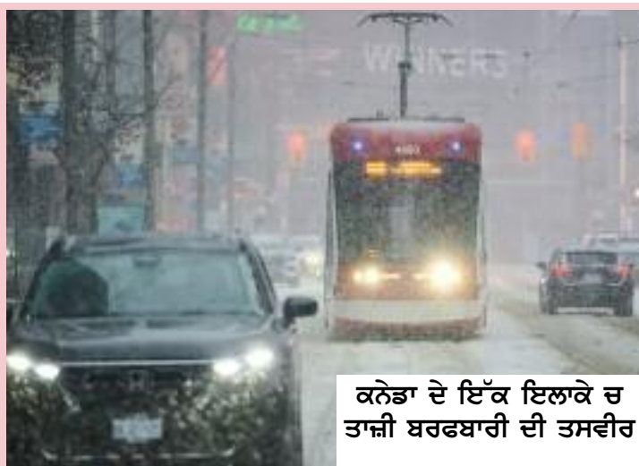
ਕੈਨੇਡਾ ਦੇ ਇੱਕ ਇਲਾਕੇ ਚ ਤਾਜ਼ੀ ਬਰਫਬਾਰੀ ਦੀ ਤਸਵੀਰ

ਕੜਾਕੇ ਦੀ ਠੰਢ ਦੀ ਗ੍ਰਿਫ਼ਤ ਵਿੱਚ ਹੈ। ਅਰਕਟਿਕ ਉੱਚ ਦਬਾਅ ਵਾਲੀ ਹਵਾ ਕਾਰਨ ਇਲਾਕੇ ਵਿੱਚ ਬਿਜਲੀ ਬੰਦ ਹੋਣ ਤਾਂ ਖਦਸ਼ਾ ਵਿੱਚ ਜਤਾਇਆ ਜਾ ਰਿਹਾ ਹੈ। ਮੌਸਮ ਵਿਭਾਗ ਅਨੁਸਾਰ ਹਲਕੀ ਹਵਾਵਾਂ ਚੱਲਣ ਨਾਲ ਬੇਹੱਦ ਠੰਢੇ ਤਾਪਮਾਨ ਮਿਲ ਕੇ ਹਵਾ ਦੀ ਠੰਢ ਦੇ ਅੰਕੜੇ ਮਾਇਨਸ 50 ਤੋਂ ਮਾਇਨਸ 55 ਡਿਗਰੀ ਸੈਲਸੀਅਸ ਤੱਕ ਲੈ ਜਾ ਸਕਦੇ ਹਨ, ਹਾਲਾਂਕਿ ਅਗਲੇ ਦਿਨਾਂ ਵਿੱਚ ਹਾਲਾਤਾਂ ਵਿੱਚ ਹੌਲੀ-ਹੌਲੀ ਸੁਧਾਰ ਦੀ ਉਮੀਦ ਜਤਾਈ ਗਈ ਹੈ। ਸਬੰਧਤ ਅਧਿਕਾਰੀਆਂ ਵੱਲੋਂ ਆਮ ਨਾਗਰਿਕਾਂ ਨੂੰ ਗੈਰ-ਜ਼ਰੂਰੀ ਯਾਤਰਾ ਤੋਂ ਗੁਰੇਜ ਕਰਨ, ਗਰਮ ਕੱਪੜੇ ਪਹਿਨਣ ਅਤੇ ਮੌਸਮ ਸੰਬੰਧੀ ਚੇਤਾਵਨੀਆਂ 'ਤੇ ਲਗਾਤਾਰ ਅਮਲ ਕਰਨ ਦਾ ਮਸ਼ਵਰਾ ਜਾਰੀ ਕੀਤਾ ਹੈ ਅਗਲੇ ਹਫਤੇ ਕੈਨੇਡਾ ਦੇ ਬ੍ਰਿਟਿਸ਼ ਕੋਲੰਬੀਆ ਦੇ ਪਹਾੜੀ ਅਤੇ ਮੈਦਾਨੀ ਇਲਾਕਿਆਂ ਚ ਵੀ ਬਰਫਬਾਰੀ ਹੋਣ ਦੀ ਭਵਿੱਖਬਾਣੀ ਕੀਤੀ ਗਈ ਹੈ।