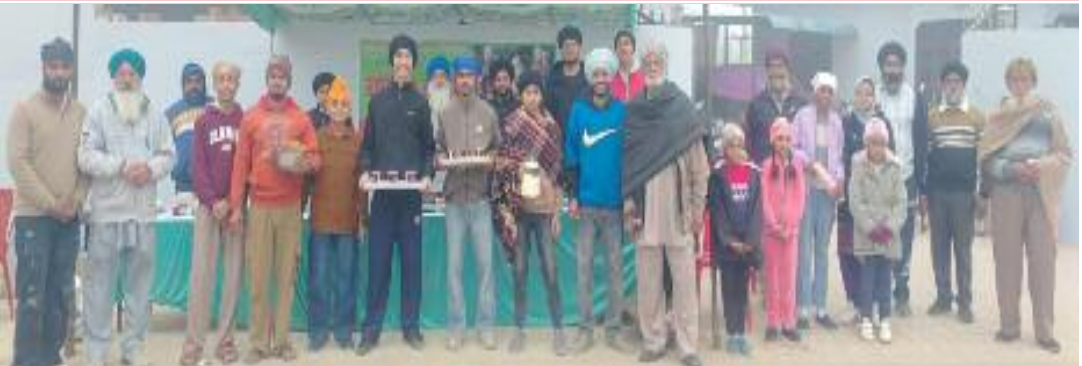
ਪਿੰਡ ਗਹੁੰਣ ਵਿਖੇ ਸ਼ਹੀਦੀ ਦਿਹਾੜੇ 'ਤੇ ਲਗਾਏ ਦੁੱਧ ਦੇ ਲੰਗਰ ਦੀ ਸੇਵਾ ਕਰਦੇ ਹੋਏ