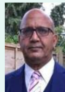
Bal Ram Sampla Bal Ram Sampla Geopolitics

bangladesh-from-dubai/2.https://www.deshkalnews.com/news/8007 3. https://www.deshkalnews.com/news/8007 4. https://www.aninews.in/news/business/india-exports-200000-tonnes-of-rice-to-bangladesh20241227130055/ 5. https://www.india.com/business/bangladesh-once-indias-close-friend-forced-to-buy-indian-goods-from-dubai-at-much-higher-prices-dhaka-uae-myanmar-rice-yunus-government-sheikh-hasina-china-pakistan-8159728/