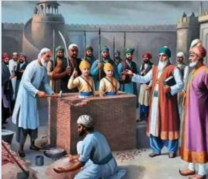
ਹੈ। ਅੱਜ ਦੇ ਮੌਜੂਦਾ ਦੌਰ ਵਿੱਚ, ਮਾਤ ਦੇ ਦਿੱਤੀ ਹੈ, ਡਰ ਨੇ ਜਦੋਂ ਸਵਾਰਥ ਨੇ ਸੰਵੇਦਨਾਵਾਂ ਨੂੰ ਆਵਾਜ਼ਾਂ ਨੂੰ ਖਾਮੋਸ਼ ਕਰ ਦਿੱਤਾ

ਪਛਾਣ ਹੈ। ਅੱਜ ਜਦੋਂ ਸਮਾਜ ਨੈਤਿਕ ਪਤਨ ਵੱਲ ਵਧ ਰਿਹਾ ਹੈ ਤਾਂ ਸਾਹਿਬਜ਼ਾਦਿਆਂ ਦੀ ਸ਼ਹਾਦਤ ਸਾਨੂੰ ਯਾਦ ਦਿਵਾਉਂਦੀ ਹੈ ਕਿ ਕੁਰਬਾਨੀ, ਦਲੇਰੀ ਅਤੇ ਸੱਚਾਈ ਨਾਲ ਹੀ ਇਕ ਸੁਚੱਜੇ ਮਨੁੱਖੀ ਸਮਾਜ ਦੀ ਨੀਂਹ ਰੱਖੀ ਜਾ ਸਕਦੀ ਹੈ।