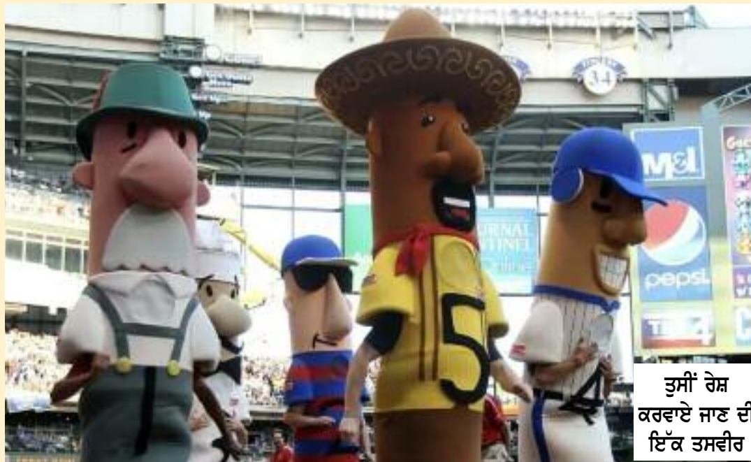
ਤੁਸੀਂ ਰੇਸ ਕਰਵਾਏ ਜਾਣ ਦੀ ਇੱਕ ਤਸਵੀਰ

ਹੈ। ਦਰਸ਼ਕਾਂ ਵਿਚਕਾਰ ਇਸ ਦੀ ਲੋਕਪ੍ਰਿਯਤਾ ਇੰਨੀ ਵਧ ਗਈ ਹੈ ਕਿ ਕਈ ਪਰਿਵਾਰ ਖਾਸ ਤੌਰ 'ਤੇ ਇਸ ਦ੍ਰਿਸ਼ ਨੂੰ ਦੇਖਣ ਲਈ ਮੈਚਾਂ ਵਿੱਚ ਸ਼ਾਮਲ ਹੁੰਦੇ ਹਨ। ਖੇਡ ਪ੍ਰਬੰਧਕਾਂ ਦਾ ਕਹਿਣਾ ਹੈ ਕਿ ਇਹ ਅਨੋਖਾ ਆਈਡੀਆ ਮੈਚ ਦੇ ਮਾਹੌਲ ਨੂੰ ਹਲਕਾ-ਫੁਲਕਾ ਬਣਾਉਂਦਾ ਹੈ ਅਤੇ ਨਵੇਂ ਦਰਸ਼ਕਾਂ ਨੂੰ ਵੀ ਸਟੇਡੀਅਮ ਵੱਲ ਆਕਰਸ਼ਿਤ ਕਰਦਾ ਹੈ। ਇਸ ਕਾਰਨ ਸੁਸ਼ੀ ਰੇਸ ਹੁਣ ਵੈਨਕੂਵਰ ਦੇ ਖੇਡ ਜਗਤ ਦਾ ਅਹਿਮ ਅੰਗ ਬਣ ਚੁੱਕੀ ਮਹਿਸੂਸ ਹੁੰਦੀ ਹੈ।