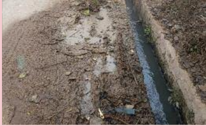
ਕਾਠਗੜ੍ਹ 'ਚ ਗੰਦੇ ਪਾਣੀ ਦੇ ਨਿਕਾਸੀ ਨਾਲੇ ਕੋਲ ਸਾਫ ਪਾਣੀ ਦੀ ਹੋ ਰਹੀ ਲੀਕੇਜ਼ ਦਾ ਦ੍ਰਿਸ਼।

ਕਾਠਗੜ੍ਹ, (ਜਤਿੰਦਰ ਪਾਲ ਸਿੰਘ ਕਲੇਰ ) ਕਾਠਗੜ੍ਹ ਦੇ ਮੁੱਖ ਮਾਰਗ 'ਤੇ ਪੈਂਦੀ ਮਾਰਕੀਟ ਵਿੱਚ ਸਥਿਤ ਚਾਹਲ ਮੈਡੀਕਲ ਸਟੋਰ ਦੇ ਸਾਹਮਣੇ ਮੁੱਖ ਮਾਰਗ ਦੇ ਨਾਲ-ਨਾਲ ਜਾਂਦੇ ਗੰਦੇ ਪਾਣੀ ਦੇ ਨਿਕਾਸੀ ਨਾਲੇ ਦੇ ਕੋਲੋਂ ਲੰਘਦੀ ਪੀਣ ਵਾਲੇ ਸਾਫ ਪਾਣੀ ਦੀ ਪਾਈਪ ਕਾਫੀ ਸਮੇਂ ਤੋਂ ਲੀਕ ਹੋ ਰਹੀ ਹੈ ਪਰੰਤੂ ਇਸ ਲੀਕੇਜ਼ ਨੂੰ ਠੀਕ ਨਾ ਕੀਤਾ ਜਾਣ ਕਾਰਨ ਪੀਣ ਵਾਲਾ ਪਾਣੀ ਵੀ