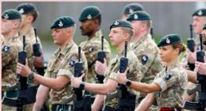
ਨੌਜਵਾਨਾਂ ਵਿੱਚ ਫੌਜ ਪ੍ਰਤੀ ਰੁਚੀ ਵਧੇਗੀ ਅਤੇ ਉਹ ਭਵਿੱਖ ਵਿੱਚ ਪੱਕੀ ਭਰਤੀ ਵੱਲ ਕਦਮ ਵਧਾ ਸਕਣਗੇ। ਫੌਜੀ ਅਧਿਕਾਰੀਆਂ ਦਾ ਕਹਿਣਾ ਹੈ ਕਿ ਬਦਲਦੇ ਸਮਾਜਕ ਹਾਲਾਤਾਂ ਅਤੇ ਨੌਜਵਾਨਾਂ ਦੀ ਸੋਚ

ਹਾਸਲ ਕਰ ਸਕਣਗੇ। ਸਰਕਾਰੀ ਸੂਤਰਾਂ ਮੁਤਾਬਕ ਇਹ ਯੋਜਨਾ ਮੁੱਖ ਤੌਰ 'ਤੇ 25 ਸਾਲ ਤੋਂ ਘੱਟ ਉਮਰ ਦੇ ਨੌਜਵਾਨਾਂ ਨੂੰ ਧਿਆਨ ਵਿੱਚ ਰੱਖ ਕੇ ਤਿਆਰ ਕੀਤੀ ਗਈ ਹੈ। ਇਸ ਸਕੀਮ ਤਹਿਤ ਨੌਜਵਾਨ ਕੁਝ ਮਹੀਨਿਆਂ ਜਾਂ ਇੱਕ ਨਿਰਧਾਰਤ ਸਮੇਂ ਲਈ ਬਰਤਾਨਵੀ ਫੌਜ ਦੇ ਵੱਖ-ਵੱਖ ਹਿੱਸਿਆਂ ਨਾਲ ਜੁੜ ਕੇ ਟ੍ਰੇਨਿੰਗ, ਅਨੁਸ਼ਾਸਨ ਅਤੇ ਫੌਜੀ ਜੀਵਨ ਦੀ ਕਾਰਗੁਜ਼ਾਰੀ ਨੂੰ ਨੇੜਿਓਂ ਸਮਝ ਸਕਣਗੇ। ਸਰਕਾਰ ਦਾ ਮੰਨਣਾ ਹੈ ਕਿ ਇਸ ਨਾਲ