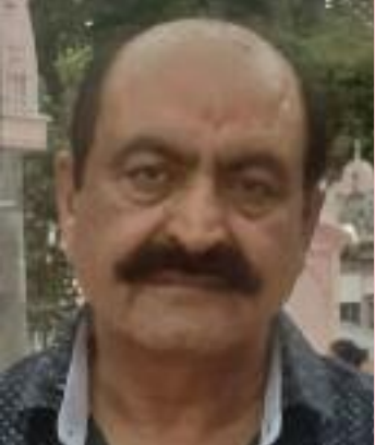
ਤੱਕ ਵਾਪਸ ਨਹੀ ਪਰਤਿਆ। ਉਸਦੇ ਘਰਦਿਆਂ ਵਲੋਂ ਉਸਦੇ ਮੋਬਾਇਲ ਫੋਨ ਤੇ ਵਾਰ ਵਾਰ ਫੋਨ ਕੀਤਾ ਗਿਆ ਲੇਕਿਨ ਉਨ੍ਹਾਂ ਦਾ ਫੋਨ ਸਵਿੱਚ ਆਫ ਆ ਰਿਹਾ