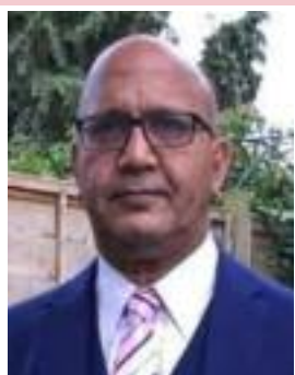
Bal Ram Sampla Geopolitics