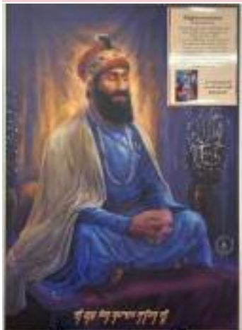
THE ASIAN INDEPENDENT UK