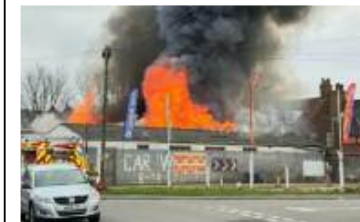
ਭਿਆਨਕ ਅੱਗ ਦਾ ਦ੍ਰਿਸ਼।

ਲੈਸਟਰ (ਇੰਗਲੈਂਡ) (ਸੁਖਜਿੰਦਰ ਸਿੰਘ ਵੱਡੇ)- ਇੰਗਲੈਂਡ ਦੇ ਸਮੁੰਦਰੀ ਸ਼ਹਿਰ ਸਕੈਗਨੇਸ ਵਿੱਚ ਅਚਾਨਕ ਲੱਗੀ ਭਿਆਨਕ ਅੱਗ ਨੇ ਪੂਰੇ ਇਲਾਕੇ ਵਿੱਚ ਹੜਕੰਪ ਮਚਾ ਦਿੱਤਾ। ਅੱਗ ਇੰਨੀ ਤੇਜ਼ ਸੀ ਕਿ ਨੇੜਲੇ ਘਰਾਂ ਅਤੇ ਕਾਰੋਬਾਰਾਂ ਨੂੰ ਤੁਰੰਤ ਖਾਲੀ ਕਰਵਾਉਣਾ ਪਿਆ। ਲੋਕ ਜਾਨ ਬਚਾਉਣ ਲਈ ਘਰਾਂ ਤੋਂ ਬਾਹਰ ਨਿਕਲ ਆਏ, ਜਦਕਿ ਦੂਰ ਤੱਕ ਕਾਲੇ ਧੂੰਏਂ ਦੇ ਗੁਬਾਰ ਨਜ਼ਰ ਆਉਂਦੇ ਰਹੇ। ਇੱਕ ਨਸ਼ਾਇਰ ਫਾਇਰ ਐਂਡ ਰੈਸਕਿਊ ਸਰਵਿਸ ਮੁਤਾਬਕ ਓਲਡ ਵੇਨਫਲੀਟ ਰੋਡ 'ਤੇ ਵੱਡੇ ਪੱਧਰ ਦੀ ਘਟਨਾ ਨਾਲ ਨਿਪਟਣ ਲਈ ਕਈ ਫਾਇਰ ਬ੍ਰਿਗੇਡ ਗੱਡੀਆਂ ਮੌਕੇ 'ਤੇ ਤਾਇਨਾਤ ਕੀਤੀਆਂ ਗਈਆਂ। ਅੱਗ ਦੀ ਲਪੇਟ 'ਚ