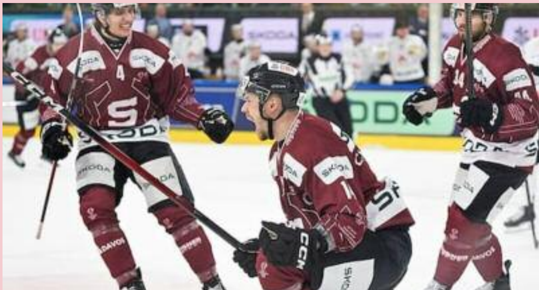
ਕਨੇਡਾ ਦੀ ਹੱਕ ਕੀ ਟੀਮ ਦੀ ਇੱਕ ਤਸਵੀਰ।