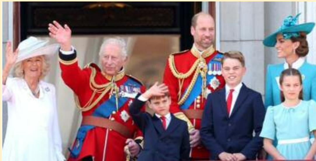
ਬਰਤਾਨਵੀ ਰਾਜਘਰਾਣੇ ਦੇ ਪਰਿਵਾਰਿਕ ਮੈਂਬਰ ਇਕ ਗਰੁੱਪ ਫੋਟੋ ਮੌਕੇ।

ਲੈਸਟਰ (ਇੰਗਲੈਂਡ), (ਸੁਖਜਿੰਦਰ ਸਿੰਘ ਢੱਡੇ) ਬਰਤਾਨੀਆ ਦਾ ਰਾਜਘਰਾਨਾ ਇਸ ਸਾਲ ਕਈ ਵੱਡੀਆਂ ਘਟਨਾਵਾਂ ਅਤੇ ਵਿਵਾਦਾਂ ਕਾਰਨ ਚਰਚਾ ਦੇ ਕੇਂਦਰ ਵਿੱਚ ਰਿਹਾ। ਇੱਕ ਪਾਸੇ ਜਿੱਥੇ ਰਾਜਸੀ ਪਰਿਵਾਰ ਦੇ ਕੁਝ ਮੈਂਬਰਾਂ ਨਾਲ ਜੁੜੀਆਂ ਨਿੱਜੀ ਸਿਹਤ ਸੰਬੰਧੀ ਖ਼ਬਰਾਂ ਨੇ ਲੋਕਾਂ ਨੂੰ ਭਾਵੁਕ ਕੀਤਾ, ਉੱਥੇ ਹੀ ਦੂਜੇ ਪਾਸੇ ਪੁਰਾਣੇ ਵਿਵਾਦਾਂ ਨੇ ਮੁੜ ਸਿਰ ਚੁੱਕ ਕੇ ਰਾਜਘਰਾਨੇ ਦੀ ਸਾਖ 'ਤੇ ਸਵਾਲ ਖੜੇ ਕੀਤੇ। ਰਾਜਘਰਾਨੇ ਨਾਲ ਜੁੜੇ ਸੂਤਰਾਂ ਮੁਤਾਬਕ, ਸਾਲ 2025 ਦੀ ਸ਼ੁਰੂਆਤ ਦੌਰਾਨ ਇੱਕ ਮਹੱਤਵਪੂਰਨ ਮਹਿਲਾ ਮੈਂਬਰ ਦੀ ਸਿਹਤ ਵਿੱਚ ਸੁਧਾਰ ਦੀ ਖ਼ਬਰ ਨੇ ਦੇਸ਼ ਭਰ ਵਿੱਚ ਸੁਕੂਨ ਦੀ ਸਾਹ ਲਿਆਈ। ਲੰਮੇ ਇਲਾਜ ਤੋਂ ਬਾਅਦ ਉਨ੍ਹਾਂ ਦੀ ਸਿਹਤ ਸੰਭਲਣ ਦੀ ਜਾਣਕਾਰੀ ਨੂੰ ਬਰਤਾਨੀਆ ਹੀ ਨਹੀਂ, ਸਗੋਂ ਵਿਦੇਸ਼ਾਂ ਵਿੱਚ ਵੀ ਖੁਸ਼ੀ ਨਾਲ ਸਵੀਕਾਰਿਆ ਗਿਆ। ਲੋਕਾਂ ਵੱਲੋਂ ਸੋਸ਼ਲ ਮੀਡੀਆ ਰਾਹੀਂ ਹਮਦਰਦੀ ਅਤੇ ਦੁਆਵਾਂ ਦੇ ਸੁਨੇਹੇ ਭੇਜੇ ਗਏ।