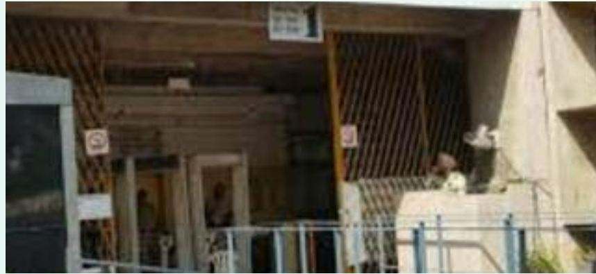
ਉਨ੍ਹਾਂ ਵਿਰੁੱਧ ਐਫ.ਆਈ.ਆਰ. (ਫੀ) ਸਹਿਯੋਗ ਲਈ ਤਿਆਰ: ਉਨ੍ਹਾਂ ਕਿਹਾ ਕਿ ਉਹ ਜਾਂਚ ਏਜੰਸੀਆਂ ਨੂੰ ਹਰ ਤਰ੍ਹਾਂ