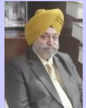
ਸਾਬਕਾ ਏ ਐਸ ਪੀ (ਰਾਸ਼ਟਰਪਤੀ ਤੋਂ ਐਵਾਰਡ ਪ੍ਰਾਪਤ) ਸੰਸ. ਅਤੇ ਪ੍ਰਧਾਨ ਲੇਖਕ ਪਾਠਕ ਸਾਹਿਤ ਸਭਾ ਰਜਿ ਬਰਨਾਲਾ।

ਇਸ ਤੋਂ ਇਲਾਵਾ ਪੁਸਤਕ ਵਿਚ ਦੋ ਗਜ਼ਲਾਂ ਸਭ ਤੋਂ ਛੋਟੀ ਬਹਿਰ ਵਿਚ ਮਿਲਦੀਆਂ ਹਨ ਜਿਵੇਂ ਕਿ ਦਿਲ ਦੇ ਜਾਨੀ, ਮੰਗਦੇ ਗਈ ਅਤੇ ਪੀੜ ਪਰਾਈ, ਸੀਨੇ ਲਾਈ। ਆਦਿ। ਪੁਸਤਕ ਦਾ ਪਾਠ ਕਰਦਿਆਂ ਮੈਨੂੰ ਲੱਗਿਆ ਕਿ ਗਜ਼ਲਾਂ ਖੂਬਸੂਰਤੀ ਨਾਲ ਪੇਸ਼ ਕੀਤੀਆਂ ਹਨ ਪਰ ਫਿਰ ਵੀ ਇਸ ਗਜ਼ਲਕਾਰ ਨੂੰ ਅਜੇ ਹੋਰ ਮਿਹਨਤ ਦੀ ਲੋੜ ਹੈ। ਪਲੇਠੀ ਮੌਲਿਕ ਪੁਸਤਕ ਹੋਣ ਕਾਰਨ ਇਸ ਨੂੰ ਖੁਸ਼ ਆਮਦੀਦ ਆਖਣਾ ਬਣਦਾ ਹੈ।