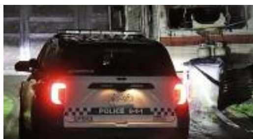
ਪੁਲਿਸ ਦੀ ਗੱਡੀ ਨੇੜੇ ਖੜਾ ਹਾਦਸਾ ਗ੍ਰਸਤ ਵਾਹਨ

ਦੁਖਦਾਈ ਸੂਚਨਾ ਮਿਲੀ ਹੈ। ਜਾਣਕਾਰੀ ਅਨੁਸਾਰ ਪੁਲਿਸ ਨੂੰ ਰਾਤ ਕਰੀਬ 9 ਵਜੇ 12200 ਬਲਾਕ, 102 ਐਵੇਨਿਊ 'ਤੇ ਇੱਕ ਆਰਵੀ ਟ੍ਰੇਲਰ ਨੂੰ ਅੱਗ ਲੱਗਣ ਦੀ ਘਟਨਾ ਬਾਰੇ ਸੂਚਨਾ ਮਿਲੀ ਜਿਸ ਉਪਰੰਤ ਮੌਕੇ ਤੇ ਪੁੱਜੇ ਪੁਲਿਸ