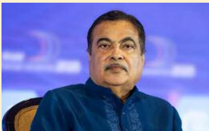
2026 ਦੇ ਅੰਤ ਤੱਕ ਦੇਸ਼ ਭਰ ਵਿੱਚ ਲਾਗੂ ਕੀਤਾ ਜਾਵੇਗਾ। ਇਹ ਤਕਨਾਲੋਜੀ, AI ਅਤੇ FastTag ਨੂੰ ਨੰਬਰ

ਕਰਨੀ ਪਵੇਗੀ। ਕੇਂਦਰੀ ਮੰਤਰੀ ਨੇ ਕਿਹਾ ਕਿ ਇਹ ਨਵੀਂ ਤਕਨੀਕ ਆਰ ਟੀ ਫੀ ਸੀ ਅਲ ਇੰਟੈਲੀਜੈਂਸ (AI) 'ਤੇ ਆਧਾਰਤ ਹੋਵੇਗੀ, ਜਿਸ ਨਾਲ 1,500 ਕਰੋੜ ਰੁਪਏ ਦੇ ਟੋਲ ਦੀ ਬਚਤ ਹੋਵੇਗੀ ਅਤੇ ਸਰਕਾਰੀ ਮਾਲੀਏ ਵਿੱਚ 6,000 ਕਰੋੜ ਰੁਪਏ ਦਾ ਵਾਧਾ ਹੋਵੇਗਾ। ਗਡਕਰੀ ਨੇ ਸਦਨ ਵਿੱਚ ਕਿਹਾ, “AI-ਸੰਚਾਲਿਤ ਮਲਟੀ-ਲੇਨ ਫ੍ਰੀ ਫਲੋ (MLFF) ਟੋਲ ਸਿਸਟਮ