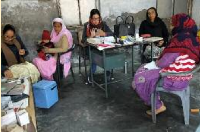
ਫੋਲਿਕ ਐਸਿਡ ਦੀਆਂ ਗੋਲੀਆਂ ਲੈਣ ਦੀ ਅਪੀਲ ਕੀਤੀ ਗਈ। ਇਸ ਮੌਕੇ ਸਿਹਤ ਵਿਭਾਗ ਦੇ ਕਰਮਚਾਰੀਆਂ ਵੱਲੋਂ ਹਾਜ਼ਰ

ਮਨਾਇਆ ਗਿਆ। ਉਨ੍ਹਾਂ ਦੱਸਿਆ ਕਿ ਇਸ ਮੌਕੇ ਗਰਭਵਤੀ ਮਹਿਲਾਵਾਂ, ਦੁੱਧ ਪਿਲਾਉਣ ਵਾਲੀਆਂ ਮਾਵਾਂ ਅਤੇ ਕਿਸ਼ੋਰੀਆਂ ਨੂੰ ਅਨੀਮੀਆ ਬਾਰੇ ਵਿਸਥਾਰ ਨਾਲ ਜਾਣਕਾਰੀ ਦਿੱਤੀ ਗਈ। ਆਂਗਣਵਾੜੀ ਵਰਕਰਾਂ ਵੱਲੋਂ ਅਨੀਮੀਆ ਦੇ ਕਾਰਨ, ਲੱਛਣ ਅਤੇ ਬਚਾਅ ਦੇ ਉਪਾਅ ਸਮਝਾਏ ਗਏ। ਇਸ ਦੇ ਨਾਲ ਹੀ ਲੋਹੇ ਨਾਲ ਭਰਪੂਰ ਖੁਰਾਕ ਜਿਵੇਂ ਹਰੀਆਂ ਸਬਜ਼ੀਆਂ, ਦਾਲਾਂ, ਗੁੜ, ਚੁੱਕੰਦਰ ਆਦਿ ਖਾਣ ਲਈ ਪ੍ਰੇਰਿਤ ਕੀਤਾ ਗਿਆ ਅਤੇ ਨਿਯਮਿਤ ਤੌਰ 'ਤੇ ਆਇਰਨ-