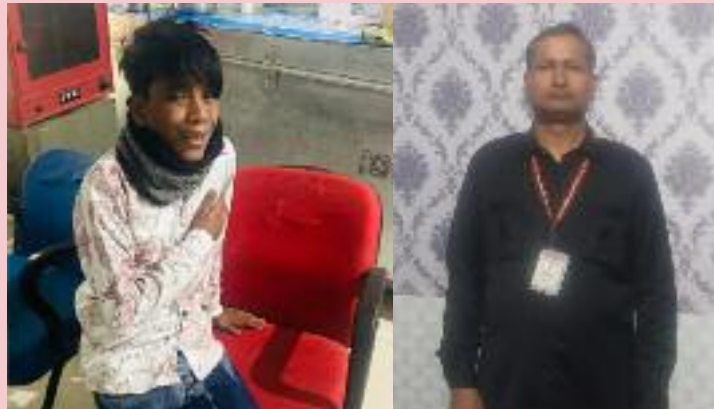
ਹਜ਼ਾਰ ਰੁਪਏ ਦੀ ਰਕਮ ਚੋਰੀ ਕਰ ਲਈ ਅਤੇ ਆਪਣੇ ਸਾਥੀ ਨਾਲ ਬਾਈਕ ਤੇ ਫਰਾਰ ਹੋ ਗਿਆ। ਇਹ ਘਟਨਾ ਬੈਂਕ ਵਿਚ ਲੱਗੇ ਕੈਮਰਿਆਂ ਵਿਚ ਰਿਕਾਰਡ ਹੋ ਗਈ। ਅੱਜ ਫਿਰ ਇਹੀ