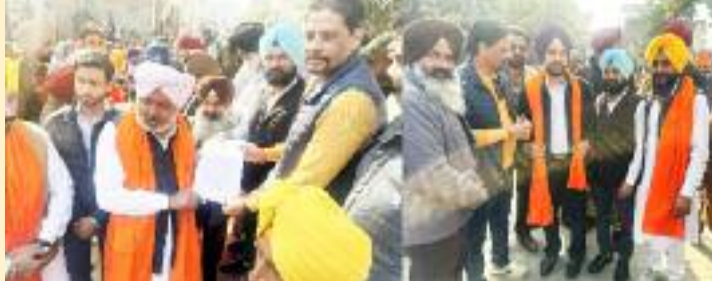
ਵੱਲੋਂ ਇੱਕ ਫਾਈਲ ਸਿਹਤ ਵਿਭਾਗ ਪੰਜਾਬ ਦੇ ਰਾਹੀਂ ਪੰਜਾਬ ਸਰਕਾਰ ਪਾਸ ਭੇਜੀ ਗਈ ਹੈ, ਇਸ ਤੋਂ ਇਲਾਵਾ ਜਥੇਬੰਦੀ ਸਿਹਤ ਮੰਤਰੀ ਪੰਜਾਬ ਡਾ ਬਲਵੀਰ ਸਿੰਘ ਨੂੰ ਵੀ ਮੰਗ