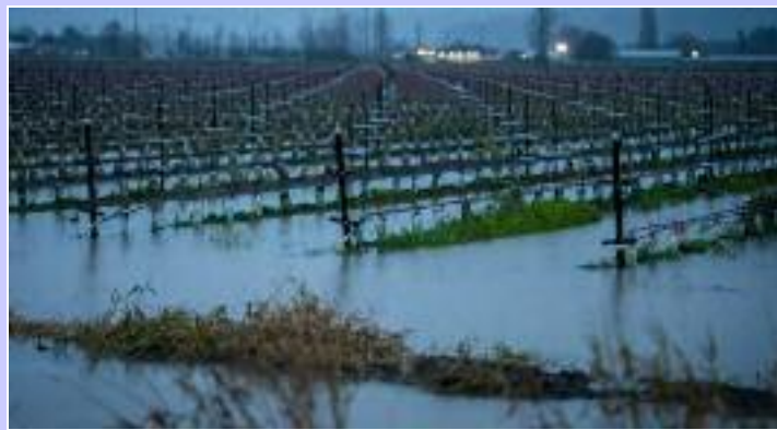
ਫਰੇਜ਼ਰ ਵੈਲੀ ਇਲਾਕੇ ਦੇ ਖੇਤਰਾਂ ਚ ਇਕੱਤਰ ਮੀਂਹ ਦਾ ਪਾਣੀ।

ਵੈਨਕੂਵਰ (ਮਲਕੀਤ ਸਿੰਘ) - ਕਨੇਡਾ ਦੇ ਬ੍ਰਿਟਿਸ਼ ਕੋਲੰਬੀਆ ਸੂਬੇ ਦੇ ਫਰੇਜ਼ਰ ਵੈਲੀ ਪਹਾੜੀ ਖੇਤਰ ਚ ਪਿਛਲੇ ਦੋ ਹਫ਼ਤੇ ਤੋਂ ਲਗਾਤਾਰ ਪੈ ਰਹੀ ਹਲਕੀ ਤੋਂ ਦਰਮਿਆਨੀ ਬਾਰਸ਼ ਕਾਰਨ ਦਰਿਆਈ ਖੇਤਰਾਂ ਚ ਪਾਣੀ ਦਾ ਪੱਧਰ ਵਧਣਾ ਲਗਾਤਾਰ ਜਾਰੀ ਹੈ ਜਿਸ ਦੇ ਮੱਦੇ ਨਜ਼ਰ ਪ੍ਰਸ਼ਾਸਨ ਵੱਲੋਂ ਨੀਵੇਂ ਥਾਂ ਤੇ ਬਣੇ ਕੁਝ ਘਰਾਂ ਦੇ ਪਰਿਵਾਰਾਂ ਨੂੰ ਉਥੋਂ ਸੁਰੱਖਿਅਤ ਥਾਵਾਂ ਵੱਲ ਚਲੇ ਜਾਣ ਦੀ ਹਦਾਇਤ ਜਾਰੀ ਕੀਤੀ ਗਈ ਹੈ ਹੁਣ ਤੱਕ ਪ੍ਰਾਪਤ ਤਾਜ਼ਾ ਵੇਰਵੇ ਮੁਤਾਬਕ ਪ੍ਰਸ਼ਾਸਨ ਵੱਲੋਂ ਅਜਿਹੇ ਤਕਰੀਬਨ 350 ਤੋਂ ਵੱਧ ਘਰਾਂ ਨੂੰ ਖਾਲੀ ਕਰਨ ਦੀ ਸੂਚੀ ਜਾਰੀ ਕੀਤੀ ਗਈ ਹੈ ਸਮੁੱਚੇ ਫਰੇਜ਼ਰ ਵੈਲੀ ਇਲਾਕੇ ਵਿੱਚ ਪਾਣੀ ਦੀ ਸੰਭਾਵਿਤ ਤਬਾਹੀ ਨੂੰ ਵੇਖਦਿਆਂ ਐਮਰਜੈਂਸੀ ਦਾ ਐਲਾਨ ਕਰ ਦਿੱਤਾ ਗਿਆ ਅਤੇ ਉੱਥੋਂ ਦੇ