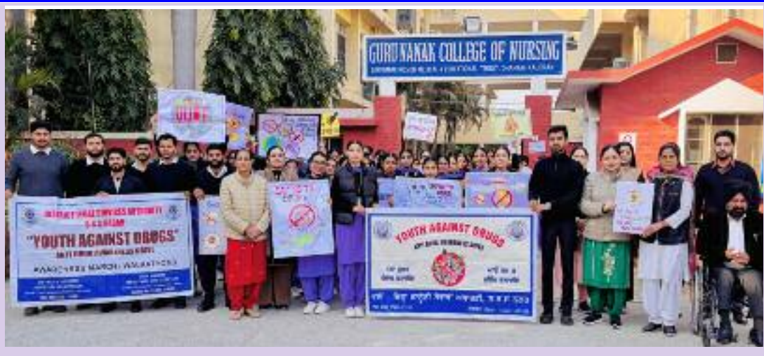
ਗੁਰੂ ਨਾਨਕ ਕਾਲਜ ਆਫ ਨਰਸਿੰਗ ਢਾਹਾਂ ਕਲੇਰਾਂ ਵਿਖੇ ਨਸ਼ਿਆਂ ਵਿਰੁੱਧ ਜਾਗਰੂਕਤਾ ਰੈਲੀ ਮੌਕੇ ਦੀ ਯਾਦਗਾਰੀ ਤਸਵੀਰ

ਜਨਵਰੀ 2026 ਤੱਕ ਚਲੇਗੀ । ਉਹਨਾਂ ਨੇ ਵਿਦਿਆਰਥੀਆਂ ਨੂੰ ਉਹਨਾਂ ਦੇ ਅਧਿਕਾਰਾਂ, ਸਿੱਖਿਆ ਦਾ ਅਧਿਕਾਰ, ਪੌਕਸੇ ਐਕਟ 2012, ਚਾਈਲਡ ਹੈਲਪ ਲਾਈਨ ਨੰਬਰ ਬਾਰੇ ਵੀ ਜਾਗਰੂਕ