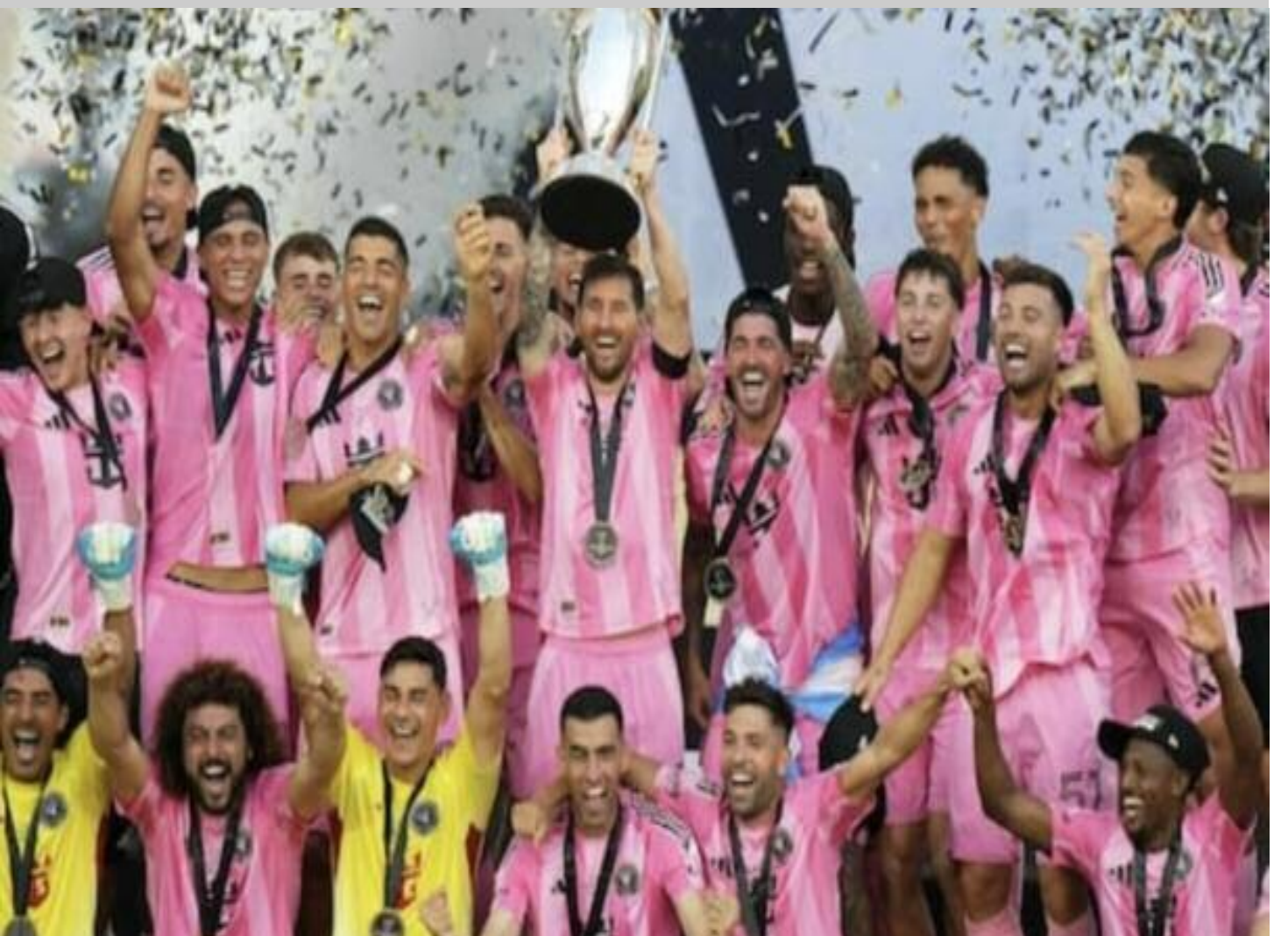
ਖੁਸ਼ੀ ਦੇ ਰੌਅ ਵਿੱਚ ਜੇਤੂ ਟੀਮ

ਲਈ ਇਸ ਟੀਮ ਵੱਲੋਂ ਪਹਿਲੇ ਹਾਫ ਦੌਰਾਨ ਦੋ ਗੋਲ ਦਰਜ ਕੀਤੇ ਗਏ ਜਦੋਂ ਕਿ ਦੂਜੇ ਹਾਫ ਵਿੱਚ ਵੈਨਕੂਵਰ ਵਾਈਟ ਕੈਪਸ ਦੀ ਟੀਮ ਵਲੋਂ ਪਲੜਾ ਬਰਾਬਰ ਕਰਨ ਦੀ ਕੀਤੀ ਗਈ ਕੋਸ਼ਿਸ਼ ਕਾਮਯਾਬ ਨਾ ਹੋ ਸਕੀ ਦੂਜੇ ਹਾਫ ਦੌਰਾਨ ਵੈਨਕੂਵਰ ਵਾਈਟ ਕੈਪਸ ਦੀ ਟੀਮ ਵਲੋਂ ਇੱਕ ਗੋਲ ਦਰਜ ਕਰਨ ਮਗਰੋਂ ਭਾਵੇਂ ਕਿ ਮੈਚ ਦਿਲਚਸਪ ਬਣਿਆ ਨਜ਼ਰੀ ਆਇਆ, ਪਰੰਤੂ ਇੰਟਰ ਮਾਈਮੀ ਦੀ ਟੀਮ ਨੇ ਅਖੀਰਲੇ ਪਲਾਂ ਵਿੱਚ ਇੱਕ ਤੀਸਰਾ ਗੋਲ ਕਰਕੇ ਮੈਚ ਨੂੰ ਪੂਰੀ ਤਰ੍ਹਾਂ ਆਪਣੇ ਪੱਖ ਵਿੱਚ ਕਰ ਲਿਆ ਮੈਚ ਦੀ ਸਮਾਪਤੀ ਉਪਰੰਤ ਜੇਤੂ ਟੀਮ ਦੇ ਖਿਡਾਰੀਆਂ, ਸਟਾਫ ਅਤੇ ਸਮਰਥਕਾਂ ਵਿੱਚ ਖੁਸ਼ੀ ਨਾਲ ਜੋਸ਼ ਭਰਿਆ ਨਜ਼ਰੀ ਆਇਆ ਇਸ ਮੌਕੇ ਤੇ ਬਹੁ ਗਿਣਤੀ ਖੇਡ ਪ੍ਰੇਮੀ ਜਿੱਤ ਦੀ ਖੁਸ਼ੀ ਚ ਝੁਮਦੇ ਨਜ਼ਰ ਆਏ।