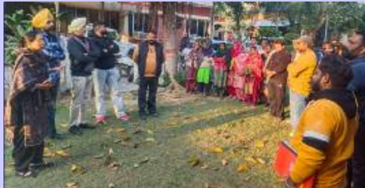
ਬਾਇਓ-ਮੈਡੀਕਲ ਕੂੜੇ ਨੂੰ ਸਿਰਫ ਅਧਿਕਾਰਤ ਏਜੰਸੀ ਨੂੰ ਹੀ ਹਵਾਲੇ ਕਰਨ ਦੇ ਜ਼ਿੰਮੇਵਾਰ ਹਨ। ਉਨ੍ਹਾਂ ਕਿਹਾ ਕਿ ਜੇਕਰ ਕੋਈ ਵੀ ਹਸਪਤਾਲ ਜਾਂ