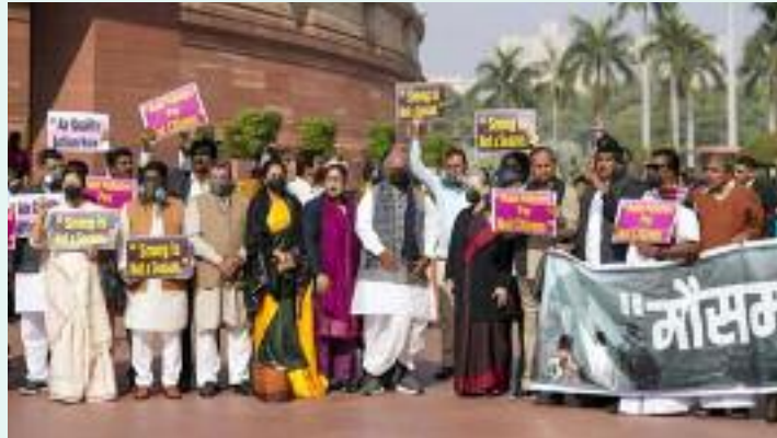
ਪ੍ਰਦੂਸ਼ਣ ਦੀ ਸਮੱਸਿਆ ਨੂੰ ਉਜਾਗਰ ਕਰਨ ਲਈ ਵਿਰੋਧ ਪ੍ਰਦਰਸ਼ਨ ਵਿੱਚ ਮਾਸਕ ਵੀ ਪਹਿਨੇ ਹੋਏ ਸਨ। ਦਿੱਲੀ ਵਿੱਚ

ਕਾਂਗਰਸ ਨੇਤਾ ਸੋਨੀਆ ਗਾਂਧੀ ਨੇ ਸਰਕਾਰ ਨੂੰ ਹਵਾ ਪ੍ਰਦੂਸ਼ਣ ਖਿਲਾਫ ਫੈਸਲਾਕੁਨ ਕਾਰਵਾਈ ਕਰਨ ਦੀ ਅਪੀਲ ਕੀਤੀ। ਵੱਖ ਵੱਖ ਪਾਰਟੀਆਂ ਦੇ ਸੰਸਦ ਮੈਂਬਰਾਂ (ਜਿਨ੍ਹਾਂ ਹੱਥਾਂ ਵਿਚ ਤਖ਼ਤੀਆਂ ਫੜੀਆਂ ਹੋਈਆਂ ਸਨ) ਨੇ ਸੰਸਦ ਦੇ ਮਕਰ ਦੁਆਰ ਦੇ ਬਾਹਰ ਨਾਅਰੇਬਾਜ਼ੀ ਕੀਤੀ ਅਤੇ ਪ੍ਰਧਾਨ ਮੰਤਰੀ ਨੂੰ ਬਿਆਨਬਾਜ਼ੀ ਬੰਦ ਕਰਨ ਅਤੇ ਕਾਰਵਾਈ ਕਰਨ ਲਈ ਕਿਹਾ। ਕੁਝ ਸੰਸਦ ਮੈਂਬਰਾਂ ਨੇ ਹਵਾ