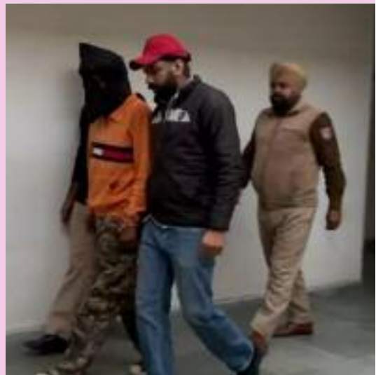
ਵੀ ਗ੍ਰਿਫ਼ਤਾਰ ਕੀਤਾ ਜਾਵੇਗਾ। ਇਹਨਾਂ ਕੋਲ ਕਿਰਪਾਨਾਂ, ਲੋਹੇ ਦੇ ਕਾਪੇ, ਲੋਹੇ ਦੀ ਰਾੜਾ, ਹੋਰ ਮਾਰੂ ਹਥਿਆਰ ਬਰਾਮਦ ਕੀਤੇ ਗਏ ਹਨ। ਜਾਂਚ ਪੜਤਾਲ ਸ਼ੁਰੂ ਕਰ ਦਿੱਤੀ ਗਈ ਹੈ।