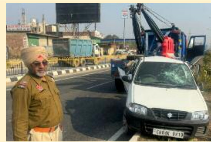
ਨੈਸ਼ਨਲ ਹਾਈਵੇ ਅਥਾਰਟੀ ਦੀ ਐਬੁਲੈਂਸ ਰਾਹੀਂ ਇਲਾਜ ਦੇ ਲਈ ਹਸਪਤਾਲ ਭਰਤੀ ਕਰਵਾਇਆ ਗਿਆ। ਜਦਕਿ ਨੈਸ਼ਨਲ ਹਾਈਵੇ ਅਥਾਰਟੀ ਦੀ ਰਿਕਵਰੀ ਵੈਨ ਵੱਲੋਂ ਆਲਟੋ ਗੱਡੀ ਨੂੰ ਸੜਕ ਤੋਂ ਹਟਾ ਕੇ ਰੋਡ ਨੂੰ