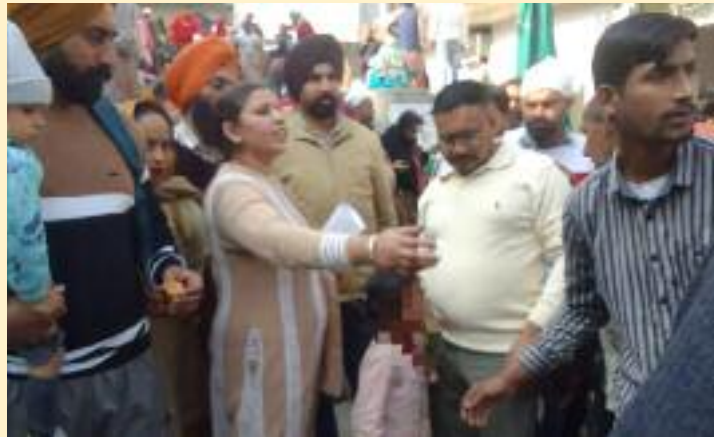
ਸਿੱਖਿਆ ਮੁੜ ਸ਼ੁਰੂ ਕਰਵਾਉਣ ਉਨ੍ਹਾਂ ਪਰਿਵਾਰਿਕ ਮੈਂਬਰਾਂ ਨੂੰ ਬਾਰੇ ਹਦਾਇਤ ਕੀਤੀ ਗਈ। ਸਖਤ ਸਬਦਾਂ ਵਿੱਚ ਤਾੜਨਾ