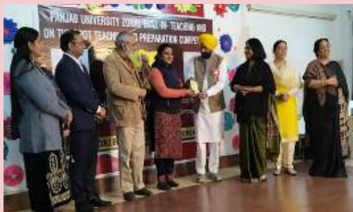
ਤੋਂ ਇਲਾਵਾ ਬੱਚਿਆਂ ਦੇ ਲਈ ਦੂਸਰੇ ਜੋਨ ਤੋਂ ਵੱਖ-ਮੁਕਾਬਲਿਆਂ ਨੂੰ ਜੱਜ ਕਰਨ ਵੱਖ ਕਾਲਜਾਂ ਅਤੇ ਸਕੂਲਾਂ ਦੇ