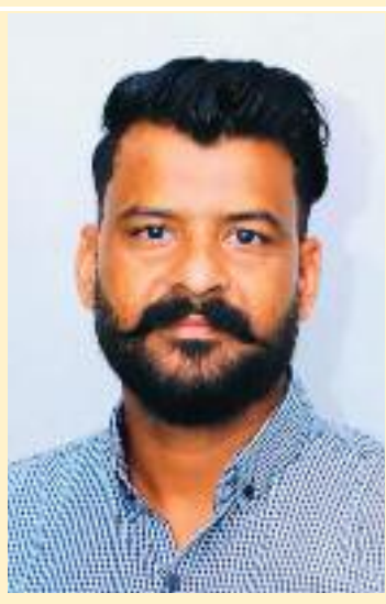
ਸਰਕਾਰ ਵਿੱਦਿਅਕ ਸੰਸਥਾਵਾਂ ਵਿੱਚ ਵੀ ਚੋਣਾਂ ਅਤੇ ਲੋਕਮਤ