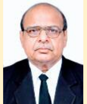
ਵਲੋਂ: ਮਿੱਤਰ ਸੈਨ ਮੀਤ

ਹੈ। ਕਿਰਪਾ ਕਰਕੇ ਤੁਸੀਂ ਵੀ ਇਨ੍ਹਾਂ ਜ਼ਿਮਨੀ ਹੁਕਮਾਂ ਦਾ ਅਧਿਐਨ ਕਰੋ ਅਤੇ ਦੇਖੋ ਕਿ ਸਾਨੂੰ ਹਰ ਪੇਸ਼ੀ ਤੇ ਕਿੰਨੀ ਮਿਹਨਤ ਕਰਨੀ ਪੈਂਦੀ ਹੈ। ਜ਼ਿਮਨੀ ਹੁਕਮਾਂ ਦੀ ਪੀਡੀਐਫ ਫਾਈਲ ਮਿੱਤਰ ਸੈਨ ਮੀਤ ਦੀ ਵੈਬਸਾਈਟ (imttersianmeeti.n) ਤੇ ਉਪਲਬਧ ਹੈ।