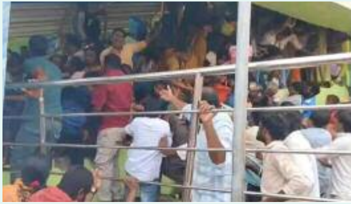
ਮੰਦਰ ਦੀਆਂ ਪੌੜੀਆਂ ਤੇ ਲੋਕਾਂ ਦੀ ਵੱਡੀ ਭੀੜ ਦਿਖਾਈ ਦੇ ਰਹੀ

ਜਾਣਕਾਰੀ ਅਨੁਸਾਰ ਅੱਜ ਏਕਾਦਸ਼ੀ ਮੌਕੇ ਵੈਂਕਟੇਸ਼ਵਰ ਸਵਾਮੀ ਮੰਦਰ ਵਿੱਚ ਵੱਡੀ ਭੀੜ ਇਕੱਠੀ ਹੋਈ ਸੀ। ਮੰਦਰ ਕੰਪਲੈਕਸ ਦੇ ਪ੍ਰਵੇਸ਼ ਦੁਆਰ ਦੇ ਨੇੜੇ ਭੀੜ ਦਾ ਦਬਾਅ ਅਚਾਨਕ ਵੱਧ ਗਿਆ, ਜਿਸ ਕਾਰਨ ਭਗਦੜ ਮਚ ਗਈ। ਸਥਾਨਕ ਪ੍ਰਸ਼ਾਸਨ ਅਤੇ ਪੁਲੀਸ ਮੌਕੇ ਤੇ ਪਹੁੰਚ ਗਈ ਅਤੇ ਰਾਹਤ ਅਤੇ ਬਚਾਅ ਕਾਰਜ ਸ਼ੁਰੂ ਕਰ ਦਿੱਤੇ। ਭਗਦੜ ਦੇ ਕਈ ਵੀਡੀਓ ਸਾਹਮਣੇ ਆਏ ਹਨ, ਜਿਸ ਵਿੱਚ