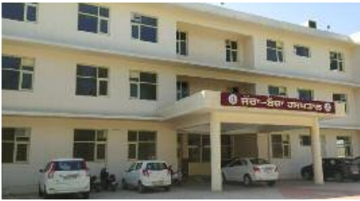
ਜੱਚਾ ਬੱਚਾ ਕੇਂਦਰ ਦੀ ਤਸਵੀਰ।

● ਜੱਚਾ ਬੱਚਾ ਕੇਂਦਰ 'ਚ ਲੋੜੀਂਦੇ ਸਮਾਨ ਨੂੰ ਪੂਰਾ ਕੀਤਾ ਜਾ ਰਿਹਾ ਹੈ : ਸਿਵਲ ਸਰਜਨ ● ਸਿਹਤ ਮੰਤਰੀ ਨੇ ਨਹੀਂ ਚੁੱਕਿਆ ਫੋਨ