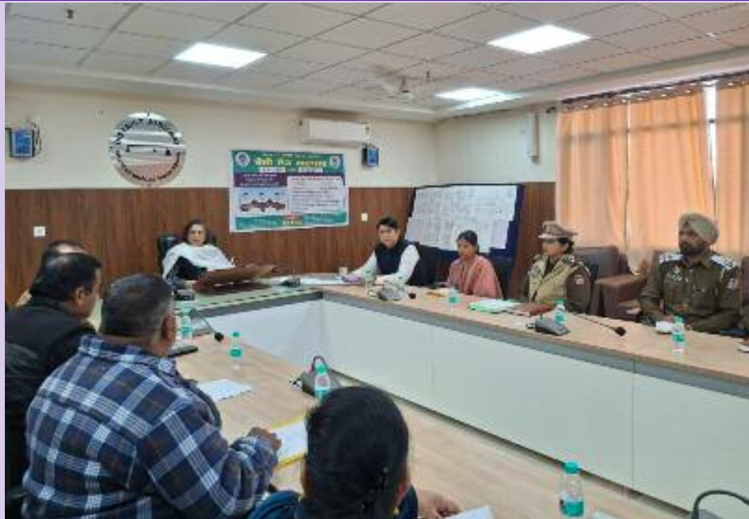
ਜਾਵੇਗੀ। ਉਨਾਂ ਦੱਸਿਆ ਕਿ ਇਸ ਕੌਮੀ ਲੋਕ ਅਦਾਲਤ ਵਿੱਚ ਬੀ.ਐਸ.ਐਨ.ਐਲ ਕੇਸਾਂ, ਬੀਮਾ ਕੰਪਨੀ ਦੇ ਨਾਲ ਸਬੰਧਤ ਕੇਸ, ਵਿੱਤੀ ਫਾਂਈਨਾਸ ਦੇ ਕੇਸ, ਬੈਂਕਾਂ ਲੋਨ ਨਾਲ ਸਬੰਧਤ ਕੇਸ, ਟ੍ਰੈਫਿਕ ਦੇ ਚਲਾਨ, ਪਾਣੀ ਦੇ ਬਿੱਲ ਦੇ ਕੇਸ, ਕ੍ਰਿਮੀਨਲ ਕਪਾਉਂਡੇਬਲ ਕੇਸ, ਚੈਂਕ ਬਾਉਸ ਨਾਲ ਸਬੰਧਿਤ ਕੇਸ, ਮੋਟਰ ਐਕਸੀਡੈਂਟ ਕਲੇਮ, ਟ੍ਰਿਬਿਊਨਲ ਨਾਲ ਸਬੰਧਿਤ ਕੇਸ, ਵਿਵਾਹਿਤ ਝਗੜੇ, ਟ੍ਰੈਫਿਕ ਚਲਾਨ, ਲੇਬਰ ਝਗੜੇ, ਬਿਜਲੀ ਦੇ ਬਿੱਲ ਦੇ

ਕੇਸ ਅਤੇ ਹੋਰ ਕੇਸਾਂ ਦੀ ਸੁਣਵਾਈ ਕੀਤੀ ਜਾਵੇਗੀ। ਇਸ ਤੋਂ ਇਲਾਵਾ ਉਨਾਂ ਕਿਹਾ ਕਿ ਲੋਕ ਅਦਾਲਤ ਵਿੱਚ ਕੇਸ ਲਗਾਉਣ ਲਈ ਜੇਕਰ ਕੋਈ ਪ੍ਰੇਸ਼ਾਨੀ ਆਉਦੀ ਹੈ ਤਾਂ ਦਫਤਰ ਜ਼ਿਲ੍ਹਾ ਕਾਨੂੰਨੀ ਸੇਵਾਵਾਂ ਅਥਾਰਟੀ, ਸ਼ਹੀਦ ਭਗਤ ਸਿੰਘ ਨਗਰ ਨਾਲ ਕੀਤਾ ਜਾਵੇ। ਇਸ ਤੋਂ ਇਲਾਵਾ ਮੀਟਿੰਗ ਵਿੱਚ ਹਾਜ਼ਰ ਸਮੂਹ ਅਧਿਕਾਰੀਆ ਅਤੇ ਕਰਮਚਾਰੀਆ ਨੂੰ ਕਿਹਾ ਗਿਆ ਕਿ ਉਹ ਆਪਣੇ ਆਪਣੇ ਵਿਭਾਗ ਨਾਲ ਸਬੰਧਿਤ ਕੇਸ ਇਸ ਕੌਮੀ ਨੈਸ਼ਨਲ ਲੋਕ ਅਦਾਲਤ ਵਿਚ ਵੱਧ ਤੋਂ ਵੱਧ ਲਗਵਾਉਣ ਤਾਂ ਜੋ ਉਨ੍ਹਾਂ ਦਾ ਆਪਸੀ ਸਹਿਮਤੀ ਨਾਲ ਫੌਰਨ ਅਤੇ ਯੋਗ ਨਿਪਟਾਰਾ ਕੀਤਾ ਜਾ ਸਕਦਾ ਹੈ ਅਤੇ ਲੋਕ ਅਦਾਲਤ ਬਾਰੇ ਆਮ ਲੋਕਾਂ ਨੂੰ ਵੱਧ ਤੋਂ ਵੱਧ ਜਾਗਰੂਕਤ ਕੀਤਾ ਜਾਵੇ।