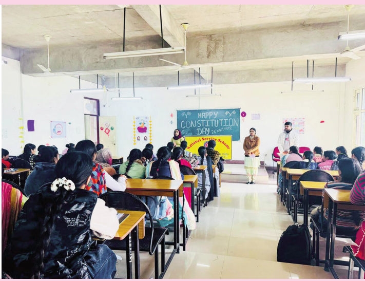
ਨਾਲ ਹੋਈ। ਉਨ੍ਹਾਂ ਨੇ ਡਾ. ਭੀਮ ਰਾਓ ਅੰਬੇਡਕਰ ਜੀ ਦੇ