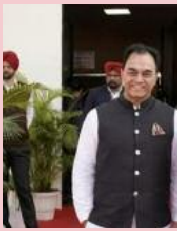
ਕਿਹਾ ਸੀ ਕਿ ਸਰਕਾਰ ਵੱਲੋਂ ਅਜਿਹਾ ਕੋਈ ਪ੍ਰਸਤਾਵ ਮੇਰੇ ਧਿਆਨ ਵਿੱਚ ਨਹੀਂ ਹੈ। ਇਸ ਮੁੱਦੇ 'ਤੇ ਤੱਥਾਂ ਤੋਂ ਬਿਨਾਂ ਫੈਲਾਈ ਜਾ ਰਹੀਆਂ ਅਫਵਾਹਾਂ ਨੇ ਲੋਕਾਂ ਵਿੱਚ ਬੇਲੋੜੀ ਚਿੰਤਾ ਪੈਦਾ ਕੀਤੀ ਹੈ, ਜਦੋਂ ਕਿ ਅਸਲੀਅਤ ਇਹ ਹੈ