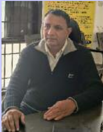
ਪਾਸ ਇੱਕ ਵਿੱਤੀ ਸਾਲ ਦੌਰਾਨ 100 ਦਿਨ ਦਾ ਰੁਜ਼ਗਾਰ ਲੈਣ ਦਾ ਕਾਨੂੰਨੀ ਹੱਕ

ਬੇਰੁਜ਼ਗਾਰੀ ਭੱਤੇ ਦੀ ਮੰਗ ਸਬੰਧੀ ਮਜ਼ਦੂਰਾਂ ਨੂੰ ਗੁੰਮਰਾਹ ਕੀਤਾ ਜਾ ਰਿਹਾ ਹੈ। ਉਨ੍ਹਾਂ ਨੇ ਇਸ ਸਬੰਧੀ ਸਖਤ ਨੋਟਿਸ ਲੈਂਦਿਆਂ ਚਿਤਾਵਨੀ ਦਿੱਤੀ ਕਿ ਮਜ਼ਦੂਰਾਂ ਨੂੰ ਗੁੰਮਰਾਹ ਕਰਨ ਦੀਆਂ ਕੋਸ਼ਿਸ਼ਾਂ ਬੰਦ ਕਰ ਕੇ ਆਪਣੀ ਬਣਦੀ ਡਿਊਟੀ ਕੀਤੀ ਜਾਵੇ। ਉਨ੍ਹਾਂ ਕਿਹਾ ਕਿ ਭਾਂਵੇ ਕਿ ਮਨਰੇਗਾ ਵਿੱਚੋਂ ਕੁੱਝ ਕੱਚੇ ਕੰਮ ਹਟਾ ਦਿੱਤੇ ਗਏ ਹਨ ਪਰ ਮਜ਼ਦੂਰਾਂ