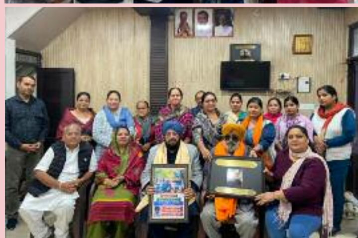
ਭਾਜਪਾ ਨਾਲ ਜਾਂ ਆਰ.ਐੱਸ.ਐੱਸ ਵਿੱਚ ਜ਼ਿਆਦਾ ਲੋਕ ਵੱਖ-ਵੱਖ ਨਾਲ ਜੁੜੇ ਹੋਏ ਹਨ ਅਤੇ ਉਹਨਾਂ ਦੋਸ਼ਾਂ ਦਾ ਸਾਹਮਣਾ ਕਰ ਰਹੇ ਹਨ।