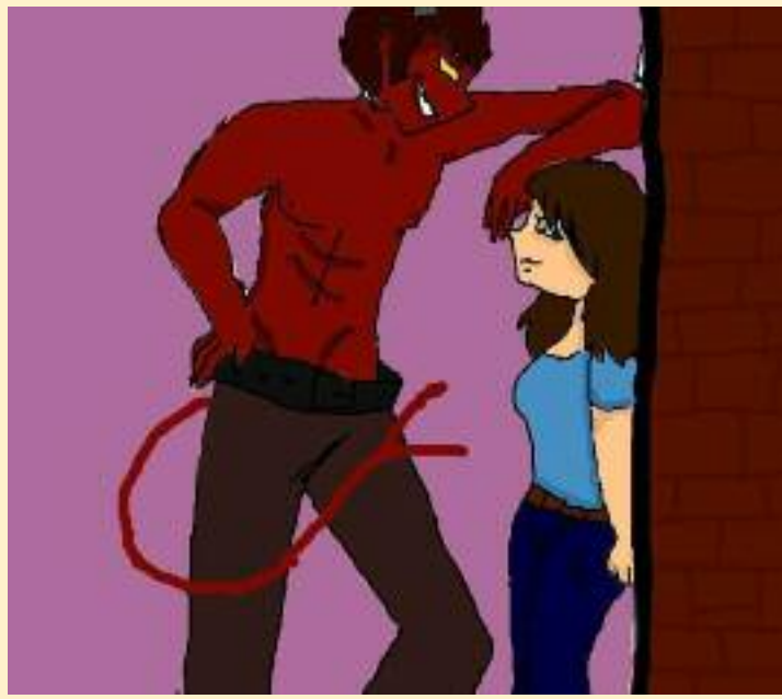
ਚਾਹੀਦਾ ਹੈ। ਕਿਤੇ ਇਹ ਨਾ ਨੂੰ ਆਪਣੀ ਹ/ਵਸ਼ ਦਾ ਸ਼ਿਕਾਰ ਹੋਵੇ ਕਿ ਸ਼ੈਤਾਨ ਕਿਸੇ ਹੋਰ ਬੱਚੀ ਬਣਾ ਲਵੇ। ਆਪਣੇ ਬੱਚੇ

ਬੱਚੀਆਂ ਦਾ ਧਿਆਨ ਨਾ ਦੇਣ ਵਾਲੇ ਲੋਕ ਹੀ ਅਜਿਹੀਆਂ ਘਟਨਾਵਾਂ ਦਾ ਜ਼ਿਕਰ ਹੁੰਦੇ ਹਨ। ਮੈਂ ਵੇਖਿਆ ਹੈ ਕਿ ਲੋਕ ਸੋਸ਼ਲ ਮੀਡੀਆ ਤੇ ਵਿਊ ਲੈਣ ਲਈ ਜਾਂ ਪੈਸਾ ਕਮਾਉਣ ਲਈ ਆਪਣੇ ਛੋਟੇ ਛੋਟੇ ਬੱਚੇ ਬੱਚੀਆਂ ਨੂੰ ਰੀਲਾਂ ਬਣਾਉਣ ਦੇ ਕਿੱਤੇ ਵਿੱਚ ਜਬਰਦਸਤੀ ਧਕੇਲ ਰਹੇ ਹਨ। ਕੋਲ ਬੈਠ ਕੇ ਮਾਂ ਬਾਪ ਆਪਣੇ ਬੱਚਿਆਂ ਤੋਂ ਰੀਲਾਂ ਬਣਵਾਉਂਦੇ ਹਨ। ਜਿਹੜੇ ਲੋਕ ਸਿਰਫ਼ ਬਿਨਾਂ ਮਤਲਬ ਦੀਆਂ ਵੀਡੀਓਜ਼ ਵੇਖਣ ਜਾਂ ਵੀਡੀਓਜ਼ ਅਪਲੋਡ ਕਰਨ ਲਈ ਮਹਿੰਗੇ ਮੋਬਾਇਲ ਖਰੀਦਦੇ ਹਨ ਉਨ੍ਹਾਂ ਵਾਸਤੇ ਮੋਬਾਈਲ ਕੈਂਸਰ ਤੋਂ ਖਤਰਨਾਕ ਹੈ। ਲੋਕ ਮੋਬਾਈਲ ਜ਼ਰੀਏ