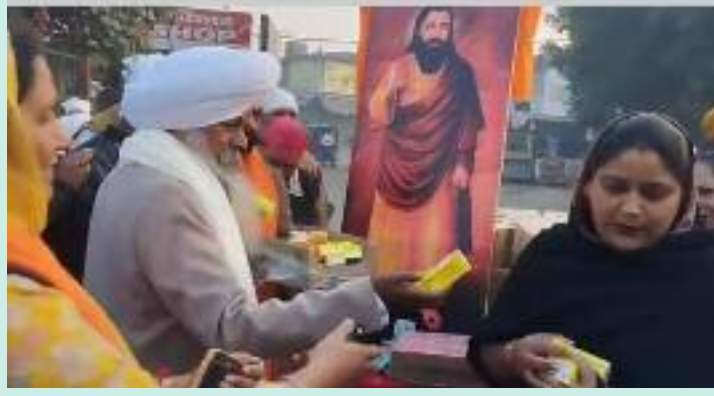
ਲੀਡਰਸ਼ਿਪ ਨੇ ਵੀ ਕ੍ਰਾਂਤੀਕਾਰੀ ਸੰਤਾ ਮਹਾਪੁਰਸ਼ਾ ਦਾ ਅਸੀਰਵਾਦ ਪ੍ਰਾਪਤ ਕੀਤਾ ਔਰ ਲੱਗਰਾਂ ਦੀ ਸੇਵਾ ਵੀ