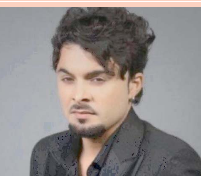
ਸਟੇਸ਼ਨ ਵਿੱਚ ਸ਼ਿਕਾਇਤ ਦਰਜ ਕਰਵਾਈ ਸੀ, ਜਿਸ ਵਿੱਚ ਧੋਖਾਧੜੀ ਨਾਲ ਦੁਜਾ ਵਿਆਹ ਕਰਵਾਉਣ ਅਤੇ ਉਸ ਦੇ ਸੋਨੇ ਦੇ ਗਹਿਣਿਆਂ ਦੇ ਹੜੱਪਣ ਦਾ ਦੋਸ਼ ਲਗਾਇਆ ਗਿਆ ਸੀ। ਇਸ ਸ਼ਿਕਾਇਤ ਦੇ ਆਧਾਰ 'ਤੇ, ਪੁਲਿਸ ਨੇ 30 ਮਈ ਨੂੰ ਮੁਲਜ਼ਮ ਖ਼ਿਲਾਫ ਧੋਖਾਧੜੀ ਸਮੇਤ ਵੱਖ-ਵੱਖ ਧਾਰਾਵਾਂ ਤਹਿਤ ਕੇਸ ਦਰਜ ਕੀਤਾ ਸੀ। ਹਾਲਾਂਕਿ, ਪੁਲਿਸ ਨੇ ਅਜੇ ਤੱਕ ਦੋਸ਼ੀ ਨੂੰ ਗ੍ਰਿਫਤਾਰ ਨਹੀਂ ਕੀਤਾ ਹੈ। ਅਦਾਲਤ ਨੇ ਦੋਸ਼ੀ ਵਿਰੁੱਧ ਬਲਾਤਕਾਰ ਦੀ ਧਾਰਾ ਜੋੜਨ ਦਾ ਹੁਕਮ ਵੀ ਜਾਰੀ ਕੀਤਾ।