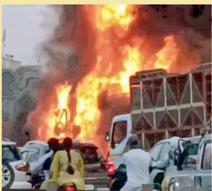
ਰਹੀ ਹੈ ਜੋ ਅੱਗ ਦੀਆਂ ਗਈ। ਇਸ ਹਾਦਸੇ ਵਿਚ ਲਪਟਾਂ ਵਿੱਚ ਘਿਰੇ ਹੋਏ ਦਰਜਨ ਤੋਂ ਵੱਧ ਵਾਹਨ ਸਨ। ਇਸ ਮੌਕੇ ਫਾਇਰ ਵਾਹਨ ਆਪਸ ਵਿਚ ਟਕਰਾ ਬ੍ਰਿਗੇਡ ਵਲੋਂ ਅੱਗ ਬੁਝਾਈ ਗਏ ਸਨ।

ਪੁਣੇ। ਪੁਣੇ ਸ਼ਹਿਰ ਦੇ ਬਾਹਰਵਾਰ ਮੁੰਬਈ-ਬੰਗਲੁਰੂ ਹਾਈਵੇਅ 'ਤੇ ਇੱਕ ਪੁਲ 'ਤੇ ਇੱਕ ਟਰੱਕ ਦੀ ਬਰੇਕ ਫੇਲ੍ਹ ਹੋਣ ਤੋਂ ਬਾਅਦ ਦੋ ਕੰਟੇਨਰ ਟਰੱਕਾਂ ਨੂੰ ਅੱਗ ਲਗ ਗਈ ਤੇ ਇਨ੍ਹਾਂ ਟਰੱਕਾਂ ਦਰਮਿਆਨ ਕਾਰ ਫਸ ਗਈ ਜਿਸ ਕਾਰਨ 8 ਜਣਿਆਂ ਦੀ ਮੌਤ ਹੋ ਗਈ। ਪੁਲੀਸ ਨੇ ਦੱਸਿਆ ਕਿ ਇਸ ਹਾਦਸੇ ਵਿਚ 15 ਜਣਿਆਂ ਦੇ ਕਰੀਬ ਹੋਰ ਜ਼ਖਮੀ ਹੋ ਗਏ ਹਨ। ਇੱਕ ਪੁਲੀਸ ਅਧਿਕਾਰੀ ਨੇ ਕਿਹਾ, ‘ਇਸ ਹਾਦਸੇ ਵਿਚ ਅੱਠ ਲੋਕਾਂ ਦੀ ਮੌਤ ਹੋ ਗਈ ਤੇ ਜ਼ਖਮੀਆਂ ਨੂੰ ਹਸਪਤਾਲ ਲਿਜਾਇਆ ਗਿਆ।’ ਹਾਦਸੇ ਤੋਂ ਬਾਅਦ ਸਾਹਮਣੇ ਆਏ ਵੀਡੀਓਜ਼ ਵਿੱਚ ਕਾਰ ਦੇ ਭਾਰੀ ਵਾਹਨਾਂ ਵਿਚਕਾਰ ਫਸੀ ਹੋਈ ਦਿਖਾਈ ਦੇ