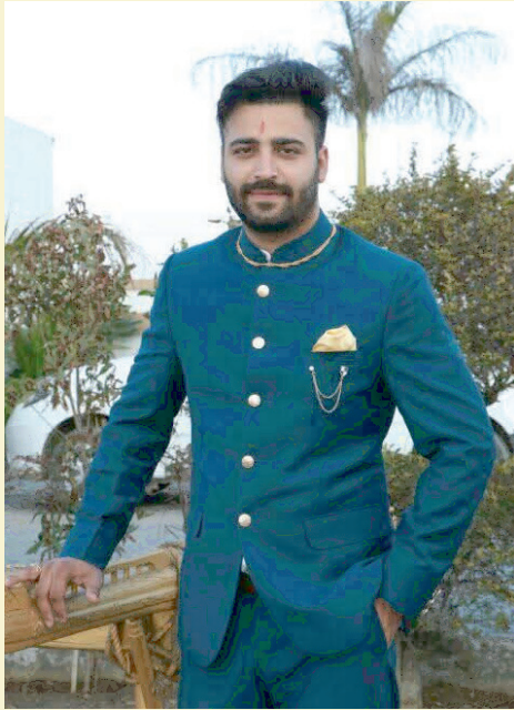
ਗੁਰੂ ਜਨਾਂ ਦੀ ਦਾਤ ਹੈ, ਡਾਢੀ ਹੀ ਅਣਮੁੱਲ।