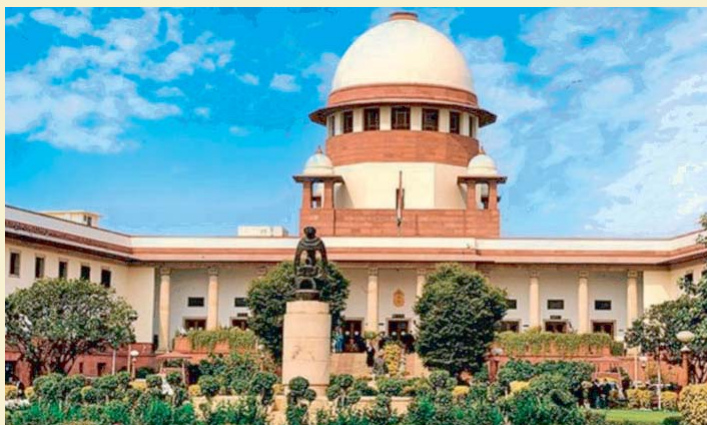
ਲਾਗੂ ਹਨ। ਸੀਨੀਅਰ ਵਕੀਲ ਕੀਤਾ ਜਾਣਾ ਚਾਹੀਦਾ ਹੈ। ਕੁੱਝ ਥਾਵਾਂ ਉਤੇ ਏਅਰ ਕੁਆਲਿਟੀ ਨੇ ਕਿਹਾ, “ਗਰੈਪ-4 ਲਾਗੂ