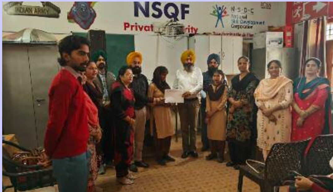
ਇਸ ਮੁਕਾਬਲੇ ਦਾ ਮਕਸਦ ਪਰੰਪਰਾ, ਸੱਭਿਆਚਾਰ ਅਤੇ ਵਿਦਿਆਰਥੀਆਂ ਵਿੱਚ ਸਿਖ ਮਹਾਨ ਗੁਰੂ ਸਾਹਿਬਾਨ ਦੀਆਂ ਸਿਖਿਆਵਾਂ ਪ੍ਰਤੀ ਜਾਣਕਾਰੀ ਦੇਣਾ ਅਤੇ ਪ੍ਰੇਰਨਾ ਪੈਦਾ ਕਰਨਾ ਹੈ। ਉਨ੍ਹਾਂ ਨੇ ਵਿਦਿਆਰਥੀਆਂ ਦੇ ਉਤਸ਼ਾਹ ਅਤੇ ਅਧਿਆਪਕਾਂ ਦੀ ਭੂਮਿਕਾ ਦੀ ਵੀ ਪ੍ਰਸ਼ੰਸਾ ਕੀਤੀ। ਇਸ ਮੌਕੇ ਬਲਾਕ ਪੱਧਰੀ ਭਾਸ਼ਣ ਮੁਕਾਬਲੇ ਵਿੱਚੋਂ ਪਹਿਲਾ, ਦੂਜਾ ਅਤੇ ਤੀਜਾ ਸਥਾਨ ਹਾਸਲ ਕਰਨ ਵਾਲੇ ਵਿਦਿਆਰਥੀਆਂ ਨੂੰ ਮੁਕਾਬਲੇ ਵਿੱਚ ਬਲਾਕ ਪੱਧਰ ਤੇ ਪਹਿਲੇ ਸਥਾਨ ਹਾਸਲ ਕਰਨ ਵਾਲੇ ਵਿਦਿਆਰਥੀਆਂ ਨੂੰ ਸਨਮਾਨਿਤ ਕੀਤਾ ਗਿਆ। ਗੌਰਤਲਬ ਹੈ ਕਿ ਇਸ ਬਲਾਕ ਪੱਧਰੀ ਭਾਸ਼ਣ ਮੁਕਾਬਲੇ ਵਿੱਚੋਂ ਪਹਿਲਾ ਸਥਾਨ ਹਾਸਿਲ ਕਰਨ ਵਾਲੇ ਵਿਦਿਆਰਥੀ ਜ਼ਿਲ੍ਹਾ ਪੱਧਰ 'ਤੇ ਹੋਣ ਵਾਲੇ ਮੁਕਾਬਲੇ ਵਿੱਚ ਭਾਗ ਲੈਣਗੇ।