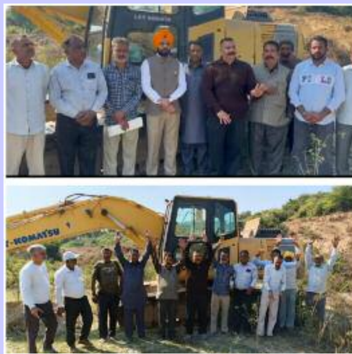
ਪਿੰਡ ਰੈਲਮਾਜਰਾ ਦੇ ਜੰਗਲ ਵਿਚ ਕਰਾਹੀ ਕਰਦੀ ਪੱਕਲੈਨ ਮਸ਼ੀਨ ਅਤੇ ਨਾਹਰੇ ਬਾਜ਼ੀ ਕਰਦੇ ਅਤੇ ਪਿੰਡਾਂ ਲੋਕ ਅਤੇ ਮੋਹਤਬਰ।

ਨਵਾਸ਼ਹਿਰ /ਕਾਠਗੜ੍ਹ (ਜਤਿੰਦਰ ਪਾਲ ਸਿੰਘ ਕਲੇਰ) ਪਿਛਲੇ ਕੁਝ ਦਿਨਾਂ ਤੋਂ ਲੁਕਛਿੱਪ ਕੇ ਰੈਲਮਾਜਰਾ ਦੇ ਜੰਗਲ ਵਿਚ ਨਜਾਇਜ਼ ਤੌਰ ਤੇ ਮਾਇਨਿੰਗ ਜਾ ਜੰਗਲ ਦੀ ਹੋਂਦ ਖਤਮ ਲਈ ਸਾਜਿਸ਼ ਤਹਿਤ ਕਿਸੇ ਵੱਡੇ ਕੰਪਨੀ ਦੇ ਕਰਿਦਿਆ ਵੱਲੋਂ ਅੱਜ ਵੀ ਜੰਗਲ ਦੀ ਕਟ ਕਟਾਈ ਅਤੇ ਕਰਾਹੀ ਕਰ ਰਹੀਆਂ ਪੱਕਲੈਨ ਮਸ਼ੀਨਾਂ ਰਾਹੀਂ ਕੀਤੀ ਜਾਂਦੀ ਸੀ। ਪਿੰਡ ਰੈਲਮਾਜਰਾ ਦੇ ਨਿਵਾਸੀਆਂ ਨੂੰ ਜਦੋਂ ਇਸ ਗੱਲ ਦੀ ਭਿਨਕ ਪਈ ਤਾਂ ਦੋਹਾਂ ਪਿੰਡਾਂ ਦੇ ਸਰਪੰਚ ਅਤੇ ਮੋਹਤਬਰ ਵੱਡੀ ਗਿਣਤੀ ਵਿਚ ਜੰਗਲ ਵਿਚ ਨਜਾਇਜ਼ ਕਰਾਹੀ ਕਰਦੇ ਸਾਧਨਾਂ ਦੇ ਡਰਾਈਵਰਾਂ ਨੂੰ ਰੋਕਣ ਲਈ ਜੰਗਲ ਵਿਚ ਚਲੇ ਅਤੇ ਡਰਾਈਵਰ ਪਿੰਡ