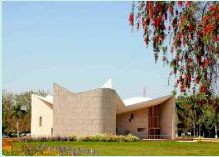
ਇਸ ਦੀ ਗਿਣਤੀ ਘਟਾ ਕੇ 31 ਮੈਂਬਰਾਂ ਤੱਕ ਸੀਮਿਤ ਕਰ ਦਿੱਤੀ ਗਈ ਹੈ। ਯੂਨੀਵਰਸਿਟੀ ਵਿੱਚ

ਤਹਿਤ ਪ੍ਰਾਪਤ ਹਨ। ਇਸ ਐਕਟ ਅਧੀਨ ਸੈਨੇਟ ਨੂੰ ਵੱਖ-ਵੱਖ ਵਿਸ਼ਿਆਂ ਵਿੱਚ ਨਵੀਆਂ ਫੈਕਲਟੀਆਂ ਗਠਿਤ ਕਰਨ, ਵਿਦਿਆਰਥੀਆਂ ਦੀ ਅਕਾਦਮਿਕ ਪ੍ਰਗਤੀ ਦੇ ਮਾਪਦੰਡ ਤੈਅ ਕਰਨ ਅਤੇ ਯੂਨੀਵਰਸਿਟੀ ਦੇ ਨਿਯਮਾਂ ਵਿੱਚ ਤਬਦੀਲੀਆਂ ਕਰਨ ਦਾ ਅਧਿਕਾਰ ਹੈ। ਆਮ ਤੌਰ 'ਤੇ ਸੈਨੇਟ ਨੂੰ ਯੂਨੀਵਰਸਿਟੀ ਦੀ ਅਕਾਦਮਿਕ ਦਿਸ਼ਾ ਤੇ ਨੀਤੀ-ਰੂਪਰੇਖਾ ਤੈਅ ਕਰਨ ਵਾਲੀ ਸੰਸਥਾ ਮੰਨਿਆ ਜਾਂਦਾ ਹੈ। ਪਹਿਲਾਂ ਸੈਨੇਟ ਵਿੱਚ ਤਕਰੀਬਨ 90 ਮੈਂਬਰ ਹੁੰਦੇ ਸਨ, ਪਰ ਹੁਣ