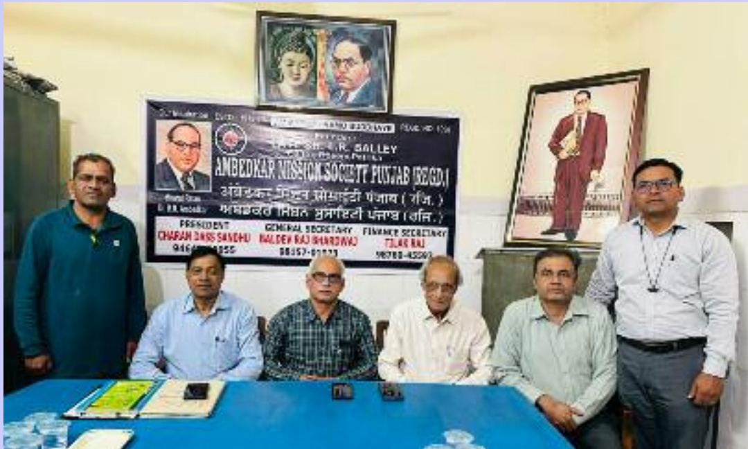
ਅੰਬੇਡਕਰ ਮਿਸ਼ਨ ਸੁਸਾਇਟੀ ਦੇ ਆਗੂ ਮੀਡੀਆ ਨੂੰ ਜਾਣਕਾਰੀ ਦਿੰਦੇ ਹੋਏ।