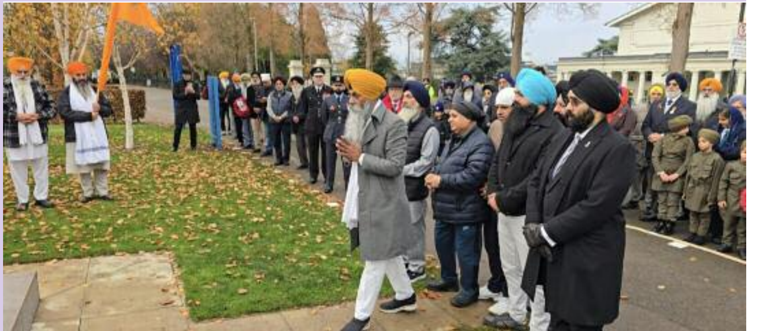
ਸ਼ਹੀਦ ਸਿੱਖ ਫੌਜੀਆਂ ਨੂੰ ਸ਼ਰਧਾਂਜਲੀ ਭੇਟ ਕਰਦੇ ਹੋਏ ਵੱਖ ਵੱਖ ਮਹਿਕਮਿਆਂ ਦੇ ਅਧਿਕਾਰੀ, ਸਿਟੀ ਕੌਂਸਲ ਦੇ ਨੁਮਾਇੰਦੇ ਅਤੇ ਗੁਰੂ ਘਰਾਂ ਦੇ ਪ੍ਰਬੰਧਕ।