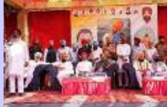
ਤਹਿਤ ਮਾਮਲੇ ਦੀ ਖੁਦ ਜਾਂਚ ਸ਼ੁਰੂ ਕਰ ਦਿੱਤੀ ਹੈ। ਕਮਿਸ਼ਨ ਨੇ ਕਿਹਾ ਕਿ ਰਾਜਨੀਤਿਕ ਲਾਭ ਲਈ ਭਾਈ ਜੀਵਨ ਸਿੰਘ (ਭਾਈ ਜੈਤਾ) ਅਤੇ 9ਵੀਂ ਪਾਤਸ਼ਾਹੀ, ਸ੍ਰੀ ਗੁਰੂ ਤੇਗ ਬਹਾਦਰ ਦੀਆਂ ਤਸਵੀਰਾਂ ਦੀ ਅਪਮਾਨਜਨਕ ਵਰਤੋਂ ਸੰਬੰਧੀ ਸ਼ਿਕਾਇਤਾਂ ਪ੍ਰਾਪਤ ਹੋਈਆਂ ਹਨ। ਇਸ ਦੇ ਆਧਾਰ 'ਤੇ ਦੋਵਾਂ ਧਿਰਾਂ ਨੂੰ ਨੋਟਿਸ ਜਾਰੀ ਕੀਤੇ ਗਏ ਹਨ। ਕਮਿਸ਼ਨ ਨੇ ਇਹ ਵੀ ਸਪੱਸ਼ਟ ਕੀਤਾ ਹੈ ਕਿ ਜੇਕਰ ਨਿਰਧਾਰਤ ਮਿਤੀ ਤੱਕ ਜਵਾਬ ਅਤੇ ਰਿਪੋਰਟ ਜਮ੍ਹਾਂ ਨਹੀਂ ਕਰਵਾਈ ਜਾਂਦੀ ਹੈ, ਤਾਂ ਕਮਿਸ਼ਨ ਧਾਰਾ 10(1) ਦੇ ਤਹਿਤ ਆਪਣੀਆਂ ਸਿਵਲ ਅਦਾਲਤ ਵਰਗੀਆਂ ਸ਼ਕਤੀਆਂ ਦੀ ਵਰਤੋਂ ਕਰਨ ਲਈ ਮਜਬੂਰ ਹੋਵੇਗਾ।