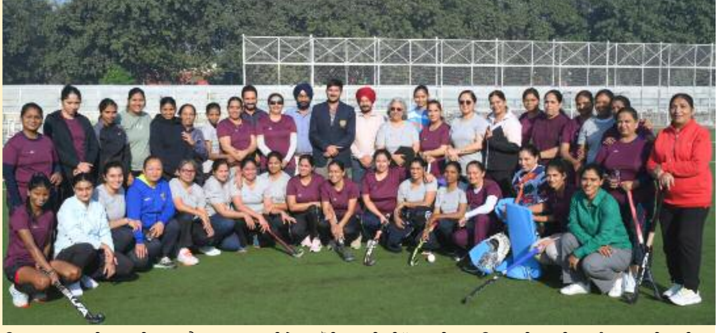
ਉਤਸ਼ਾਹ ਨਾਲ ਤਾੜੀਆਂ ਮਾਰੀਆਂ, ਜਿਸ ਨਾਲ ਇਹ ਮੌਕਾ ਸੱਚਮੁੱਚ ਯਾਦਗਾਰ ਬਣ ਗਿਆ। ਆਰ ਸੀ ਐੱਫ ਕਪੂਰਥਲਾ ਵਿਖੇ ਆਯੋਜਿਤ ਇਹ ਸਮਾਰੋਹ ਹਾਕੀ ਇੰਡੀਆ ਵਲੋਂ ਭਾਰਤੀ ਹਾਕੀ ਦੀ ਉੱਤਮਤਾ ਦੀ ਇੱਕ ਸਦੀ ਮਨਾਉਣ ਲਈ ਇੱਕ ਦੇਸ਼ ਵਿਆਪੀ ਪਹਿਲਕਦਮੀ ਦਾ ਹਿੱਸਾ ਸੀ, ਜਿਸ ਵਿੱਚ ਉਨ੍ਹਾਂ ਨਾਇਕਾਂ ਨੂੰ ਯਾਦ ਕੀਤਾ ਗਿਆ ਜਿਨ੍ਹਾਂ ਨੇ ਅੰਤਰਰਾਸ਼ਟਰੀ ਪੱਧਰ 'ਤੇ ਦੇਸ਼ ਦਾ ਨਾਮ ਰੌਸ਼ਨ ਕੀਤਾ।

ਕਰਦਿਆਂ ਆਪਣੀ ਖੇਡ ਭਾਵਨਾ ਨਾਲ ਖੇਡ ਪ੍ਰਸ਼ੰਸਕਾਂ ਨੂੰ ਮੰਤਰਮੁਗਧ ਕੀਤਾ। ਇਨ੍ਹਾਂ ਮੈਚਾਂ ਨੇ ਭਾਰਤ ਦੀ ਅਮੀਰ ਹਾਕੀ ਵਿਰਾਸਤ ਦਾ ਜਸ਼ਨ ਮਨਾਇਆ ਅਤੇ ਨੌਜਵਾਨ ਖਿਡਾਰੀਆਂ ਨੂੰ ਦੇਸ਼ ਦੀ ਸ਼ਾਨਦਾਰ ਹਾਕੀ ਪਰੰਪਰਾ ਨੂੰ ਅੱਗੇ ਵਧਾਉਣ ਲਈ ਪ੍ਰੇਰਿਤ ਕੀਤਾ। ਆਰ ਸੀ ਐੱਫ ਐਸਟੇਟਰਫ ਹਾਕੀ ਸਟੇਡੀਅਮ ਅੱਜ ਭਰਪੂਰ ਉਰਜਾ ਅਤੇ ਉਤਸ਼ਾਹ ਨਾਲ ਭਰਿਆ ਹੋਇਆ ਸੀ ਕਿਉਂਕਿ ਇਸ ਵਿਚ ਹਾਕੀ ਦੇ ਪੁਰਾਣੇ ਅਤੇ ਮੌਜੂਦਾ ਸਿਤਾਰਿਆਂ ਨੇ ਬੇਮਿਸਾਲ ਟੀਮ ਵਰਕ ਅਤੇ ਖੇਡ ਭਾਵਨਾ ਦਾ ਪ੍ਰਦਰਸ਼ਨ ਕੀਤਾ। ਖੇਡ ਪ੍ਰਸ਼ੰਸਕਾਂ ਨੇ ਹਰ ਕਦਮ 'ਤੇ