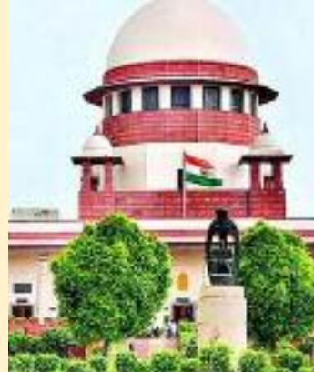
ਕਿਹਾ ਕਿ ਪਰਿਵਾਰ ਨੂੰ ਕਿਸੇ ਵੀ ਕਥਿਤ ਬੋਝ ਨਹੀਂ ਚੁੱਕਣਾ ਚਾਹੀਦਾ। "ਇਹ ਇੱਕ ਬਹੁਤ ਹੀ ਮੰਦਭਾਗਾ ਹਾਦਸਾ ਹੈ। ਪਰ ਤੁਹਾਨੂੰ ਇਹ ਬੋਝ ਨਹੀਂ ਚੁੱਕਣਾ ਚਾਹੀਦਾ ਕਿ ਤੁਹਾਡੇ ਪੁੱਤਰ ਨੂੰ ਦੋਸ਼ੀ ਠਹਿਰਾਇਆ ਜਾ ਰਿਹਾ ਹੈ। ਅਸੀਂ ਹਮੇਸ਼ਾ ਸਪੱਸ਼ਟ ਕਰ ਸਕਦੇ ਹਾਂ ਕਿ ਕਿਸੇ ਨੂੰ ਵੀ ਅਤੇ ਖਾਸ ਕਰਕੇ ਪਾਇਲਟ ਨੂੰ ਇਸ ਦੁਖਾਂਤ ਲਈ ਦੋਸ਼ੀ ਨਹੀਂ ਠਹਿਰਾਇਆ ਜਾ ਸਕਦਾ," ਬੈਂਚ ਨੇ ਕਿਹਾ। "ਕਾਕਪਿਟ ਰਿਕਾਰਡਰ ਦਾ ਸਿਰਫ਼ ਇੱਕ ਜ਼ਿਕਰ ਹੈ ਜਿੱਥੇ ਇੱਕ ਪਾਇਲਟ ਤੁਹਾਡੇ ਪੁੱਤਰ ਨੂੰ