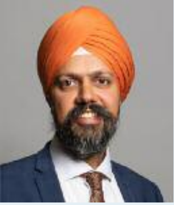
ਰੱਖਿਆ ਬਜਟ ਵਧਾਇਆ ਜਾ

ਸਾਈਬਰ ਹਮਲੇ ਅਤੇ ਹੋਰ ਆਧੁਨਿਕ ਖਤਰਿਆਂ ਨੂੰ ਧਿਆਨ ਵਿੱਚ ਰੱਖਦੇ ਹੋਏ। ਢੇਸੀ ਨੇ ਪੁੱਛਿਆ ਕਿ ਸਰਕਾਰ ਇਸ ਖੇਤਰ ਵਿੱਚ ਹੋਰ ਤੇਜ਼ ਨਿਵੇਸ਼ ਕਰਨ ਲਈ ਕੀ ਯੋਜਨਾਵਾਂ ਬਣਾਉਂਦੀ ਹੈ। ਉਨ੍ਹਾਂ ਨੇ ਜਰਮਨੀ ਦੀ ਉਦਾਹਰਨ ਦਿੱਤੀ, ਜਿੱਥੇ ਰੱਖਿਆ ਵਿਭਾਗ ਲਈ ਵਿੱਤੀ ਨਿਯਮ ਵਿੱਚ ਕੀਤੇ ਗਏ ਹਨ, ਤਾਂ ਜੋ