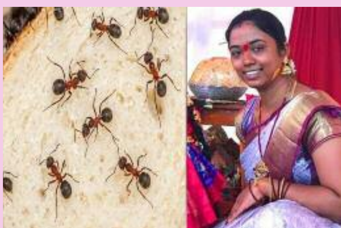
ਕੀੜੀਆਂ ਨਾਲ ਨਹੀਂ ਰਹਿ ਸਕਦੀ। (ਧੀ) ਦਾ ਧਿਆਨ ਰੱਖਣਾ। ਸਾਵਧਾਨ ਰਹਿਣਾ।" ਪੁਲਿਸ ਨੇ ਕਿਹਾ, "ਲੱਗਦਾ ਹੈ ਕਿ ਉਸਨੇ ਸਫ਼ਾਈ ਕਰਦੇ ਸਮੇਂ ਕੀੜੀਆਂ ਨੂੰ ਦੇਖਿਆ ਅਤੇ ਡਰ ਦੇ ਮਾਰੇ ਇਹ ਕਦਮ ਚੁੱਕਿਆ ਹੋਵੇਗਾ।"

ਹੈਦਰਾਬਾਦ। ਤੇਲੰਗਾਨਾ ਦੇ ਸੰਗਰੇਡੀ ਜ਼ਿਲ੍ਹੇ ਵਿੱਚ ਇੱਕ 25 ਸਾਲਾ ਔਰਤ ਨੇ ਕੀੜੀਆਂ ਦੇ ਡਰ ਕਾਰਨ ਅਪਣੇ ਘਰ ਵਿੱਚ 'ਤੇ ਖ਼ੁਦਕੁਸ਼ੀ ਕਰ ਲਈ। ਪੁਲਿਸ ਅਨੁਸਾਰ, ਔਰਤ ਬਚਪਨ ਤੋਂ ਹੀ ਕੀੜੀਆਂ ਤੋਂ ਡਰਦੀ ਸੀ ਅਤੇ ਪਹਿਲਾਂ ਅਪਣੇ ਜੱਦੀ ਸ਼ਹਿਰ, ਮਨਚੇਰੀਆਲ ਦੇ ਇੱਕ ਹਸਪਤਾਲ ਵਿੱਚ ਕਾਉਂਸਲਿੰਗ ਲੈ ਚੁਕੀ ਸੀ। ਘਟਨਾ ਵਾਲੇ ਦਿਨ, ਔਰਤ ਅਪਣੀ ਧੀ ਨੂੰ ਰਿਸ਼ਤੇਦਾਰ ਦੇ ਘਰ ਛੱਡ ਗਈ ਸੀ ਅਤੇ ਕਿਹਾ ਸੀ ਕਿ ਉਹ ਘਰ ਦੀ ਸਫ਼ਾਈ ਕਰਨ ਤੋਂ ਬਾਅਦ ਉਸ ਨੂੰ ਚੁੱਕ ਲਵੇਗੀ। ਔਰਤ ਨੇ ਅਪਣੇ ਸੁਸਾਈਡ ਨੋਟ ਵਿੱਚ ਲਿਖਿਆ ਸੀ: "ਮੈਨੂੰ ਮਾਫ਼ ਕਰਨਾ ਮੈਂ ਇਨ੍ਹਾਂ