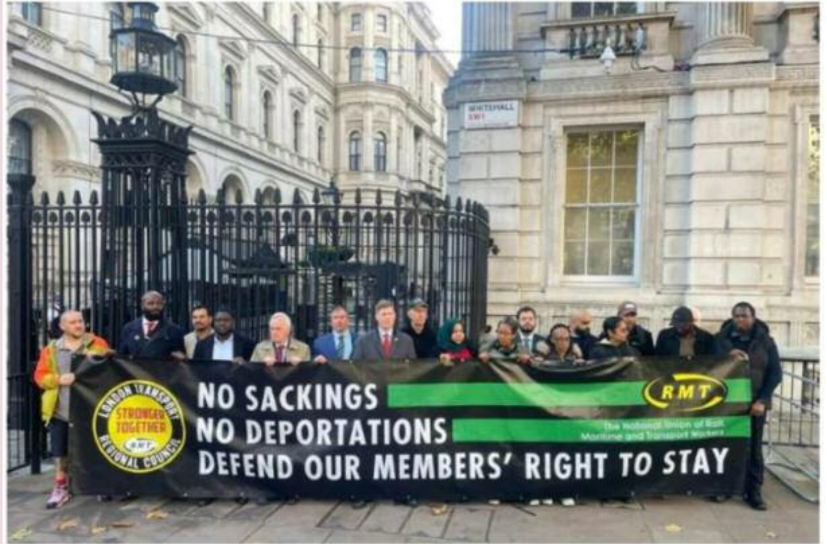
RMT members protest in Downing Street, London, November 7, 2025

IWA (GB) ਨੇ ਚੇਤਾਵਨੀ ਦਿੱਤੀ ਕਿ ਇਸ ਸਾਲ ਲਿਆਂਦੀਆਂ ਇਮੀਗ੍ਰੇਸ਼ਨ ਤਬਦੀਲੀਆਂ ਨੇ ਵਿਦਿਆਰਥੀਆਂ, ਕੇਅਰ ਵਰਕਰਾਂ ਅਤੇ ਛੋਟੇ ਕਾਰੋਬਾਰਾਂ — ਖਾਸਕਰ 2,400 ਦੱਖਣੀ ਏਸ਼ੀਆਈ ਰੈਸਟੋਰੈਂਟਾਂ — ਉੱਤੇ ਗੰਭੀਰ ਅਸਰ