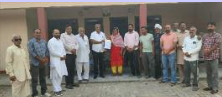
ਜੀ ਦੀ ਇਹ ਪਹਿਲ ਹੈ ਕਿ ਪੰਜਾਬ ਦੀ ਨੌਜਵਾਨੀ ਪੀੜ੍ਹੀ ਨੂੰ ਨਸ਼ਿਆਂ ਤੋਂ ਦੂਰ ਰੱਖਣਾ ਅਤੇ ਉਹਨਾਂ ਦੀ ਸਿਹਤ ਸੰਭਾਲ ਲਈ ਪਿੰਡਾਂ ਵਿੱਚ ਸਟੇਡੀਅਮ ਬਣਾਉਣੇ , ਨੌਜਵਾਨਾਂ ਨੂੰ ਕਸਰਤ ਕਰਨ ਲਈ ਜਿੱਮ ਖੋਲ ਕੇ ਦੇਣੇ ਅਤੇ ਹੋਰ ਸਹੂਲਤਾਂ

ਜ਼ਿਲ੍ਹਾ ਸ਼ਹੀਦ ਭਗਤ ਸਿੰਘ ਨਗਰ ਨੇ ਦੱਸਿਆ ਕਿ ਇਹ ਗ੍ਰਾਂਟ ਪਿੰਡ ਦੇ ਖੇਡ ਮੈਦਾਨ ਨੂੰ ਤਿਆਰ ਕਰਨ ਲਈ ਦਿੱਤੀ ਗਈ ਹੈ। ਉਹਨਾਂ ਦਾ ਕਹਿਣਾ ਹੈ ਕਿ ਅਗਰ ਸਾਡੇ ਨੌਜਵਾਨ ਖੇਡਾਂ ਨਾਲ ਜੁੜਨਗੇ ਤਾਂ ਜਿੱਥੇ ਉਹ ਨਸ਼ੇ ਤੋਂ ਦੂਰ ਰਹਿਣਗੇ, ਉਥੇ ਹੀ ਉਹਨਾਂ ਦਾ ਭਵਿੱਖ ਉਜਵਲ ਹੋਏਗਾ। ਪੰਜਾਬ ਦੇ ਮਾਨਯੋਗ ਮੁੱਖ ਮੰਤਰੀ ਸ਼੍ਰੀ ਭਗਵੰਤ ਸਿੰਘ ਮਾਨ