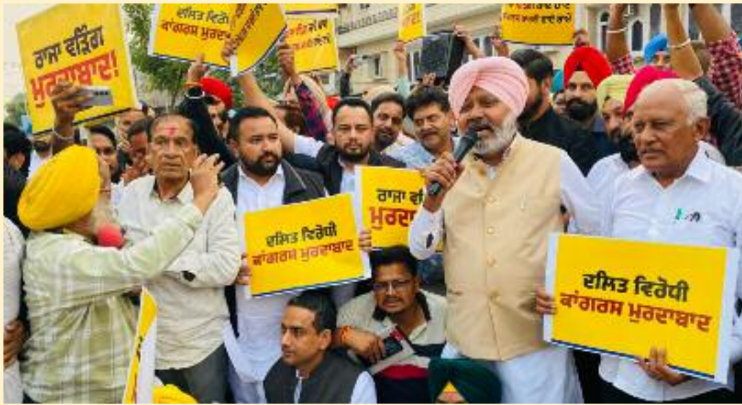
ਸ਼ਦਬਾਵਲੀ ਵਰਤਣ ਵਾਲੇ ਰਾਜਾ ਵੜਿੰਗ ਖ਼ਿਲਾਫ਼ ਰੋਸ ਪ੍ਰਦਰਸ਼ਨ ਕੀਤਾ। ਉਨ੍ਹਾਂ ਕਾਂਗਰਸ ਪਾਰਟੀ ਕੀਤੀ ਕਿ ਦਲਿਤਾਂ ਪ੍ਰਤੀ ਪ੍ਰਧਾਨ ਰਾਹੁਲ ਗਾਂਧੀ ਤੋਂ ਮੰਗ ਅਜਿਹੀ ਮਾੜੀ ਸੋਚ ਰੱਖਣ ਵਾਲੇ