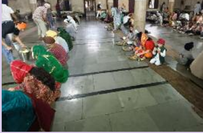
ਕੁਮਾਰ ਸਿੱਖ ਗੁਰਦੁਆਰਾ ਜੁਡੀਸ਼ਲ ਗੁਰੂ ਕਾ ਲੰਗਰ, ਪੂਰੀ ਛੋਲਿਆਂ ਦਾ ਕਮਿਸ਼ਨ ਅੰਮ੍ਰਿਤਸਰ ਹਾਜ਼ਰ ਸਨ। ਲੰਗਰ ਅਤੁੱਟ ਵਰਤਾਇਆ ਗਿਆ।