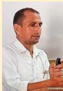
..... ਬੱਲੀ ਈਲਵਾਲ