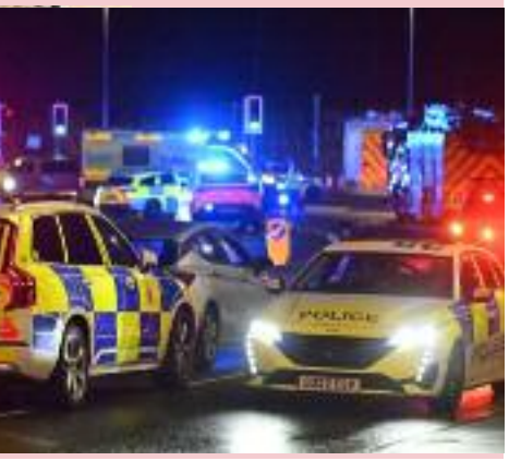
ਘਟਨਾ ਮੌਕੇ ਪੁੱਜੀ ਪੁਲਿਸ ਅਤੇ ਘਟਨਾ ਸਬੰਧੀ ਜਾਣਕਾਰੀ ਦਿੰਦੇ ਹੋਏ ਪੁਲਿਸ ਅਧਿਕਾਰੀ।