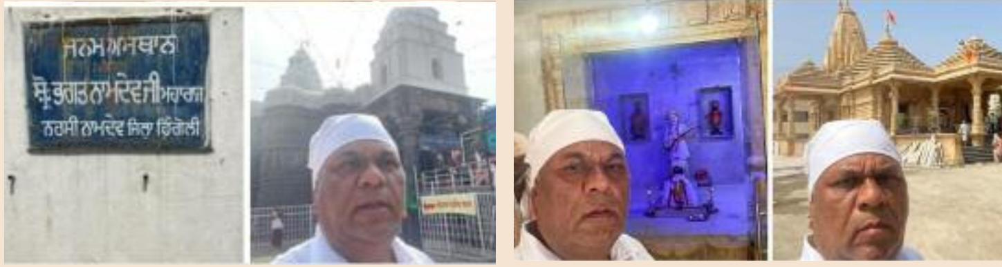
ਉਚਰੈ ਭਗਤ ਜਨਾ ਕੇ ਦੇਹਰਾ ਫਿਰੇ ਇਹ ਸੰਦੇਸ਼ ਉਹਨਾਂ ਨੇ ਮਹਾਰਾਸ਼ਟਰ ਦੀ ਧਰਤੀ ਤੋਂ ਸ਼ੁਰੂ ਕਰਕੇ ਪੰਜਾਬ ਦੇ ਵਿੱਚ ਘੁਮਾਣ ਜਿਲਾ ਗੁਰਦਾਸਪੁਰ ਵਿੱਚ ਆ