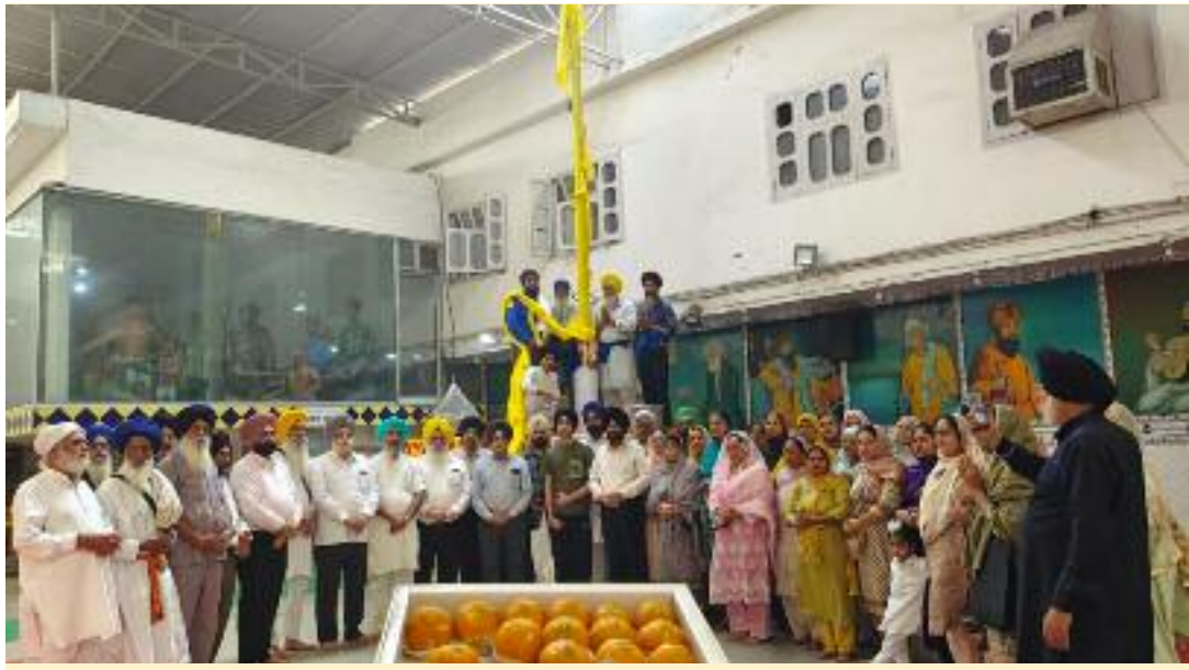
ਗੁਰਦੁਆਰਾ ਸ਼ਹੀਦਾਂ ਫੇਰੂਮਾਨ ਵਿਖੇ ਨਵੇਂ ਸਥਾਪਿਤ ਕੀਤੇ ਜਾ ਰਹੇ ਹੈਡਰੋਲਿਕ ਨਿਸ਼ਾਨ ਸਾਹਿਬ ਸਮੇਂ ਪ੍ਰਬੰਧਕ ਕਮੇਟੀ ਮੈਂਬਰ ਅਤੇ ਸੰਗਤਾਂ।

ਲੁਧਿਆਣਾ 2 ਨਵੰਬਰ (ਕਰਨੈਲ ਸਿੰਘ ਐੱਮ.ਏ.): ਪੰਨ ਪੰਨ ਸ੍ਰੀ ਗੁਰੂ ਨਾਨਕ ਦੇਵ ਜੀ ਦੇ ਪ੍ਰਕਾਸ਼ ਪੁਰਬ ਨੂੰ ਮੁੱਖ ਰੱਖਦਿਆਂ ਅੱਜ ਬ੍ਰਹਮ-ਗਿਆਨੀ, ਸੰਤ ਸ਼੍ਰੋਮਣੀ ਭਗਤ ਬਾਬਾ ਨਾਮਦੇਵ ਜੀ ਦੇ ਜਨਮ- ਦਿਹਾੜੇ ਮੌਕੇ ਸਿੱਖ ਸ਼ਹੀਦਾਂ ਦਾ ਯਾਦਗਾਰੀ ਅਸਥਾਨ ਗੁਰਦੁਆਰਾ ਸ਼ਹੀਦਾਂ ਫੇਰੂਮਾਨ (ਢੋਲੇਵਾਲ ਚੌਂਕ) ਵਿਖੇ ਗੁਰਦੁਆਰਾ ਪ੍ਰਬੰਧਕ ਕਮੇਟੀ ਅਤੇ ਗੁਰੂ ਨਾਨਕ ਨਾਮ ਲੇਵਾ ਸੰਗਤਾਂ ਦੇ ਵੱਡੇ ਸਹਿਯੋਗ ਨਾਲ 100 ਫੁੱਟ ਤੋਂ ਵੱਧ ਦੀ ਉਚਾਈ ਵਾਲੇ ਹੈਡਰੋਲਿਕ ਨਿਸ਼ਾਨ ਸਾਹਿਬ ਦੀ ਸਥਾਪਨਾ ਜੈਕਾਰਿਆਂ ਦੀ ਗੂੰਜ ਵਿੱਚ ਕੀਤੀ ਗਈ। ਨਿਸ਼ਾਨ ਸਾਹਿਬ ਦੀ ਸਥਾਪਨਾ