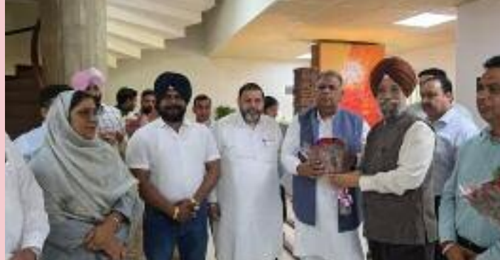
ਐਮ ਐਲ ਏ ਨਵਾਂਸ਼ਹਿਰ ਜੀ ਨੇ ਰੱਖੀਆਂ ਉਹਨਾਂ ਨੇ ਇਹਨਾਂ ਹੋਰ ਕਈ ਮੰਗਾਂ ਸਾਰੇ ਮਾਮਲਿਆਂ ਤੇ ਅਮਲ ਵਿਦਿਆਰਥੀਆਂ ਦੇ ਭਲੇ ਲਈ ਕਰਨ ਦਾ ਭਰੋਸਾ ਦਿੱਤਾ।