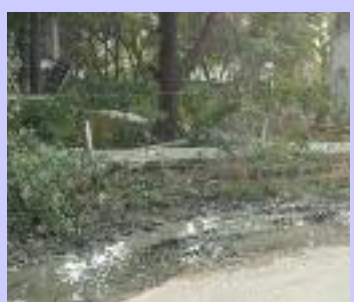
ਪੀਣ ਵਾਲੇ ਪਾਣੀ ਦੀਆਂ ਹੋ ਰਹੀ ਲੀਕੇਜ਼ ਦੀਆਂ ਤਸਵੀਰਾਂ।

ਇਸ ਪ੍ਰਤੀ ਗੰਭੀਰ ਨਹੀਂ ਹੈ। ਸਾਫ ਪਾਣੀ ਦੀ ਦੁਰਵਰਤੋਂ ਨੂੰ ਰੋਕਣ ਲਈ ਵਿਭਾਗ ਲੋਕਾਂ ਨੂੰ ਕਈ ਤਰੀਕਿਆਂ ਨਾਲ ਜਾਗਰੂਕ ਕਰਦਾ ਹੈ ਪ੍ਰੰਤੂ ਲੀਕੇਜ਼ਾਂ ਕਾਰਨ ਬਰਬਾਦ ਹੋ ਰਹੇ ਪਾਣੀ ਵੱਲ ਵਿਭਾਗ ਦੀ ਨਜ਼ਰ ਨਹੀਂ ਜਾਂਦੀ। ਇੱਥੇ ਇਹ ਵੀ ਦੱਸਿਆ ਜਾਂਦਾ ਹੈ ਕਿ ਕਾਠਗੜ੍ਹ ਦੇ ਜਲ ਘਰ ਦੀ ਸਾਫ ਸਫਾਈ ਦਾ ਵੀ ਮੰਦਾ ਹਾਲ ਹੈ ਅਤੇ ਇਹ ਵੀ ਸ਼ੰਕਾ ਜਾਹਿਰ ਕੀਤੀ ਜਾ ਰਹੀ ਹੈ ਕਿ ਪਾਣੀ ਦੀ ਟੈਂਕੀ ਦੀ ਸਾਫ ਸਫਾਈ ਨੂੰ ਵੀ ਸ਼ਾਇਦ