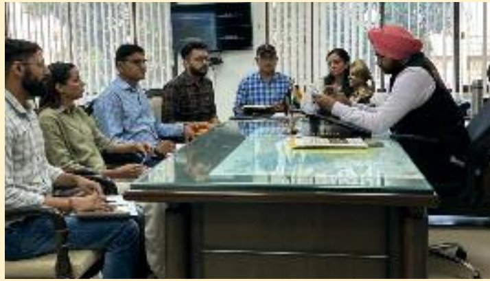
ਅਤੇ ਸੁਪਰੀਮ ਕੋਰਟ ਦੀਆਂ ਹਦਾਇਤਾਂ ਅਨੁਸਾਰ ਝੋਨੇ ਦੀ

ਪਰਾਲੀ ਨੂੰ ਅੱਗ ਲਗਾਉਣ 'ਤੇ ਪੂਰਨ ਪਾਬੰਦੀ ਲਗਾਈ ਗਈ ਹੈ ਜਿਸ ਦੀ ਪਾਲਣਾ ਨੂੰ ਹਰ ਹਾਲ ਯਕੀਨੀ ਬਣਾਇਆ ਜਾਵੇ। ਅਧਿਕਾਰੀਆਂ ਨੇ ਮੀਟਿੰਗ ਵਿੱਚ ਦੱਸਿਆ ਕਿ ਇਸ ਸਾਲ ਹੁਣ ਤੱਕ ਜ਼ਿਲ੍ਹੇ ਦੇ ਇੱਕ ਕਿਸਾਨ ਵੱਲੋਂ ਝੋਨੇ ਦੀ ਪਰਾਲੀ ਨੂੰ ਅੱਗ ਲਗਾਉਣ 'ਤੇ 10 ਹਜ਼ਾਰ ਰੁਪਏ ਵਾਤਾਵਰਣ ਮੁਆਵਜ਼ਾ, ਲਾਲ ਐਂਟਰੀ ਅਤੇ ਐਫ. ਆਈ.ਆਰ.