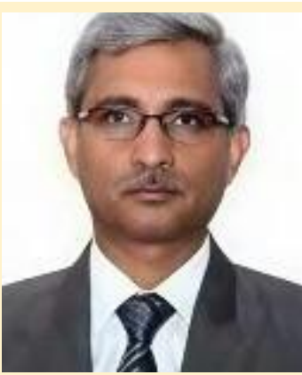
(ਗੈਰ-ਕੰਪਾਊਂਡੇਬਲ ਨੂੰ ਛੱਡ ਕੇ), ਬਿਜਲੀ ਦੇ ਬਿੱਲ

ਸਿਵਲ ਕੇਸ, ਰੈਂਟ ਕੇਸ, ਐਮ.ਏ.ਸੀ.ਟੀ ਕੇਸ, ਅਪਰਾਧਿਕ ਕੰਪਾਊਂਡੇਬਲ ਕੇਸ, ਮਾਲੀਆ ਕੇਸ, 138 ਨੈਗੋਸ਼ੀਏਬਲ ਇੰਸਟ੍ਰੂਮੈਂਟ ਐਕਟ, ਪਰਿਵਾਰਕ ਮਾਮਲੇ, ਲੇਬਰ ਮਾਮਲੇ, ਬੈਂਕ ਕੇਸ (ਲੰਬਿਤ ਅਤੇ ਪ੍ਰੀ-ਲਿਟੀਗੇਟਿਵ) ਟੈਲੀਕਾਮ ਕੰਪਨੀਆਂ ਦੇ ਕੇਸ, ਪਾਣੀ ਦੇ ਬਿੱਲ