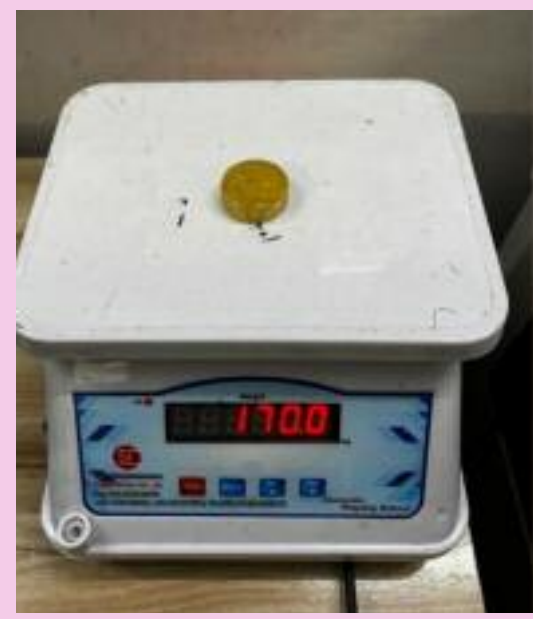
ਦੀਆਂ ਧਾਰਵਾਂ ਤਹਿਤ ਜਬਤ ਕਰ ਲਿਆ ਗਿਆ।

ਨਵੀਂ ਦਿੱਲੀ । ਦਿੱਲੀ ਦੇ ਇੰਦਰਾ ਗਾਂਧੀ ਇੰਟਰਨੈਸ਼ਨਲ ਹਵਾਈ ਅੱਡੇ 'ਤੇ ਦਿੱਲੀ ਕਸਟਮਜ਼ ਨੇ ਇਕ ਯਾਤਰੀ ਨੂੰ 170 ਗ੍ਰਾਮ ਸੋਨੇ ਸਮੇਤ ਗ੍ਰਿਫ਼ਤਾਰ ਕੀਤਾ ਹੈ। ਇਹ ਸੋਨਾ ਦੁਬਈ ਤੋਂ ਫਲਾਈਟ ਏਆਈ-996 'ਤੇ ਭਾਰਤ ਆਏ ਯਾਤਰੀ ਕੋਲੋਂ ਬਰਾਮਦ ਕੀਤਾ ਗਿਆ। ਯਾਤਰੀ ਦਾ ਸਾਵਧਾਨੀ ਨਾਲ ਫਲਾਈਟ ਗੇਟ ਤੱਕ ਪਿੱਛਾ ਕੀਤਾ ਗਿਆ ਅਤੇ ਯਾਤਰੀ ਨੂੰ ਗਰੀਨ ਚੈਨਲ ਰਾਹੀਂ ਬਾਹਰ ਨਿਕਲਣ ਦੀ ਕੋਸ਼ਿਸ਼ ਕਰਦੇ ਸਮੇਂ ਉਸ ਨੂੰ ਰੋਕਿਆ ਗਿਆ। ਉਸ ਦੇ ਸਮਾਨ ਦੀ ਐਕਸ ਰੇਅ ਜਾਂਚ ਦੌਰਾਨ ਅਧਿਕਾਰੀਆਂ ਨੂੰ ਕੁੱਝ ਸ਼ੱਕੀ ਤਸਵੀਰਾਂ ਮਿਲੀਆਂ। ਬਰੀਕੀ ਨਾਲ ਕੀਤੀ ਗਈ ਜਾਂਚ ਦੌਰਾਨ ਪਲਾਸਟਿਕ ਦੀ ਬੋਤਲ ਦੇ ਢੱਕਣ ਹੇਠ ਇਕ ਸੋਨੇ ਦੀ ਗੋਦ ਨੂੰ ਚਲਾਕੀ ਨਾਲ ਲੁਕਾਇਆ ਗਿਆ ਸੀ। ਬਰਾਮਦ ਕੀਤੇ ਗਏ ਸੋਨੇ ਦਾ ਭਾਰ 170 ਗ੍ਰਾਮ ਸੀ, ਜਿਸ ਨੂੰ ਕਸਟਮ ਐਕਟ1962