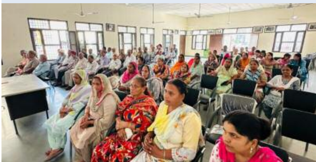
ਮੈਡੀਕਲ ਕੈਂਪ ਦੀਆਂ ਕੁਝ ਝਲਕੀਆਂ।