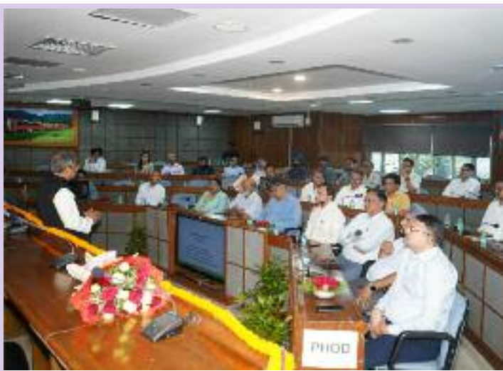
ਵਿੱਚ ਚੌਕਸੀ ਅਤੇ ਨੈਤਿਕਤਾ ਜਾਗਰੂਕਤਾ ਮੁਹਿੰਮਾਂ ਵੀ ਬਾਰੇ ਸੰਵੇਦਨਸ਼ੀਲ ਬਣਾਉਣ ਲਈ ਨੇੜਲੇ ਵਿਦਿਅਕ ਸੰਸਥਾਵਾਂ ਵਿੱਚ ਵਿਸ਼ੇਸ਼ ਜਾਗਰੂਕਤਾ ਹਫ਼ਤਾ ਭ੍ਰਿਸ਼ਟਾਚਾਰ

ਵਿਦਿਆਰਥੀਆਂ ਅਤੇ ਜਨਤਾ ਵਿੱਚ ਨੈਤਿਕ ਆਚਰਣ ਅਤੇ ਚੰਗੇ ਸ਼ਾਸਨ ਦੀ ਮਹੱਤਤਾ ਬਾਰੇ ਜਾਗਰੂਕਤਾ ਫੈਲਾਉਣ ਲਈ ਵੱਖ-ਵੱਖ ਪ੍ਰੋਗਰਾਮ ਆਯੋਜਿਤ ਕੀਤੇ ਜਾਣਗੇ। ਉਦਘਾਟਨ ਸਮਾਰੋਹ 27 ਅਕਤੂਬਰ 2025 ਨੂੰ ਆਯੋਜਿਤ ਕੀਤਾ ਜਾਵੇਗਾ, ਜਿਸ ਵਿੱਚ ਸਾਰੇ ਅਧਿਕਾਰੀਆਂ ਅਤੇ ਸਟਾਫ ਨੂੰ ਇਮਾਨਦਾਰੀ ਦੀ ਸਹੂ ਚੁਕਾਈ ਜਾਵੇਗੀ। ਹਫਤੇ ਭਰ ਸੈਮੀਨਾਰ, ਮੁਕਾਬਲੇ, ਵਰਕਸ਼ਾਪਾਂ ਅਤੇ ਆਊਟਰੀਚ ਪ੍ਰੋਗਰਾਮਾਂ ਸਮੇਤ ਕਈ ਗਤੀਵਿਧੀਆਂ ਚਲਾਈਆਂ ਜਾਣਗੀਆਂ। ਰੋਜ਼ਾਨਾ ਜੀਵਨ