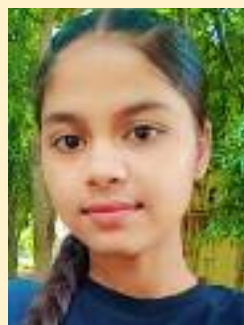
ਸ਼ੀਲਪਾ ਗੁਰੂ ਨਾਨਕ ਦੇਵ ਇੰਜੀਨੀਅਰਿੰਗ ਕਾਲਜ ਲੁਧਿਆਣਾ

ਬਚਪਨ 'ਚ ਦਿਵਾਲੀ ਦਾ ਹੁੰਦਾ ਸੀ ਬੜਾ ਚਾਅ, ਮਾਂ ਦੇ ਹੱਥਾਂ ਦੀ ਮਠਿਆਈ ਦੋਸਤਾਂ ਦਾ ਸਾਥ, ਹੱਥਾਂ ਚ ਚਮਕਦੀ ਹੋਈ ਫੁੱਲ ਝੜੀ ਚਿਹਰੇ 'ਤੇ ਖੁਸ਼ੀ ਚਮਕ ਤੇ ਮੁਸਕਾਨ , ਨਾਲ ਜਦੋਂ ਰਲਦਾ ਸੀ ਸਾਰਾ ਪਰਿਵਾਰ, ਦਿਵਾਲੀ ਦਾ ਤਿਉਹਾਰ ਬਣ ਜਾਂਦਾ ਸੀ ਯਾਦਗਾਰ । ਆਉਂਦੀ ਤਾਂ ਹੁਣ ਵੀ ਦਿਵਾਲੀ ਏ ਹਰ ਸਾਲ , ਪਰ ਮਿਠਾਈ ਹੁਣ ਤਸਵੀਰ ਬਣ ਕੇ ਰਹਿ ਗਈ , ਮਿਲਣੀਆਂ ਹੋ ਗਈਆਂ ਫੋਨ ਕਾਲਾਂ 'ਤੇ । ਇਹ ਖੁਸ਼ੀ ਪਿਆਰ ਤੇ ਮਿਲਾਪ ਦੇ ਪ੍ਰਤੀਕ ਤਿਉਹਾਰ, ਰਹਿ ਗਏ ਬਸ ਹੁਣ ਰਸਮ ਰਿਵਾਜ ਤੇ ਖਿਆਲਾ 'ਚ । ਮੇਰਾ ਤਾਂ ਬਸ ਇਹੋ ਸੁਝਾਓ, ਆਪਣੇ ਆਪ ਨੂੰ ਇਨਾ ਵਿਅਸਤ ਨਾ ਬਣਾਓ, ਤਿਉਹਾਰ ਦੇ ਮਹੱਤਵ ਨੂੰ ਐਵੇਂ ਨਾ ਗਵਾਓ, ਇਹੀ ਤਾਂ ਹੁੰਦੇ ਨੇ ਖੁਸ਼ੀ ਤੇ ਮਿਲਾਪ ਦੇ ਮੌਕੇ, ਇਹਨਾਂ ਅਨਮੋਲ ਪਲਾਂ ਨੂੰ ਰਲ ਮਿਲ ਕੇ ਮਨਾਓ ।