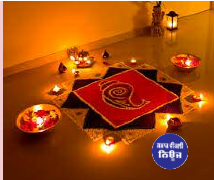
ਲੈ ਲਿਆ ਹੈ। ਅਸੀਂ ਇੱਕ ਦਿਨ ਸਿਹਤ ਅਤੇ ਵਾਤਾਵਰਣ ਨਾਲ ਦੀਆਂ ਖੁਸ਼ੀਆਂ ਲਈ ਆਪਣੀ ਖਿਲਵਾੜ ਕਰ ਰਹੇ ਹਾਂ। ਜਿਸ ਬਾਰੇ

ਦੀਵਾਲੀ ਚੱੜਦੀ ਸੀ। ਅੱਠ - ਦਸ ਦਿਨ ਤੱਕ ਦੀਵਾਲੀ ਦੀਆਂ ਖੁਸ਼ੀਆਂ ਰਹਿੰਦੀਆਂ ਸਨ। ਪ੍ਰਦੂਸ਼ਣ ਰਹਿਤ ਸਰੋਂ ਦੇ ਤੇਲ ਦੀ ਦੀਪਮਾਲਾ ਕੀਤੀ ਜਾਂਦੀ ਸੀ। ਚਿੜਚਿੜਾਂ ਤੇ ਹਲਕੇ ਪਟਾਕੇ ਚਲਾਏ ਜਾਂਦੇ ਸਨ। ਇਹ ਜਾਣਦੇ ਹੋਏ ਵੀ ਕਿ ਬਜ਼ਾਰ 'ਚ ਨਕਲੀ ਮਿਠਾਆਈਆਂ, ਜੋ ਜ਼ਹਿਰ ਤੋਂ ਘੱਟ ਨਹੀਂ, ਧੜਲੇ ਨਾਲ ਵਿਕ ਰਹੀਆਂ ਹਨ, ਅਸੀਂ ਆਪ ਬੋਸ਼ਕ ਨਾਂ ਖਾਈਏ, ਪਰ ਆਪਣੇ ਅਜੀਜ਼ ਦੋਸਤਾਂ ਤੇ ਰਿਸ਼ਤੇਦਾਰਾਂ ਨੂੰ ਖੁਸ਼ ਖਿਲਾ ਰਹੇ ਹਾਂ। ਅੱਜ ਆਧੁਨਿਕਤਾ ਨੇ ਦੀਵਾਲੀ ਨੂੰ ਆਪਣੀ ਲਪੇਟ ਚ