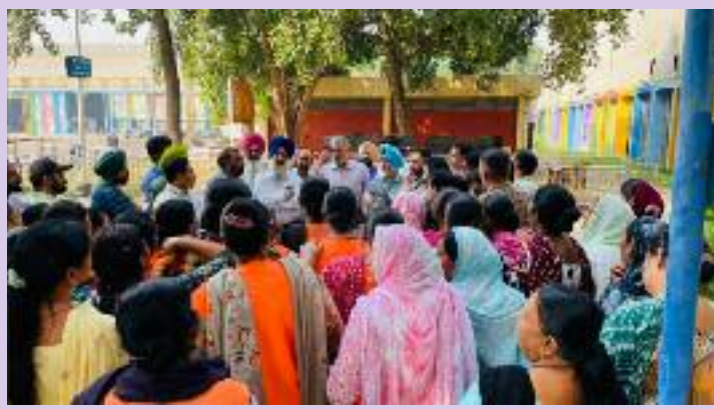
ਕਰਮਚਾਰੀ ਇਕਜੁੱਟ ਹੋ ਕੇ ਸ਼ਾਮਲ ਹੋਏ। ਕਰਮਚਾਰੀਆਂ ਦੀ ਇਸ ਸ਼ੋਸ਼ਣ ਵਾਲੀ ਸਥਿਤੀ ਦਾ ਨੋਟਿਸ ਲੈਂਦੇ ਹੋਏ, ਆਰ ਸੀ ਐਫ ਇੰਪਲਾਈਜ਼ ਯੂਨੀਅਨ ਨੇ ਤੁਰੰਤ ਦਖਲ ਦਿੱਤਾ ਅਤੇ ਸਬੰਧਤ ਅਧਿਕਾਰੀਆਂ ਨੂੰ

ਕਰਮਚਾਰੀਆਂ ਨੇ ਇਹ ਗੰਭੀਰ ਦੋਸ਼ ਲਾਇਆ ਕਿ ਠੇਕੇਦਾਰ ਨਾ ਸਿਰਫ ਉਨ੍ਹਾਂ ਦੀ ਤਨਖਾਹ ਦੇਣ ਵਿੱਚ ਦੇਰੀ ਕਰ ਰਿਹਾ ਹੈ। ਸਗੋਂ ਸਭ ਤੋਂ ਚਿੰਤਾਜਨਕ ਗੱਲ ਇਹ ਹੈ ਕਿ ਉਨ੍ਹਾਂ ਦੇ ਪਿਛਲੇ ਛੇ ਮਹੀਨਿਆਂ ਤੋਂ ਪੀ ਐਫ ਦਾ ਹਿੱਸਾ ਜਮ੍ਹਾਂ ਨਹੀਂ ਕਰਵਾਇਆ ਗਿਆ ਹੈ। ਜੋ ਕਿ ਕਿਰਤ ਕਾਨੂੰਨਾਂ ਦਾ ਸਿੱਧਾ ਉਲੰਘਣ ਹੈ ਅਤੇ ਕਰਮਚਾਰੀਆਂ ਦਾ ਵਿੱਤੀ ਸ਼ੋਸ਼ਣ ਹੈ। ਇਸ ਵਿਰੋਧ ਪ੍ਰਦਰਸ਼ਨ ਵਿੱਚ ਸ਼ੈਲ ਸ਼ੌਧ, ਮੈਨੂਫੈਕਚਰਿੰਗ ਸ਼ੌਧ ਅਤੇ ਬੋਗੀ ਸ਼ੌਧ ਦੇ ਸਾਰੇ ਸਫ਼ਾਈ