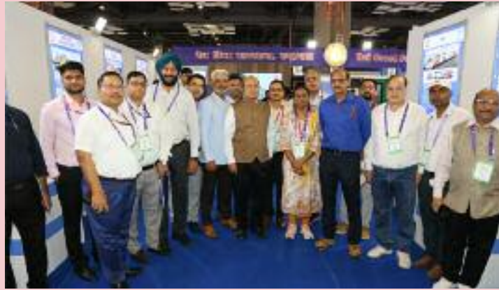
ਵਚਨਬੱਧਤਾ ਨੂੰ ਦਰਸਾਉਂਦੇ ਤਕਨੀਕੀ ਨਵੀਨਤਾਵਾਂ ਨੂੰ ਹਨ। ਇਸ ਤੋਂ ਇਲਾਵਾ, ਦਰਸਾਉਂਦੇ ਵਰਕਿੰਗ ਮਾਡਲ ਵੀ ਡਿੱਬਿਆਂ ਵਿੱਚ ਕੀਤੀਆਂ ਸਟਾਲ ਵਿੱਚ ਪ੍ਰਦਰਸ਼ਿਤ ਕੀਤੇ ਨਵੀਆਂ ਸੁਵਿਧਾਵਾਂ ਅਤੇ ਗਏ। ਬਹੁਤ ਸਾਰੇ ਵਿਸ਼ੇਸ਼

ਇਸ ਪ੍ਰਦਰਸ਼ਨੀ ਦਾ ਸਭ ਤੋਂ ਵੱਡਾ ਆਕਰਸ਼ਣ ਪ੍ਰਸਿੱਧ ਵੰਦੇ ਭਾਰਤ ਐਕਸਪ੍ਰੈੱਸ ਦਾ ਸਕੇਲ ਮਾਡਲ ਸੀ, ਜਿਸ ਨੇ ਆਪਣੀ ਆਕਰਸ਼ਕ ਡਿਜ਼ਾਈਨ ਅਤੇ ਅਧੁਨਿਕ ਤਕਨੀਕ ਨਾਲ ਲੋਕਾਂ ਦਾ ਧਿਆਨ ਖਿੱਚ ਲਿਆ। ਵੰਦੇ ਭਾਰਤ ਦੇ ਨਾਲ-ਨਾਲ, ਆਰ.ਸੀ.ਐਫ. ਨੇ ਹੋਰ ਕਈ ਅਧੁਨਿਕ ਰੇਲ ਡਿੱਬਿਆਂ ਦੇ ਮਾਡਲ ਵੀ ਪ੍ਰਦਰਸ਼ਿਤ ਕੀਤੇ, ਜੋ ਨਵੀਂ ਸੋਚ, ਯਾਤਰੀ ਸੁਵਿਧਾ ਅਤੇ ਸੁਰੱਖਿਆ ਪ੍ਰਤੀ ਉਸ ਦੀ