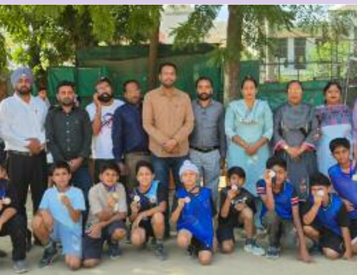
ਦੀ ਟੀਮ ਦੂਸਰੇ ਸਥਾਨ ਤੇ ਪ੍ਰਦਰਸ਼ਨ ਕੀਤਾ। ਰਹੀ ਅਤੇ ਸ਼ਾਨਦਾਰ ਇਸ ਮੌਕੇ ਖੇਡਾਂ ਦੇ ਕਨਵੀਨਰ