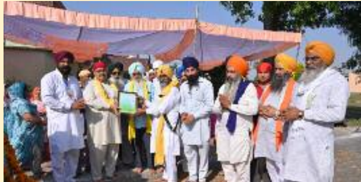
ਪਾਲਕਦੀਮ, ਕੰਗ ਜਗੀਰ, ਗੁਰਦੁਆਰਾ ਭਾਈ ਬਾਲਾ ਸਾਹਿਬ,