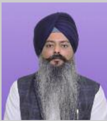
ਕਰਕੇ ਬਾਹਰ ਚਲੇ ਗਏ ਸਨ ਅਤੇ ਚੋਣ ਕਮਿਸ਼ਨਰ ਕੋਲ ਝੀਂਡਾ ਦੀ ਪ੍ਰਧਾਨਗੀ ਰੱਦ ਕਰਨ ਵਾਸਤੇ

ਦੇ ਪ੍ਰਧਾਨ ਬਣੇ ਰਹਿਣ ਬਾਰੇ ਫੁਪੀ ਬਿਆਨਬਾਜ਼ੀ ਗੁੰਮਰਾਹਕੁੰਨ ਹੈ ਜਿਸ ਵਿੱਚ ਕਿਹਾ ਗਿਆ ਕਿ ਪਿਛਲੇ ਦਿਨਾਂ ਤੋਂ ਦੋਨਾਂ ਧਿਰਾਂ ਵਿਚਕਾਰ ਚੱਲ ਰਿਹਾ ਮੱਤਭੇਦ ਖਤਮ ਹੋ ਕੇ ਸਮਝੌਤਾ ਹੋ ਗਿਆ ਹੈ ਤੇ ਝੀਂਡਾ ਪ੍ਰਧਾਨ ਬਣੇ ਰਹਿਣ-ਗੇ ਜਦੋਂ ਕਿ ਸਮਝੌਤਾ ਪਹਿਲਾਂ ਤੋਂ ਨਰਾਜ ਚੱਲ ਰਹੀ ਤੀਜੀ ਧਿਰ ਅਕਾਲੀ ਦਲ ਬਾਦਲ ਗੁਰੂਪ ਅਤੇ ਕੁੱਝ ਅਜਾਦ ਮੈਂਬਰਾਂ ਦੇ ਗੁਰੂਪ ਨਾਲ ਹੋਇਆ ਹੈ ਜੋ ਝੀਂਡਾ ਦੇ ਪ੍ਰਧਾਨ ਬਣਨ ਵੇਲੇ ਜਰਨਲ ਹਾਊਸ ਦਾ ਬਾਈਕਾਟ