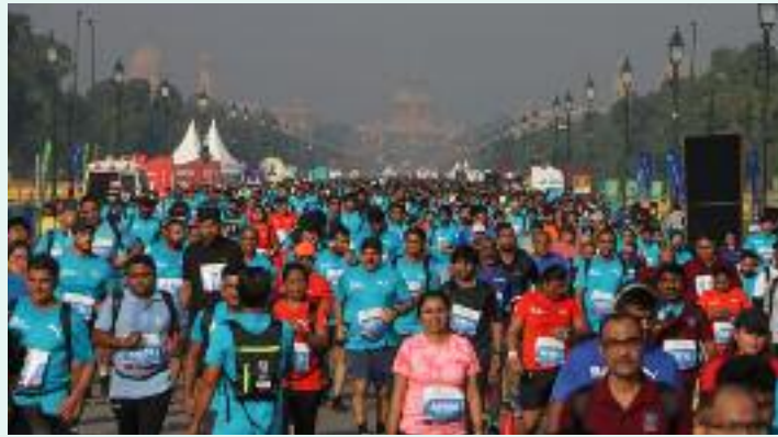
ਏ ਅੰਤ ਤੱਕ ਹਵਾ ਵਿੱਚ ਪ੍ਰਦੂਸ਼ਣ ਜਾਰੀ ਰਹਿਣ ਦੀ ਭਵਿੱਖਬਾਣੀ ਕੀਤੀ ਗਈ ਹੈ। ਦਿੱਲੀ ਅੰਦਰ ਵਧਦੇ ਪ੍ਰਦੂਸ਼ਣ

ਔਸਤ 193 ਰਹੀ ਸੀ। ਦੀਵਾਲੀ ਤੋਂ ਪਹਿਲਾਂ ਦਿੱਲੀ ਦੀ ਹਵਾ ਦੀ ਗੁਣਵੱਤਾ ਵਿਗੜਦੀ ਜਾ ਰਹੀ ਹੈ। ਅਕਤੂਬਰ ਦੇ ਸ਼ੁਰੂ ਵਿੱਚ ਏ ਕਿਉ ਆਈ ਵਧਣ ਦਾ ਕਾਰਨ ਤਾਪਮਾਨ ਵਿੱਚ ਗਿਰਾਵਟ, ਧੁੰਦ ਅਤੇ ਰੁਕੀਆਂ ਹਵਾਵਾਂ ਹਨ, ਜਿਸ ਕਾਰਨ ਆਸਮਾਨ ਵਿੱਚ ਧੂੰਆਂ ਚੜ੍ਹਿਆ ਹੋਇਆ ਹੈ। ਦਿੱਲੀ ਨਿਵਾਸੀਆਂ ਲਈ ਸਿਹਤ ਸਬੰਧੀ ਚਿੰਤਾਵਾਂ ਵਧ ਰਹੀਆਂ ਹਨ ਕਿਉਂਕਿ ਹਫ਼ਤੇ