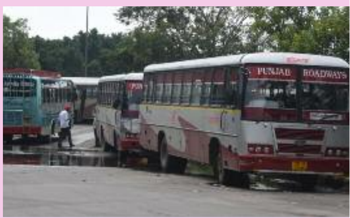
ਜਿਸ ਵਿੱਚ ਤਾਜ਼ਾ ਘਟਨਾ ਦਾ ਜ਼ਿਕਰ ਕੀਤਾ ਗਿਆ, ਜਦੋਂ ਇੱਕ ਸਿਆਸੀ ਰੈਲੀ ਵਿੱਚ ਗੋਲੀਬਾਰੀ ਹੋਈ ਸੀ। ਸੁਰੱਖਿਆ ਮੁੱਦਿਆਂ ਦਾ ਹਵਾਲਾ ਦਿੰਦੇ ਹੋਏ ਯੂਨੀਅਨ ਨੇ ਐਲਾਨ ਕੀਤਾ ਕਿ ਜਦੋਂ ਤੱਕ ਉਨ੍ਹਾਂ ਦੇ ਮਸਲੇ ਹੱਲ ਨਹੀਂ ਹੁੰਦੇ ਉਹ ਕਿਸੇ ਵੀ ਸਿਆਸੀ ਰੈਲੀ ਵਿੱਚ ਵਾਹਨ ਨਹੀਂ ਲੈ ਕੇ ਜਾਣਗੇ।

ਫ਼ਰੀਦਕੋਟ। ਪੰਜਾਬ ਰੋਡਵੇਜ਼/ਪੀ ਆਰ ਟੀ ਸੀ ਠੇਕਾ ਮੁਲਾਜ਼ਮ ਯੂਨੀਅਨ ਨੇ ਇੱਕ ਵੱਡੇ ਨੀਤੀਗਤ ਬਦਲਾਅ ਦਾ ਐਲਾਨ ਕਰਦਿਆਂ ਪੀ ਆਰ ਟੀ ਸੀ ਦੇ ਜਨਰਲ ਮੈਨੇਜਰ ਨੂੰ ਰਸਮੀ ਤੌਰ 'ਤੇ ਸੂਚਿਤ ਕੀਤਾ ਹੈ ਕਿ ਇਸ ਦੇ ਮੈਂਬਰ ਹੁਣ ਸਿਆਸੀ ਰੈਲੀਆਂ ਲਈ ਬੱਸਾਂ ਨਹੀਂ ਦੇਣਗੇ। ਠੇਕਾ ਕਰਮਚਾਰੀ ਆਪਣਾ ਕੰਮ ਸਿਰਫ਼ ਚੋਜ਼ਾਨਾ ਦੇ ਰੂਟ ਡਿਊਟੀਆਂ ਤੱਕ ਹੀ ਸੀਮਤ ਰੱਖਣਗੇ। ਯੂਨੀਅਨ ਦਾ ਇਹ ਫ਼ੈਸਲਾ ਲਗਾਤਾਰ ਵਾਅਦੇ ਕਰਨ ਦੇ ਬਾਵਜੂਦ ਸਰਕਾਰ ਵੱਲੋਂ ਉਨ੍ਹਾਂ ਦੀਆਂ ਲੰਮੇ ਸਮੇਂ ਤੋਂ ਲਟਕਦੀਆਂ ਮੰਗਾਂ ਨੂੰ ਹੱਲ ਕਰਨ ਵਿੱਚ ਲਗਾਤਾਰ ਅਸਫਲ ਰਹਿਣ ਕਾਰਨ ਲਿਆ ਗਿਆ ਹੈ। ਸਭ ਤੋਂ ਮਹੱਤਵਪੂਰਨ ਗੱਲ ਇਹ ਹੈ ਕਿ ਕਰਮਚਾਰੀਆਂ ਨੇ ਗੰਭੀਰ ਸੁਰੱਖਿਆ ਚਿੰਤਾਵਾਂ ਦਾ ਵੀ ਹਵਾਲਾ ਦਿੱਤਾ।