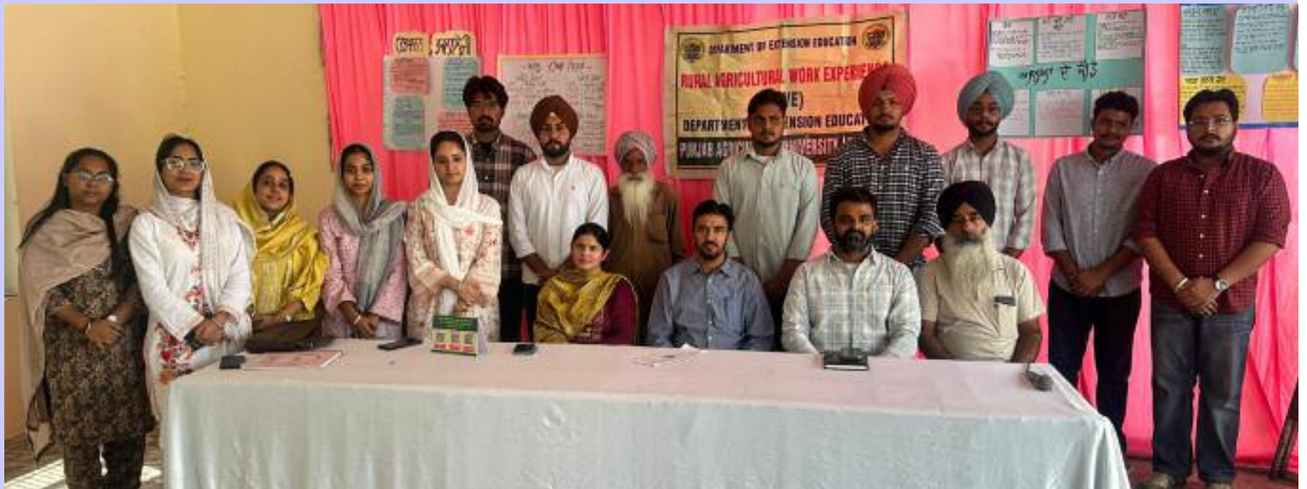
ਆਲੂਆਂ ਦੀ ਫਸਲ ਸੰਬੰਧੀ ਲਗਾਏ ਗਏ ਜਾਗਰੂਕਤਾ ਕੈਂਪ ਦੌਰਾਨ ਯੂਨੀਵਰਸਿਟੀ ਦੇ ਅਧਿਆਪਕ ਅਤੇ ਵਿਦਿਆਰਥੀ ਨਾਲ ਪਿੰਡ ਵਾਸੀ।