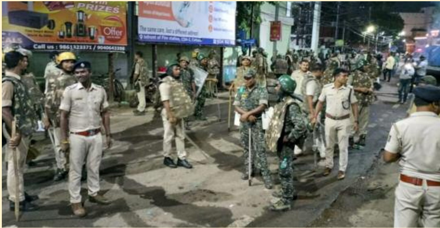
ਵਿਵਸਥਾ ਦੀ ਸਥਿਤੀ ਨੂੰ ਦੇਖਦਿਆਂ ਰਾਜ ਸਰਕਾਰ ਨੇ ਕਟਕ ਨਗਰ ਨਿਗਮ, ਕਟਕ ਵਿਕਾਸ ਅਥਾਰਟੀ (ਸੀ ਡੀ ਏ) ਅਤੇ ਨਾਲ ਲੱਗਦੇ 42 ਮੌਜ਼ਾ ਖੇਤਰ ਦੇ ਅਧੀਨ ਆਉਂਦੇ ਇਲਾਕਿਆਂ ਵਿੱਚ ਐਤਵਾਰ ਮੁਅੱਤਲ ਕਰ ਦਿੱਤੀਆਂ ਹਨ। ਸ਼ਾਮ 7 ਵਜੇ ਤੋਂ ਸੋਮਵਾਰ ਸ਼ਾਮ 7 ਵਜੇ ਤੱਕ ਇੰਟਰਨੈੱਟ ਸੇਵਾਵਾਂ ਅਧਿਕਾਰੀਆਂ ਅਨੁਸਾਰ ਜਦੋਂ ਪੁਲੀਸ ਨੇ ਵਿਸ਼ਵ ਹਿੰਦੂ ਪਰਿਸ਼ਦ

ਕਟਕ/ਭੁਬਨੇਸ਼ਵਰ। ਦੁਰਗਾ ਮੁਰਤੀ ਜਲ ਪ੍ਰਵਾਹ ਕਰਨ ਦੌਰਾਨ ਦੋ ਦਿਨ ਪਹਿਲਾਂ ਦੇ ਧੜਿਆਂ ਵਿਚਾਲੇ ਹੋਈ ਹਿੰਸਾ ਮਗਰੋਂ ਅੱਜ ਤਾਜ਼ਾ ਘਟਨਾਵਾਂ ਕਾਰਨ ਮਾਹੌਲ ਮੁੜ ਤਣਾਅਪੂਰਨ ਬਣ ਗਿਆ। ਇਸ ਦੌਰਾਨ ਉੜੀਸਾ ਦੇ ਮੁੱਖ ਮੰਤਰੀ ਮੋਹਨ ਚਰਨ ਮਾਝੀ ਅਤੇ ਬੀ ਜੇ ਡੀ ਮੁਖੀ ਨਵੀਨ ਪਟਨਾਇਕ ਨੇ ਨਾਗਰਿਕਾਂ ਨੂੰ ਫਿਰਕੂ ਸਦਭਾਵਨਾ ਬਣਾਈ ਰੱਖਣ ਦੀ ਅਪੀਲ ਕੀਤੀ ਹੈ। ਮੁੱਖ ਮੰਤਰੀ ਮਾਝੀ ਅਤੇ ਪਟਨਾਇਕ ਦੀ ਇਹ ਅਪੀਲ ਸ਼ਾਮ ਨੂੰ ਵਿਸ਼ਵ ਹਿੰਦੂ ਪਰਿਸ਼ਦ (ਵੀ ਐੱਚ ਪੀ) ਵੱਲੋਂ ਜ਼ਿਲ੍ਹਾ ਪ੍ਰਸ਼ਾਸਨ ਦੇ ਹੁਕਮਾਂ ਦੀ ਉਲੰਘਣਾ ਕਰਦਿਆਂ ਮੋਟਰਸਾਈਕਲ ਰੈਲੀ ਕਰਨ ਤੋਂ ਬਾਅਦ ਆਈ ਹੈ। ਵੀ ਐੱਚ ਪੀ ਨੇ ਝੜਪ ਦੇ ਵਿਰੋਧ ਵਿੱਚ 6 ਅਕਤੂਬਰ ਨੂੰ ਸ਼ਹਿਰ ਵਿੱਚ 12 ਘੰਟੇ ਦੇ ਬੰਦ ਦਾ ਸੱਦਾ ਦਿੱਤਾ ਹੈ। ਮੌਜੂਦਾ ਕਾਨੂੰਨ