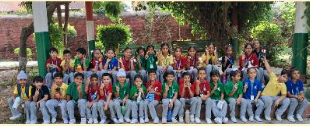
ਬਾਰਾਂਦਰੀ ਗਾਰਡਨ ਵਿਖੇ ਆਪਣੇ ਅਧਿਆਪਕਾਂ ਨਾਲ ਵਿਦਿਆਰਥੀ।

ਸਿੰਘ, ਮਹਾਤਮਾ ਗਾਂਧੀ ਅਤੇ ਲਾਲ ਬਹਾਦਰ ਸ਼ਾਸਤਰੀ ਦੇ ਜੀਵਨ ਬਾਰੇ ਵਿਚਾਰ ਸਾਂਝੇ ਕੀਤੇ, ਇਨ੍ਹਾਂ ਮਹਾਨ ਸ਼ਖਸੀਅਤਾਂ ਵਲੋਂ ਦਰਸਾਏ ਮਾਰਗ 'ਤੇ ਚੱਲਣ ਦੀ ਪ੍ਰੇਰਨਾ ਲਈ। ਪ੍ਰਾਰਥਨਾ ਸਭਾ ਦੌਰਾਨ, ਉਨ੍ਹਾਂ ਨੇ ਨਵਰਾਤਰੀ ਅਤੇ ਦੁਸਹਿਰਾ ਦੇ ਸੰਬੰਧ 'ਚ ਡਾਂਡੀਆ ਨਾਚ ਵੀ ਪੇਸ਼ ਕੀਤਾ। ਇਸ ਤੋਂ ਇਲਾਵਾ, ਪਹਿਲੀ ਅਤੇ ਦੂਜੀ ਕਲਾਸ ਦੇ ਵਿਦਿਆਰਥੀਆਂ ਨੇ ਰਾਵਣ, ਕੁੰਭਕਰਨ ਅਤੇ ਮੇਘਨਾਦ ਦੇ ਪੁਤਲੇ ਦੇਖਣ ਲਈ ਆਈ.ਟੀ.ਆਈ. ਦਾ