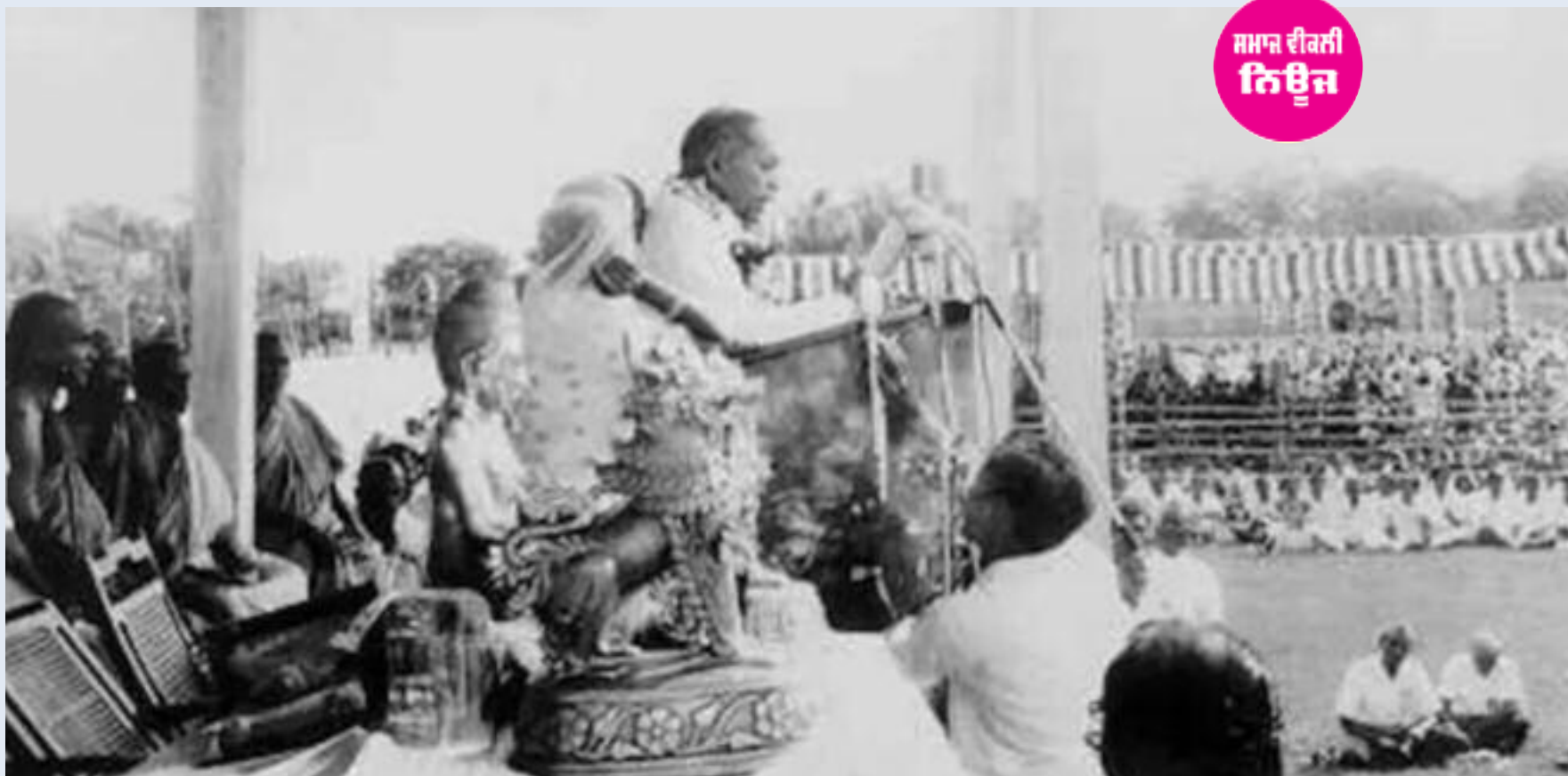
ਸਮਾਜ ਵੀਕਲੀ ਨਿਊਜ਼

ਬ੍ਰਿਹਦ੍ਰਥ ਮੌਰਿਆ, ਨੂੰ ਉਸਦੇ ਸੈਨਾਪਤੀ, ਪੁਸ਼ਯਮਿੱਤਰ ਸ਼ੁੰਗ ਦੁਆਰਾ ਕਤਲ ਕਰ ਦਿੱਤਾ ਗਿਆ ਸੀ, ਜਿਸਨੇ ਸ਼ੁੰਗ ਰਾਜਵੰਸ਼ ਦੀ ਸਥਾਪਨਾ ਕੀਤੀ ਸੀ। ਪੁਸ਼ਯਮਿੱਤਰ ਸ਼ੁੰਗ ਇੱਕ ਬ੍ਰਾਹਮਣ ਸੀ। ਇਸ ਭਾਈਚਾਰੇ ਨੇ ਇਸ ਦਿਨ ਨੂੰ ਬਹੁਤ ਪ੍ਰਮਾਣ ਨਾਲ ਮਨਾਇਆ। ਉਸ ਸਾਲ, ਇਹ ਅਸ਼ੋਕ ਵਿਜੇਦਸ਼ਮੀ ਦਾ ਹੀ ਦਿਨ ਸੀ। ਉਨ੍ਹਾਂ ਨੇ “ਅਸ਼ੋਕ” ਸ਼ਬਦ ਹਟਾ ਦਿੱਤਾ ਅਤੇ ਵਿਜੇਦਸ਼ਮੀ ਦਿਨ ਮਨਾਇਆ। ਦਸ ਮੌਰੀਆ ਸਮਰਾਟਾਂ ਦੇ ਵੱਖਰੇ ਪੁਤਲੇ ਬਣਾਉਣ ਦੀ ਬਜਾਏ, ਦਸ ਸਿਰਾਂ ਵਾਲਾ ਇੱਕ ਪੁਤਲਾ ਬਣਾਇਆ ਗਿਆ ਅਤੇ ਸਾੜਿਆ ਗਿਆ। ਸਮਰਾਟ ਅਸ਼ੋਕ ਦੀ 2500 ਸਾਲ ਪੁਰਾਣੀ ਵਿਰਾਸਤ ਨਾਲ ਜੁੜਦੇ ਹੋਏ, ਬਾਬਾ ਸਾਹਿਬ ਡਾ. ਅੰਬੇਡਕਰ ਨੇ 14 ਅਕਤੂਬਰ, 1956 ਨੂੰ ਅਸ਼ੋਕ ਵਿਜੇਦਸ਼ਮੀ ਦੇ ਦਿਨ 500,000 ਲੋਕਾਂ ਨਾਲ ਬੁੱਧ ਧਰਮ ਅਪਣਾਇਆ।