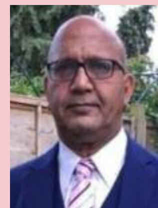
Bal Ram Sampla Geopolitics

4. https://www.outlookindia.com/national/cbi-probes-sonam-wangchuks-ladakh-institute-over-alleged-fcra-violations