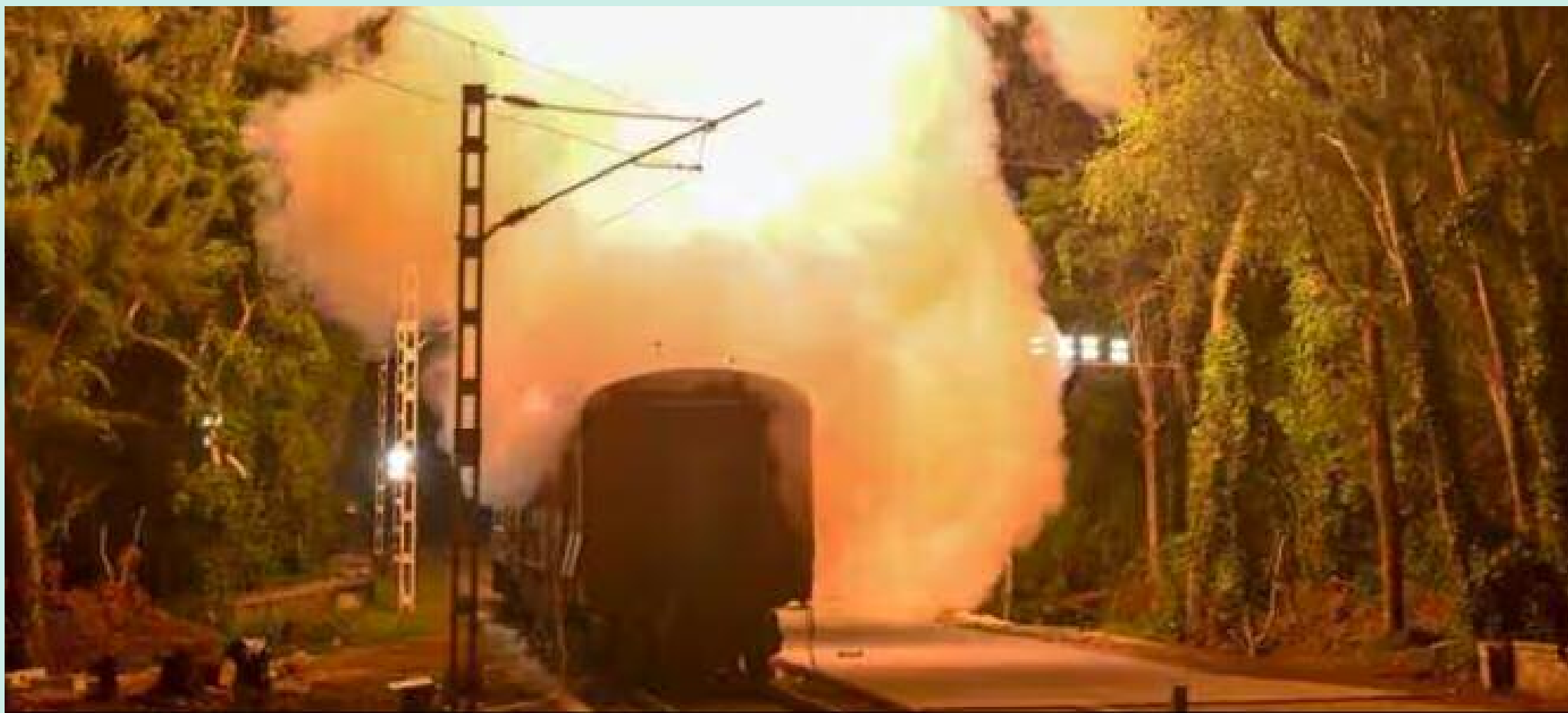
1st Rail-Based Launcher Bolsters 2000 km Strategic Deterrence.

THE ASIAN INDEPENDENT UK China has powerful satellites that can spot military activities from space. These satellites regularly pass over India and take detailed pictures of missile bases, weapon movements, and military preparations. For years, this gave China a big advantage because they could see exactly where India kept its missiles and predict what India might do in a conflict.