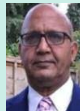
Bal Ram Sampla Geopolitics

2 https://www.republicworld.com/india/agni-prime-fired-from-a-train-why-india-s-new-2000-km-range-missile-is-a-game-changer