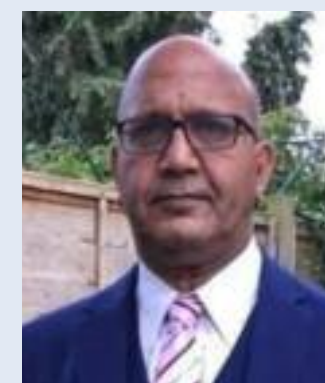
Bal Ram Sampla Geopolitics