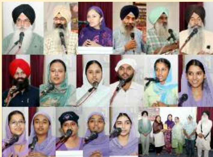
ਢਾਹਾਂ ਕਲੇਰਾਂ ਵਿਖੇ ਗੁਰੂ ਗੋਬਿੰਦ ਸਿੰਘ ਸਟੱਡੀ ਸਰਕਲ ਵੱਲੋਂ ਦੋ ਦਿਨਾਂ ਵਿਦਿਆਰਥੀ ਸ਼ਖਸੀਅਤ ਉਸਾਰੀ ਕੈਂਪ ਦੀਆਂ ਝਲਕੀਆਂ।