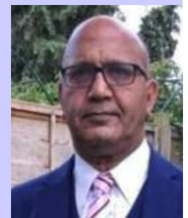
Bal Ram Sampla Geopolitics

2. https://www.the-week.in/news/world/2025/09/18/pakistani-media-s-bizarre-claims-about-new-defence-pact-if-we-face-aggression-from-india-saudi-arabia-will-stand-by-us.html