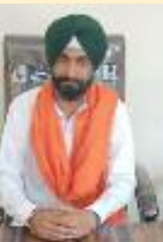
ਲੇਖਕ- ਹਰਜਿੰਦਰ ਸਿੰਘ ਚੰਦੀ ਸੂਬਾ ਪ੍ਰੈੱਸ ਸਕੱਤਰ ਬੀਕੇਯੂ ਪੰਜਾਬ