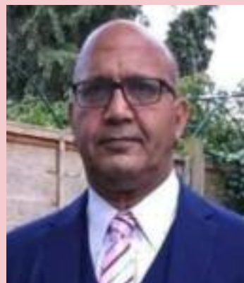
Bal Ram Sampla Geopolitics

First, it proves that the practice of mummification began much earlier than we thought. Before this discovery, most people believed that Egyptians were among the first to preserve bodies, but these Asian mummies are thousands of years older.