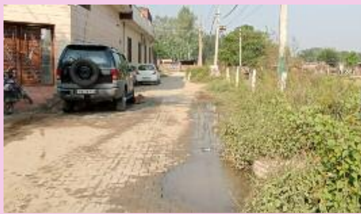
ਕਾਠਗੜ੍ਹ ਦੇ ਵਾਰਡ ਨੰਬਰ 5 ਵਿੱਚ ਸਾਫ ਪਾਣੀ ਦੀ ਹੋ ਰਹੀ ਲੀਕੇਜ਼ ਦਾ ਦ੍ਰਿਸ਼।

ਦੇ ਵਾਰਡ ਨੰਬਰ 5 ਦੇ ਖੇਡ ਕਰੀੜਾ ਸੈਂਟਰ ਨੂੰ ਜਾਣ ਵਾਲੀ ਗਲੀ ਵਿੱਚ ਲੋਕਾਂ ਦੇ ਘਰਾਂ ਨੂੰ ਪੀਣ ਵਾਲੇ ਸ਼ੁੱਧ ਪਾਣੀ ਦੀ ਜੋ ਪਾਈਪ ਲਾਈਨ ਪਾਈ ਗਈ ਹੈ ਉਹ ਲੰਬੇ ਸਮੇਂ ਤੋਂ ਲੀਕੇਜ਼ ਹੋ ਰਹੀ ਹੈ ਜਿਸ ਕਾਰਨ ਵੱਡੀ ਮਾਤਰਾ ਵਿੱਚ ਸਾਫ ਪਾਣੀ ਬਰਬਾਦ ਹੋ ਰਿਹਾ ਹੈ। ਪਾਈਪ ਲੀਕੇਜ਼ ਵਾਲੀ ਜਗ੍ਹਾ 'ਤੇ ਇੱਕ ਵੱਡਾ ਖੱਡਾ ਬਣਿਆ ਹੋਇਆ ਹੈ ਜਿੱਥੋਂ ਜਮਾਂ ਪਾਣੀ ਨੂੰ