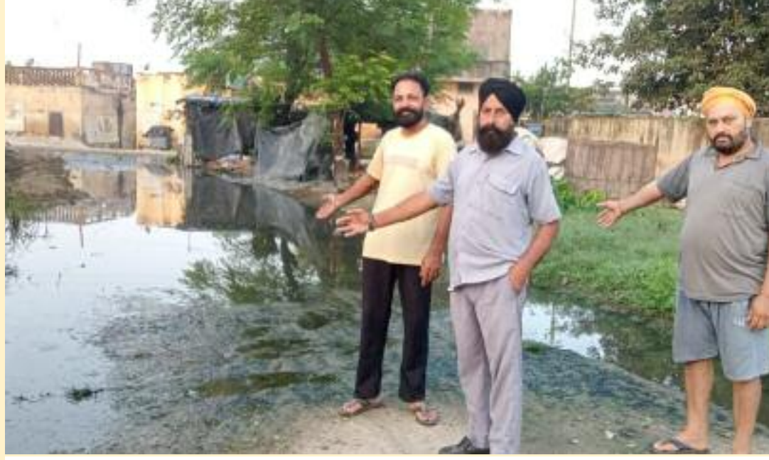
ਪਿੰਡ ਚਾਹਲ ਜੱਟਾਂ ਵਿਖੇ ਰਿਹਾਇਸ਼ੀ ਘਰਾਂ ਦੇ ਨੇੜੇ ਜਮਾਂ ਗੰਦੇ ਪਾਣੀ ਨੂੰ ਦਿਖਾਉਂਦੇ ਹੋਏ ਪਿੰਡ ਵਾਸੀ।

ਸਿੰਘ ਆਦਿ ਨੇ ਦੁਖੀ ਮਨ ਨਾਲ ਦੱਸਿਆ ਕਿ ਕਈ ਸਾਲ ਪਹਿਲਾਂ ਪਿੰਡ ਦਾ ਗੰਦਾ ਪਾਣੀ ਨਿਕਾਸੀ ਨਾਲੇ ਵੱਲ ਜਾਂਦਾ ਰਹਿੰਦਾ ਸੀ ਲੇਕਿਨ ਇੱਕ ਘਰ ਵੱਲੋਂ ਪਾਣੀ ਦੀ ਨਿਕਾਸੀ ਨੂੰ ਰੋਕਣ ਕਾਰਨ ਦੂਜੇ ਸਾਰੇ ਘਰਾਂ ਦਾ ਪਾਣੀ ਆਟਾ ਚੱਕੀ ਦੇ ਸਾਹਮਣੇ ਸੜਕ ਅਤੇ ਗਲੀ ਵਿੱਚ ਜਮਾਂ ਹੋਣਾ ਸ਼ੁਰੂ ਹੋ ਗਿਆ ਅਤੇ ਇਹ ਪਾਣੀ ਹੌਲੀ ਹੌਲੀ ਛੱਪੜ ਦਾ ਰੂਪ ਧਾਰ ਗਿਆ। ਉਹਨਾਂ ਦੱਸਿਆ ਕਿ ਜਦੋਂ ਮੀਂਹ ਪੈਂਦਾ ਹੈ ਤਾਂ ਇਹ ਪਾਣੀ ਆਲੇ ਦੁਆਲੇ ਗਲੀਆਂ ਜਾਂ ਖਾਲੀ ਜਗ੍ਹਾ ਵਿੱਚ ਫੈਲ ਜਾਂਦਾ ਹੈ। ਨਿਵਾਸੀਆਂ ਨੇ ਦੱਸਿਆ ਕਿ ਇਸ ਗੰਦੇ ਪਾਣੀ ਨਾਲ ਘਰਾਂ ਦੀਆਂ ਕੰਧਾਂ ਨੂੰ ਸਲਾਬ ਪੈ ਚੁੱਕੀ ਹੈ ਅਤੇ ਹਰ ਸਮੇਂ ਆ ਰਹੀ ਗੰਦੀ ਬਦਬੂ ਕਾਰਨ ਉਹਨਾਂ ਦਾ ਰਹਿਣਾ ਦੁਭਰ ਹੋ ਚੁੱਕਾ ਹੈ। ਇਸ ਤੋਂ