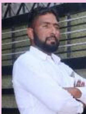
ਸੁਕਰ ਦੀਨ ਕਾਮੀਂ ਖੁਰਦ