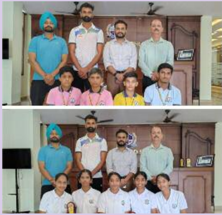
ਵਾਲੀਬਾਲ(ਲੜਕੀਆਂ) ਅੰਡਰ-14 ਦੂਜਾ ਸਥਾਨ ਤੇ 5 ਖਿਡਾਰੀ ਸਟੇਟ ਲਈ ਚੁਣੇ ਗਏ, ਵਾਲੀਬਾਲ(ਲੜਕੀਆਂ)

ਅੰਡਰ-17 ਤੀਜਾ ਸਥਾਨ ਤੇ 3 ਖਿਡਾਰੀ ਸਟੇਟ ਲਈ ਚੁਣੇ ਗਏ, ਵਾਲੀਬਾਲ(ਲੜਕੀਆਂ) ਅੰਡਰ-19 ਤੀਜਾ ਸਥਾਨ ਤੇ 3 ਖਿਡਾਰੀ ਸਟੇਟ ਲਈ ਚੁਣੇ ਗਏ, ਬਾਸਕਿਟਬਾਲ(ਲੜਕੀਆਂ) ਅੰਡਰ-14 ਦੂਜਾ ਸਥਾਨ ਤੇ 4 ਖਿਡਾਰੀ ਸਟੇਟ ਲਈ ਚੁਣੇ ਗਏ, ਬਾਸਕਿਟਬਾਲ(ਲੜਕੀਆਂ) ਅੰਡਰ -17 ਤੀਜਾ ਸਥਾਨ ਤੇ 3 ਖਿਡਾਰੀ ਸਟੇਟ ਲਈ ਚੁਣੇ ਗਏ, ਲਾਨ ਟੈਨਿਸ(ਲੜਕੀਆਂ) ਅੰਡਰ-14 ਚੋਂ 5 ਖਿਡਾਰੀ ਸਟੇਟ ਲਈ ਚੁਣੇ ਗਏ। ਸਕੂਲ ਮੈਨੇਜਮੈਂਟ ਨੇ ਮਾਣ ਮਹਿਸੂਸ ਕਰਦੇ ਹੋਏ ਦੱਸਿਆ ਕਿ ਇਹ ਵਿਦਿਆਰਥੀਆਂ ਤੇ ਕੋਚਿਸ ਦੀ ਮਿਹਨਤ ਦਾ ਹੀ ਨਤੀਜਾ ਹੈ ਤੇ ਸਾਡਾ ਮਕਸਦ ਪੜਾਈ ਦੇ ਨਾਲ-ਨਾਲ ਖੇਡਾਂ ਵਿੱਚ ਸਕੂਲ ਨੂੰ ਅੱਗੇ ਲੈਕੇ ਜਾਣਾ ਹੈ। ਇਸ ਮੌਕੇ ਸਕੂਲ ਮੈਨੇਜਮੈਂਟ ਨੇ ਵਿਦਿਆਰਥੀਆਂ ਤੇ ਕੋਚਿਸ ਨੂੰ ਵਧਾਈਆਂ ਦਿੰਦੇ ਹੋਏ ਭਵਿੱਖ ਵਿੱਚ ਹੋਰ ਵੀ ਵਧੀਆ ਪ੍ਰਦਰਸ਼ਨ ਕਰਨ ਲਈ ਪ੍ਰੇਰਿਤ ਕੀਤਾ।