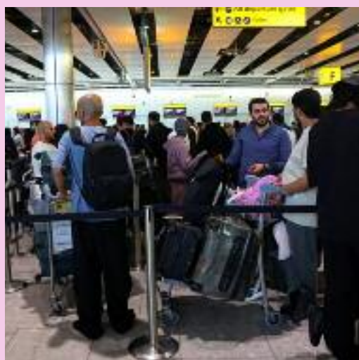
ਤਕ ਨਹੀਂ ਸੁਲਝੇ।

ਲੰਡਨ/ਬਰੱਸਲਜ਼ । ਹੀਥਰੋ ਸਣੇ ਕਈ ਯੂਰਪੀ ਹਵਾਈ ਅੱਡਿਆਂ 'ਤੇ ਅੱਜ ਵੀ ਯਾਤਰੀਆਂ ਨੂੰ ਪ੍ਰੇਸ਼ਾਨੀਆਂ ਦਾ ਸਾਹਮਣਾ ਕਰਨਾ ਪਿਆ। ਜ਼ਿਕਰਯੋਗ ਹੈ ਕਿ ਬੀਤੇ ਦਿਨ ਯੂਰਪ ਦੇ ਕਈ ਦੇਸ਼ਾਂ ਵਿਚ ਹਵਾਈ ਯਾਤਰਾ ਕਰਨ ਲਈ ਚੈਕ ਇਨ ਤੇ ਬੋਰਡਿੰਗ ਪ੍ਰਣਾਲੀ 'ਤੇ ਸਾਈਬਰ ਹਮਲਾ ਹੋਇਆ ਸੀ ਜਿਸ ਕਾਰਨ ਵੱਡੀ ਗਿਣਤੀ ਉਡਾਣਾਂ ਜਾਂ ਤਾਂ ਰੱਦ ਕਰਨੀਆਂ ਪਈਆਂ ਸਨ ਜਾਂ ਦੇਰੀ ਨਾਲ ਚੱਲੀਆਂ ਸਨ ਤੇ ਇਹੀ ਹਾਲਾਤ ਅੱਜ ਵੀ ਜਾਰੀ ਰਹੇ। ਬਰੱਸਲਜ਼ ਏਅਰਪੋਰਟ ਦੇ ਅਧਿਕਾਰੀਆਂ ਨੇ ਕਿਹਾ ਕਿ ਇਹ ਸਮੱਸਿਆ ਹਾਲੇ ਹੱਲ ਨਹੀਂ ਹੋਈ ਜਿਸ ਕਰ ਕੇ ਉਨ੍ਹਾਂ ਏਅਰਲਾਈਨਾਂ ਨੂੰ ਉਨ੍ਹਾਂ ਦੀਆਂ ਅੱਧੀਆਂ ਉਡਾਣਾਂ ਨੂੰ ਰੱਦ ਕਰਨ ਲਈ ਕਿਹਾ ਹੈ। ਉਨ੍ਹਾਂ ਕਿਹਾ ਕਿ ਸਾਈਬਰ ਹਮਲੇ ਕਾਰਨ ਚੈਕ-ਇਨ ਸਿਸਟਮ ਨਾਲ ਜੁੜੇ ਮੁੱਦੇ ਹਾਲੇ