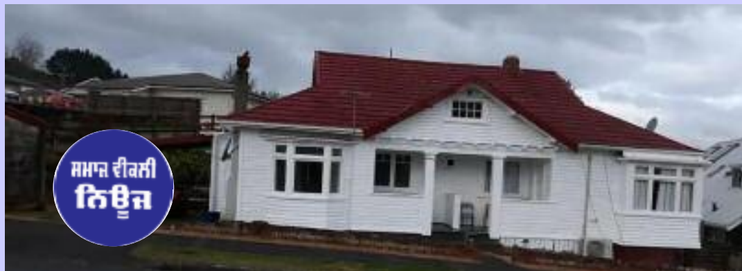
ਸਮਾਜ ਦੀਕਲੀ ਨਿਊਜ਼

ਮੈਂ ਜਦੋਂ ਵੀ ਘਰ ਖਰੀਦਦਾ ਤਾਂ ਆਪਣੇ ਸਟਾਫ ਵਾਸਤੇ ਮਠਿਆਈ ਲੈ ਕੇ ਜਾਂਦਾ ਅਤੇ ਚਾਹ ਸਾਰਿਆਂ ਨਾਲ ਇਕੱਠੇ ਬੈਠ ਕੇ ਹੀ ਪੀਂਦੇ ਹੁੰਦੇ ਸੀ ਲ ਮਠਿਆਈ ਖਾਂਦੇ ਖਾਂਦੇ ਨਾਲ ਹੀ ਸਾਰੇ ਸਟਾਫ ਨੂੰ ਦੱਸਣਾ ਕਿ ਕੀਵੀਫਰੂਟ ਤੋਂ ਵੱਧ ਆਮਦਨ ਘਰ ਖਰੀਦਣ ਵਿੱਚ ਹੈ। ਅੰਕਲ ਜੀ ਨਾਲ ਵੀ ਇਹ ਗੱਲ ਕਰ ਲੈਂਦਾ ਹੁੰਦਾ ਸੀ। ਕਈ ਵਾਰ ਮੈਂ ਹਫਤੇ ਬਾਦ ਹੀ ਘਰ ਖਰੀਦ ਲੈਣਾ ਅਤੇ ਫਿਰ