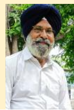
ਕਿਤੇ ਨੀਂ ਤੇਰਾ ਰੁਤਬਾ ਘੱਟਦਾ, ਜੇ ਹੱਸ ਕੇ ਬੁਲਾ ਲਵੇਂ ਕਿੱਧਰੇ।" (ਚਲਦਾ)

ਰਾਂਝਣਾ ਵੇ ਚਾਵ੍ਹਾਂ ਨੂੰ ਗੁਲਾਬੀ ਰੰਗ ਦੇ, ਨਿੱਤ ਇਹ ਸ਼ਰਾਰਤਾਂ ਕਰਾ ਕੇ ਲੰਘ ਦੇ। ਕੇਸ਼ਸ਼ਾਂ ਨਾਦਾਨ ਨਾ ਨਾਰਾਜ਼ ਹੋਣ ਵੇ, ਤਾਂਹੀਓਂ ਤੈਥੋਂ ਐਨਾ ਕੁ ਇਸ਼ਾਰਾ ਮੰਗਦੇ। ਆਹ ਨੀਵੀਂ ਪਾ ਕੇ ਹੱਸਦੈਂ ਫੁਬੀਲਿਆ, ਜੇ ਅੱਖੀਆਂ ਮਿਲਾ ਲਵੇਂ ਕਿੱਧਰੇ, ਆਹ ਨੀਵੀਂ ਪਾ ਕੇ ਹੱਸਦੈਂ ਫੁਬੀਲਿਆ, ਜੇ ਅੱਖੀਆਂ ਮਿਲਾ ਲਵੇਂ..... ਕਿੱਧਰੇ, ਕਿਤੇ ਨੀਂ ਸ਼ਾਨੋਂ ਸ਼ੌਕਤਾਂ ਜਾਂਦੀਆਂ, ਮੁਹੱਬਤਾਂ ਜਤਾ ਲਵੇਂ ਜੇ ਕਿੱਧਰੇ ਕਿਤੇ ਨੀਂ ਤੇਰਾ ਰੁਤਬਾ ਘੱਟਦਾ, ਜੇ ਹੱਸ ਕੇ ਬੁਲਾ ਲਵੇਂ ਕਿੱਧਰੇ ... ਖ਼ਾਬਾਂ ਤੇ ਖ਼ਿਆਲਾਂ ਨੂੰ ਵੀ ਹੁੰਦਾ ਸ਼ੱਕ ਵੇ, ਜਦੋਂ ਕਿਤੇ ਗੁੱਸੇ 'ਚ ਜਿਤਾਓਣੈਂ ਹੱਕ ਵੇ। ਰੋਅਬ ਤੇਰੇ ਸਾਨੂੰ ਤਾਂ ਹੈਰਾਨ ਕਰਦੇ, ਅੱਖਾਂ ਪਾ ਕੇ ਵੇਖੋਂ ਜਦੋਂ ਇਕ ਟੱਕ ਵੇ.....। ਏਹ ਸੁਪਨੇ ਨੂੰ ਸੁਪਨੇ 'ਚੋਂ ਕੱਢ ਕੇ, ਹਕੀਕਤਾਂ ਬਣਾ ਲਵੇਂ ਕਿੱਧਰੇ, ਏਹ ਸੁਪਨੇ ਨੂੰ ਸੁਪਨੇ 'ਚੋਂ ਕੱਢ ਕੇ, ਹਕੀਕਤਾਂ ਬਣਾ ਲਵੇਂ ਕਿੱਧਰੇ, ਕਿਤੇ ਨੀਂ ਸ਼ਾਨੋਂ ਸ਼ੌਕਤਾਂ ਜਾਂਦੀਆਂ, ਮੁਹੱਬਤਾਂ ਜਤਾ ਲਵੇਂ ਜੇ ਕਿੱਧਰੇ,