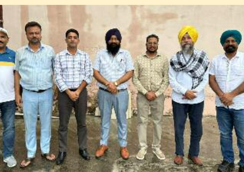
ਸਰਕਾਰ ਦੇ ਵਿੱਤ ਮੰਤਰੀ ਦੀ ਦਰ ਦੇ ਅਨੁਸਾਰ ਰਹੇ ਹਨ ਤੇ ਪੰਜਾਬ ਵਾਂਗ ਖਾਲੀ ਖਜ਼ਾਨਾ ਸੈਂਟਰ ਸਰਕਾਰ ਦੀ ਤਰਜ਼ ਸਰਕਾਰ ਦੇ ਮੁਲਾਜ਼ਮ ਮੰਤਰੀ ਨਾ ਬਣਨ ਦੀ ਤੇ ਡੀ ਏ ਦੇਣ ਦਾ ਐਲਾਨ ਵਰਗ ਨੂੰ ਡੀਏ ਦੀਆਂ ਬਜਾਇ ਮੁਲਾਜ਼ਮਾਂ ਨੂੰ ਕਰਨ, ਕਿਉਂਕਿ ਹੁਣ ਕਿਸਤਾਂ ਦੀ ਬਹੁਤ ਉਡੀਕ ਵੱਧਦੀ ਹੋਈ ਮਹਿੰਗਾਈ ਤਿਓਹਾਰਾਂ ਦੇ ਦਿਨ ਆ ਹੈ ਤਾਂ ਜੋ ਮੁਲਾਜ਼ਮ ਵਰਗ

ਵਾਂਗ ਖਾਲੀ ਖਜ਼ਾਨਾ ਸੈਂਟਰ ਸਰਕਾਰ ਦੀ ਤਰਜ਼ ਸਰਕਾਰ ਦੇ ਮੁਲਾਜ਼ਮ ਮੰਤਰੀ ਨਾ ਬਣਨ ਦੀ ਤੇ ਡੀ ਏ ਦੇਣ ਦਾ ਐਲਾਨ ਵਰਗ ਨੂੰ ਡੀਏ ਦੀਆਂ ਬਜਾਇ ਮੁਲਾਜ਼ਮਾਂ ਨੂੰ ਕਰਨ, ਕਿਉਂਕਿ ਹੁਣ ਕਿਸਤਾਂ ਦੀ ਬਹੁਤ ਉਡੀਕ ਵੱਧਦੀ ਹੋਈ ਮਹਿੰਗਾਈ ਤਿਓਹਾਰਾਂ ਦੇ ਦਿਨ ਆ ਹੈ ਤਾਂ ਜੋ ਮੁਲਾਜ਼ਮ ਵਰਗ