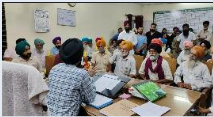
ਦਿਵਾਇਆ ਕਿ ਆਉਣ ਵਾਲੇ ਦਿਨਾਂ ਵਿੱਚ ਕੁਝ ਕਾਨੂੰਨੀ ਉਲਝਣਾਂ ਦੂਰ ਕਰਕੇ ਪਲਾਂਟ ਦਾ ਪ੍ਰਬੰਧ ਅਸੀਂ ਆਪਣੇ ਹੱਥਾਂ ਵਿੱਚ ਲੈ ਕੇ ਪਲਾਂਟ ਦੀ ਰਿਪੇਅਰ ਕਰਾਂਗੇ ਮਿੱਲ ਨੂੰ ਸਮੇਂ ਸਿਰ ਠੀਕ ਕਰਕੇ ਚਲਾਵਾਂਗੇ। ਅੱਜ

ਹੈ। ਕਿਸਾਨਾਂ ਨੂੰ ਗੰਨਾ ਲੈ ਕੇ ਕਈ ਦਿਨ ਮਿੱਲ ਵਿੱਚ ਖੜ੍ਹਨਾ ਪੈਂਦਾ ਹੈ ਅੱਜ ਦੀ ਤਰੀਕ ਵਿੱਚ ਵੀ ਉਹੀ ਹਾਲਾਤਾਂ ਵਿੱਚ ਹੈ। ਪਲਾਂਟ ਦੇ ਵਰਕਰ ਵਿਹਲੇ ਬੈਠੇ ਹਨ ਉਹਨਾਂ ਨੂੰ ਚਾਰ ਮਹੀਨਿਆਂ ਤੋਂ ਤਨਖਾਹ ਨਹੀਂ ਮਿਲ ਰਹੀ। ਮਿੱਲ ਵੱਲ ਕਰੋੜਾਂ ਰੁਪਏ ਕਿਸਾਨਾਂ ਦਾ ਬਕਾਇਆ ਫਸਿਆ ਹੋਇਆ ਹੈ। ਇਹਨਾਂ ਸਾਰੀਆਂ ਗੱਲਾਂ ਤੇ ਮਿੱਲ ਪ੍ਰਬੰਧਕਾਂ ਨਾਲ ਗੱਲਬਾਤ ਹੋਈ ਮਿੱਲ ਪ੍ਰਬੰਧਕਾਂ ਨੇ ਕਿਸਾਨਾਂ ਨੂੰ ਵਿਸ਼ਵਾਸ