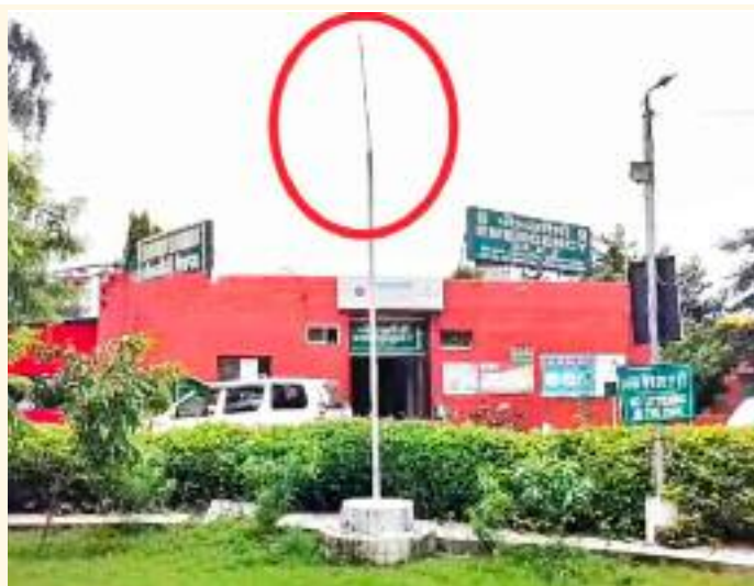
ਸਿਵਲ ਹਸਪਤਾਲ ਦੇ ਪ੍ਰਸ਼ਾਸਕੀ ਅਮਲੇ ਦੇ ਢੇਲ ਦਾ ਪੋਲ ਖੁਲ੍ਹ ਕੇ ਸਾਹਮਣੇ ਆ ਗਿਆ ਹੈ ਜਦੋਂ ਦੇਸ਼ ਦੇ ਸਭ ਤੋਂ ਜਿਆਦਾ ਮਹੱਤਵਪੂਰਨ ਰਾਸ਼ਟਰੀ ਤਿਉਹਾਰ ਸੁਤੰਤਰਤਾ ਦਿਵਸ ਮੌਕੇ ਸਿਵਲ ਹਸਪਤਾਲ ਦਾ ਪ੍ਰਸ਼ਾਸਨ ਕੀ ਅਮਲਾ ਤਿਰੰਗਾ ਝੰਡਾ ਲਹਿਰਾਉਣਾ ਹੀ ਭੁੱਲ ਗਿਆ। ਮਿਲੀ ਜਾਣਕਾਰੀ

ਹੈ ਵੈਸੇ ਤਾਂ ਸ਼ੁਰੂ ਤੋਂ ਹੀ ਸਿਵਲ ਹਸਪਤਾਲ ਦੇ ਪ੍ਰਸ਼ਾਸਕੀ ਅਮਲੇ ਦਾ ਬਾਬਾ ਆਲਮ ਨਿਰਾਲਾ ਹੀ ਰਿਹਾ ਹੈ ਭਾਵੇਂ ਆਕਸੀਜਨ ਪਲਾਂਟ ਦੀ ਰੱਖ ਰਖਾਓ ਦਾ ਮਾਮਲਾ ਹੋਵੇ, ਭਾਵੇਂ ਪੱਤਰਕਾਰਾਂ ਲਈ ਸਿਵਲ ਹਸਪਤਾਲ ਵਿੱਚ ਕਵਰੇਜ ਅਤੇ ਫੋਟੋਗ੍ਰਾਫੀ ਕਰਨ ਤੋਂ ਮਨਾਹੀ ਦੇ ਪੋਸਟਰ ਲਗਾਉਣ ਦਾ ਮਾਮਲਾ ਹੋਵੇ, ਭਾਵੇਂ ਐਮਰਜੈਂਸੀ ਵਿੱਚ ਬਿਨਾਂ ਬਿਜਲੀ ਤੋਂ ਮੋਬਾਈਲ ਦੀਆਂ ਲਾਈਟਾਂ ਨਾਲ ਮਰੀਜ਼ਾਂ ਦੇ ਟੀਕੇ ਲਾਉਣ ਦਾ ਮਾਮਲਾ ਹੋਵੇ, ਭਾਵੇਂ ਡਾਕਟਰੀ ਅਮਲੇ ਵੱਲੋਂ ਬਿਨਾਂ ਮਨਜ਼ੂਰੀ ਤੋਂ ਸਿਵਲ ਹਸਪਤਾਲ ਦੇ ਅੰਦਰ ਧਰਨੇ ਪ੍ਰਦਰਸ਼ਨ ਕਰਨ ਦਾ ਮਾਮਲਾ ਹੋਵੇ, ਸਿਵਲ ਹਸਪਤਾਲ ਹੁਸ਼ਿਆਰਪੁਰ ਦਾ ਪ੍ਰਸ਼ਾਸਨਿਕ ਅਮਲਾ ਹਮੇਸ਼ਾ ਹੀ ਅਖਬਾਰਾਂ ਦੀਆਂ ਸੁਰਖੀਆਂ ਬਣਦਾ ਰਿਹਾ। ਹੁਣ ਇਸ ਤਾਜੀ ਘਟਨਾ ਵਿੱਚ