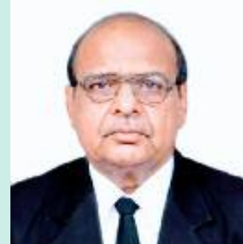
ਮਿੱਤਰ ਸੈਨ ਮੀਤ

ਨਾਲ ਸਕੂਲ ਮੁਖੀ ਵੱਲੋਂ ਤਸਦੀਕ ਕਰਕੇ ਭੇਜੀ ਜਾਵੇਗੀ।