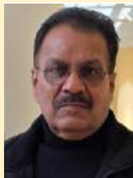
ਹਰੀ ਕ੍ਰਿਸ਼ਨ ਬੰਗਾ