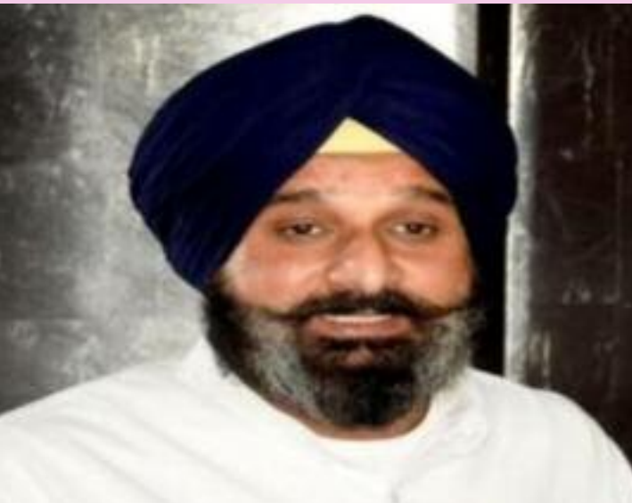
ਵੀ ਫੈਸਲਾ ਨਹੀਂ ਹੋਇਆ ਅਤੇ ਸੁਣਵਾਈ ਫੇਰ ਮੁਲਤਵੀ ਕਰ ਦਿੱਤੀ ਗਈ ਸੀ। ਇਹ ਛੇਵੀਂ ਵਾਰ ਹੈ ਜਦੋਂ ਅਦਾਲਤ ਨੇ ਉਨ੍ਹਾਂ ਦੀ ਜ਼ਮਾਨਤ ਪਟੀਸ਼ਨ 'ਤੇ ਆਪਣਾ ਫੈਸਲਾ ਰਾਖਵਾਂ ਰੱਖ ਲਿਆ ਹੈ।

ਮੁਹਾਲੀ। ਮੁਹਾਲੀ ਦੀ ਅਦਾਲਤ 'ਚ ਬਿਕਰਮ ਸਿੰਘ ਮਜੀਠੀਆ ਦੀ ਜ਼ਮਾਨਤ ਅਰਜ਼ੀ ਉਤੇ ਸੁਣਵਾਈ ਮੁੜ ਤੋਂ ਮੁਲਤਵੀ ਕਰ ਦਿੱਤੀ ਗਈ ਹੈ। ਹੁਣ ਇਸ ਮਾਮਲੇ ਉਤੇ ਸੁਣਵਾਈ 13 ਅਗਸਤ ਨੂੰ ਹੋਵੇਗੀ। ਇਸ ਤੋਂ ਇਲਾਵਾ ਬੈਰਕ ਬਦਲਣ ਦੇ ਮਾਮਲੇ ਉਤੇ ਵੀ ਸੁਣਵਾਈ ਦੀ ਅਗਲੀ ਤਰੀਕ 21 ਅਗਸਤ ਪਾ ਦਿੱਤੀ ਗਈ ਹੈ। ਜ਼ਿਕਰਯੋਗ ਹੈ ਕਿ ਪੰਜਾਬ ਦੇ ਸਾਬਕਾ ਮੰਤਰੀ ਅਤੇ ਸੀਨੀਅਰ ਸ਼ੋਮਣੀ ਅਕਾਲੀ ਦਲ ਆਗੂ ਬਿਕਰਮ ਸਿੰਘ ਮਜੀਠੀਆ ਇਸ ਸਮੇਂ ਨਾਭਾ ਜੇਲ੍ਹ 'ਚ ਬੰਦ ਹਨ। ਵਿਜੀਲੈਂਸ ਬਿਊਰੋ ਨੇ 25 ਜੂਨ ਨੂੰ ਆਮਦਨ ਤੋਂ ਵੱਧ ਜਾਇਦਾਦ ਦੇ ਮਾਮਲੇ ਵਿੱਚ ਮਜੀਠੀਆ ਨੂੰ ਅੰਮ੍ਰਿਤਸਰ ਸਥਿਤ ਉਨ੍ਹਾਂ ਦੇ ਘਰ ਤੋਂ ਗ੍ਰਿਫਤਾਰ ਕੀਤਾ ਸੀ। ਬੀਤੇ ਦਿਨ ਵੀ ਮਜੀਠੀਆ ਦੀ ਜ਼ਮਾਨਤ ਅਰਜ਼ੀ 'ਤੇ ਸੁਣਵਾਈ ਹੋਈ ਅਤੇ ਲਗਭਗ ਡੇਢ ਘੰਟਾ ਬਹਿਸ ਹੋਈ ਸੀ। ਹਾਲਾਂਕਿ ਕੋਈ