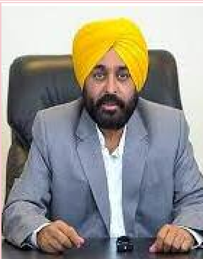
ਮੌਦੀ ਸਰਕਾਰ ਨਾਲ ਚੱਲ ਰਹੀ ਹੈ, ਪਰ ਕਈ ਭਾਵੇਂ ਤਹਿ ਦਿਲੋਂ ਇਮਾਨਦਾਰੀ ਵਾਰ ਦੂਸਰੀਆਂ ਸਟੇਟਾਂ ਵਿੱਚ,

ਸਲਾਹਕਾਰ, ਪੰਜਾਬ ਦੇ ਪੁਰਾਣੇ ਰਿਟਾਇਰਡ ਪ੍ਰਸ਼ਾਸਕ, ਵਿਧਾਨ ਸਭਾ ਦੇ ਐਮ.ਐਲ.ਏ ਤੇ ਵਜ਼ੀਰ ਮਿਲੇ ਹਨ, ਕੰਮ ਤੁਸੀਂ ਬਹੁਤ ਵਧੀਆ ਕਰ ਰਹੇ ਹੋ, ਨਿਸ਼ਚਿੰਤ ਹੋ ਕੇ ਸਰਕਾਰ ਚਲਾਓ ! ਸਾਰੀ ਦੁਨੀਆ ਉਤੇ ਭੁੱਖ ਨੰਗ ਤੇ ਬੁਰਾ ਤੰਗ ਵਾਲੀ ਹਾਲਤ ਬਣੀ ਹੋਈ ਹੈ, ਜਿਹੜੀ ਲੋਕਾਂ ਨੇ ਬਨਾਵਟੀ ਬਣਾਈ ਹੋਈ ਹੈ। ਰੱਜੇ ਪੁੱਜੇ ਲੋਕ ਵੀ ਆਪਣੇ ਆਪ ਨੂੰ ਭਿਖਾਰੀ ਬਣ ਕੇ ਦੂਸਰਿਆਂ ਦੇ ਹੱਕ ਖੋਹਕੇ ਖਾਣਾ ਚਾਹੁੰਦੇ ਹਨ। ਉਨ੍ਹਾਂ ਤੇ ਨਕੇਲ ਕਸਣ ਦੀ ਜ਼ਰੂਰਤ ਹੈ। ਸਮਾਜ ਦੀ ਬਹੁਗਿਣਤੀ ਤੁਹਾਡੀ ਕਦਰਦਾਨ ਹੈ। ਵਾਕਿਆ ਹੀ ਤੁਸੀਂ ਪੰਜਾਬ ਨੂੰ ਰੋਲ ਮਾਡਲ ਬਣਾਉਣ ਵਿੱਚ ਕਾਮਯਾਬ ਹੋ ਜਾਓਗੇ। ਝੂਠੀਆਂ ਪਾਰਟੀਆਂ ਤੋਂ ਬਿਲਕੁਲ ਘਬਰਾਓ ਨਾ। ਆਪਣੇ ਸਮੇਂ ਵਿੱਚ ਜਿਹੜੀ ਲੁੱਟ ਇਨ੍ਹਾਂ ਪਾਈ ਸੀ, ਲੋਕਾਂ ਨੂੰ ਨਹੀਂ ਭੁੱਲਦੀ। ਸੱਚੇ ਦਿਲੋਂ ਇਮਾਨਦਾਰੀ ਨਾਲ ਕੀਤੇ ਕੰਮਾਂ ਦੀ ਦਾਦ ਪਰਮਾਤਮਾ ਵੀ ਦਿੰਦਾ ਹੈ।