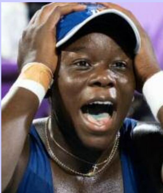
ਟੈਨਿਸ ਖਿਡਾਰਨ ਵਿਕਟੋਰੀਆ ਮਾਥੋਕੋ ਦੀ ਇੱਕ ਤਸਵੀਰ।

ਫਾਈਨਲ ਵਿੱਚ ਪ੍ਰਵੇਸ਼ ਕਰ ਲਿਆ। ਕੁੱਲ 2 ਘੰਟੇ 46 ਮਿੰਟ ਚਲੇ ਇਸ ਮੈਚ ਚ ਆਪਣੀ ਸ਼ਾਨਦਾਰ ਜਿੱਤ ਮਗਰੋਂ ਭਾਵਕ ਹੋਈ 18 ਸਾਲਾ ਟੈਨਿਸ ਵਿਕਟੋਰੀਆ ਮਾਥੋਕੋ ਨੇ ਕਿਹਾ ਕਿ ਉਸ ਦਾ ਅਗਲਾ ਨਿਸ਼ਾਨਾ ਕੈਨੇਡਾ ਲਈ ਫਾਈਨਲ ਮੁਕਾਬਲਾ ਜਿੱਤਣ ਹੈ।