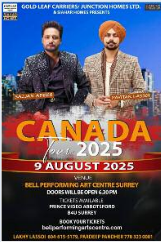
ਪ੍ਰੋਗਰਾਮ ਦਾ ਇੱਕ ਪੋਸਟਰ।